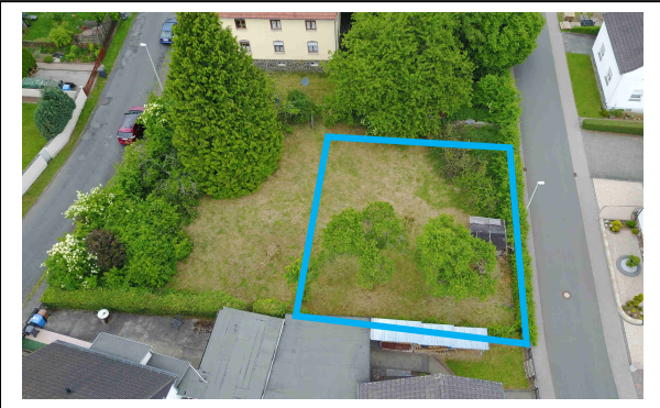
Grundstücksansicht (Aufnahmedatum 13.06.2017)

Amtsgericht: Weilburg Aktenzeichen: 078 K 008/2016