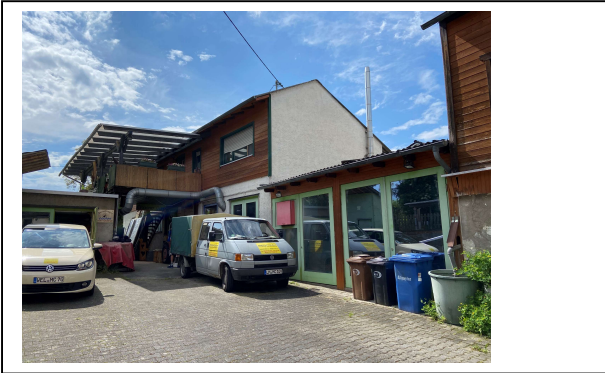
Ansicht Nebengebäude (Werkstatt) & Garage