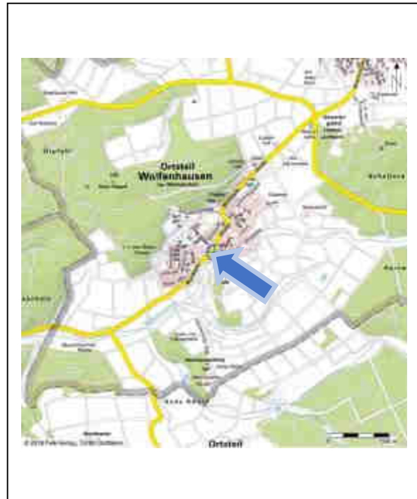
Lage im Ort