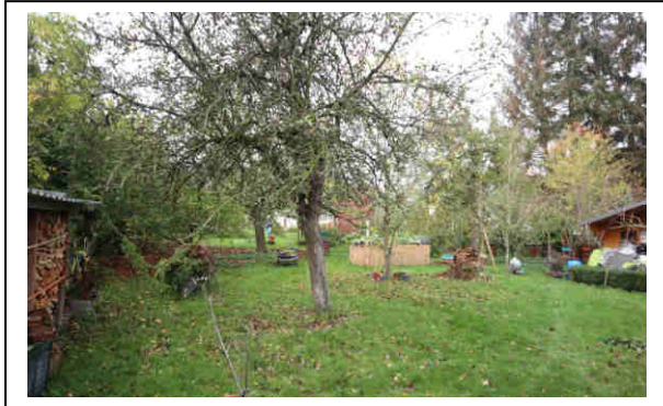
unbebautes Grundstück (Kirmsseweg)