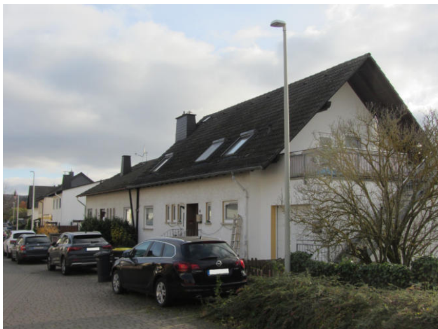
Bild 4: Gesamtansicht des Bewertungsobjekts aus nordwestlicher Richtung