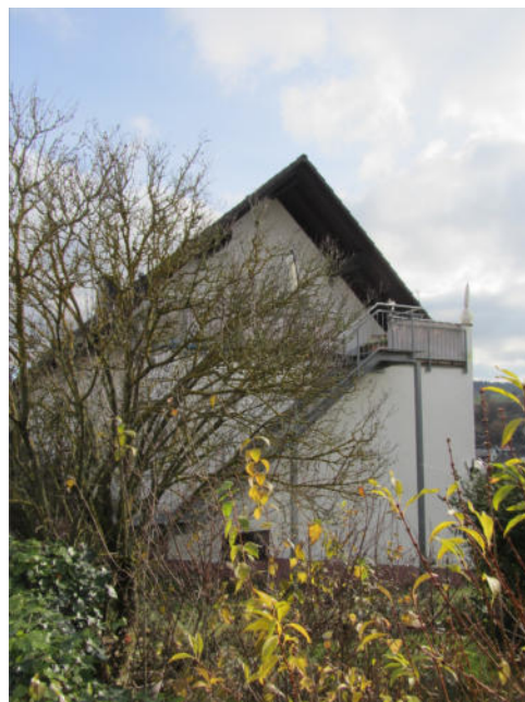
Bild 2: Giebelseite des Bewertungsobjekts aus nordwestlicher Richtung