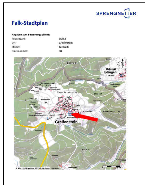
Lage im Ort http://www.sprengnetter.de