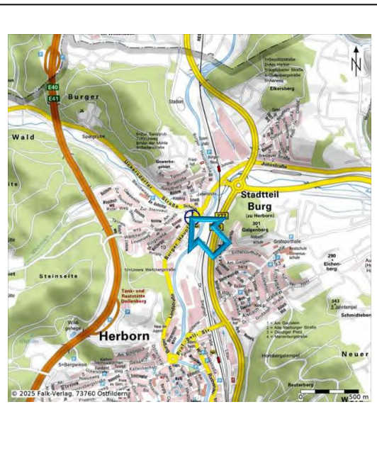
Lage im Ort