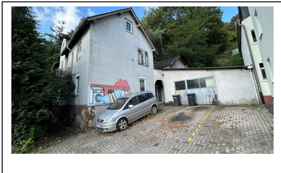
Straßenansicht II Objektbeschreibung