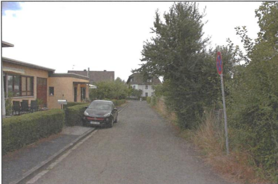
Bild A3 Blick in die Erschließungsstraße