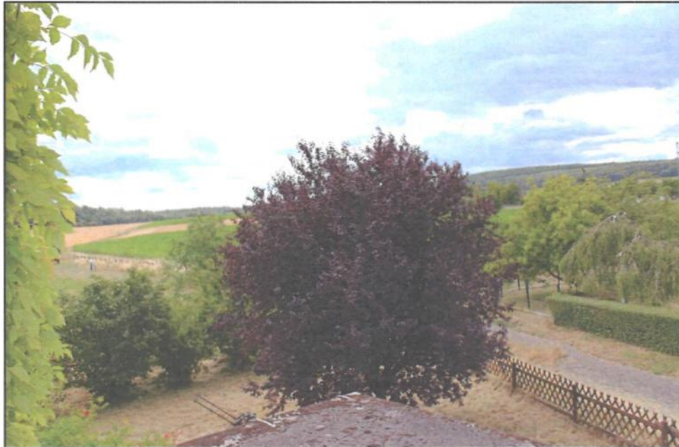
Bild A5 Umfeld