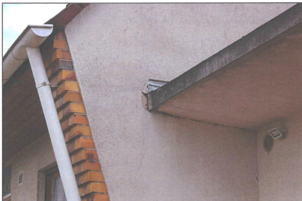
Bild D6 Beispiel Unterhaltungsbesonderheiten