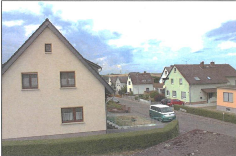
Bild A7 Umfeld