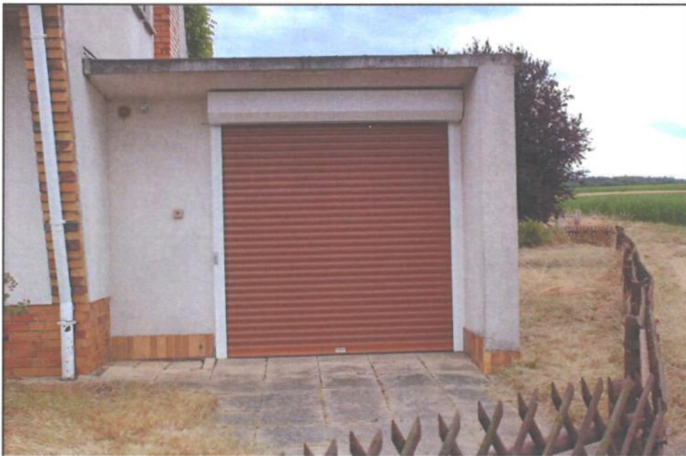
Bild B6 Garage