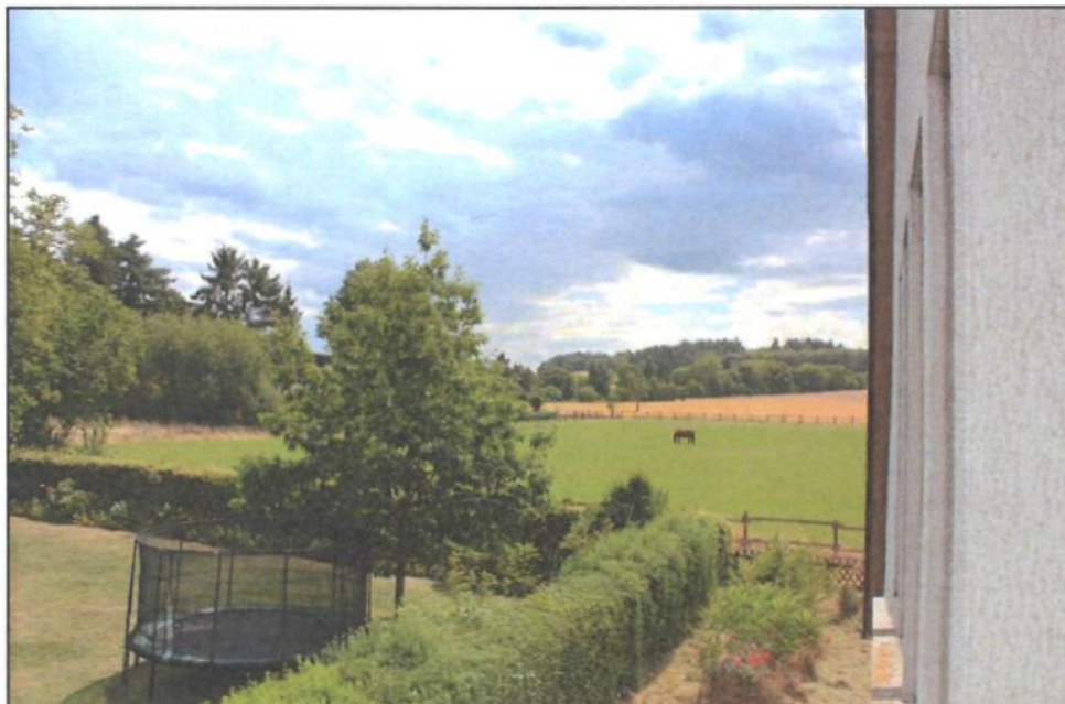
Bild A4 Umfeld