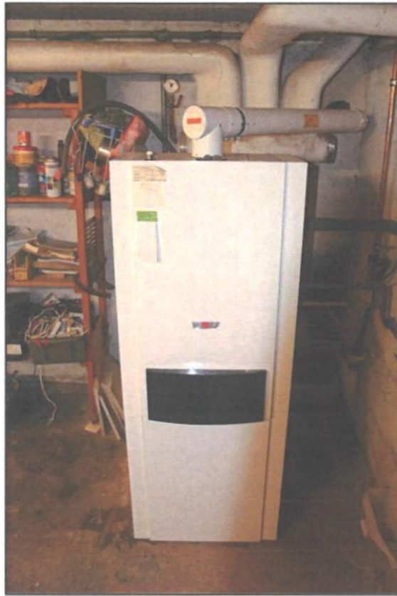
Bild C3 Beispiel Haustechnik