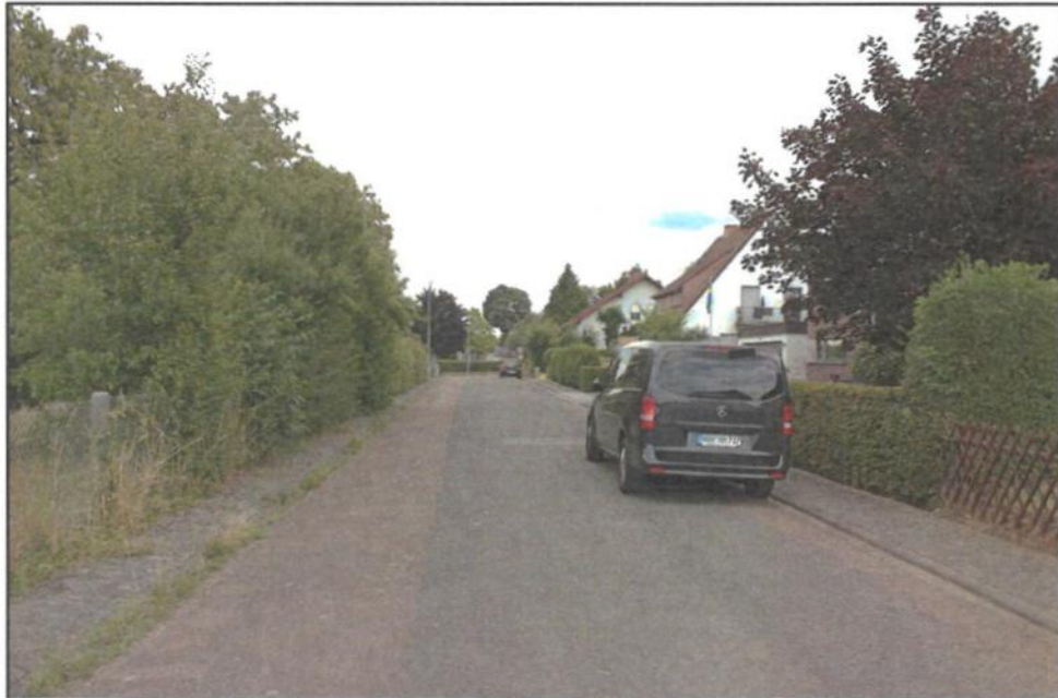
Bild A1 Blick in die Erschließungsstraße