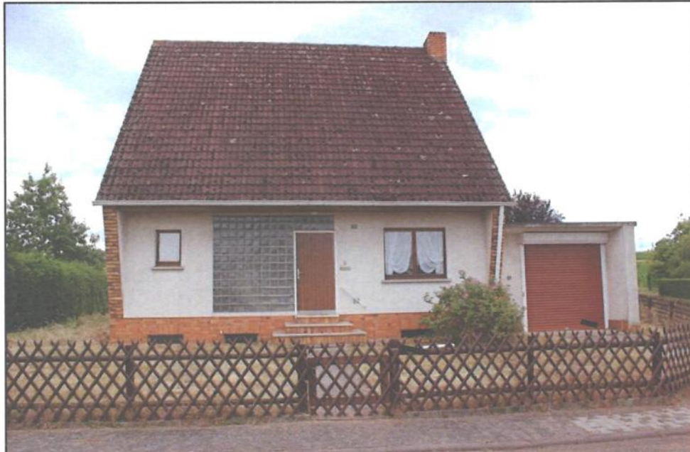
Bild B1 exemplarische Gebäudeansicht