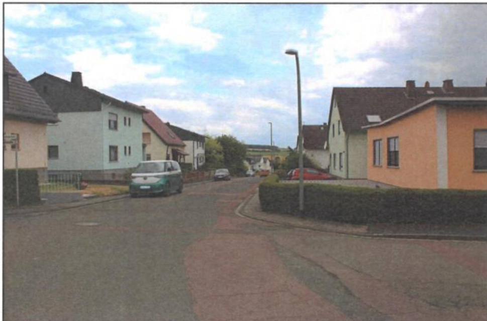
Bild A2 Blick in die Erschließungsstraße