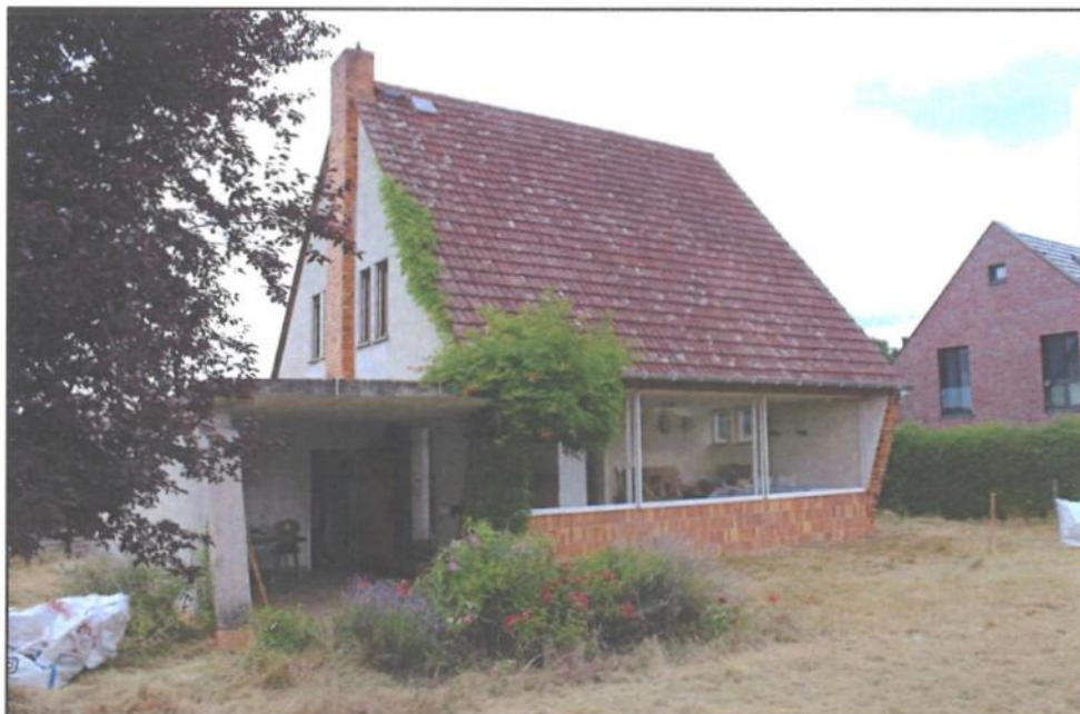
Bild B4 exemplarische Gebäudeansicht