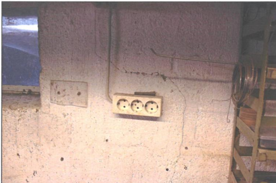
Bild C4 Beispiel Haustechnik