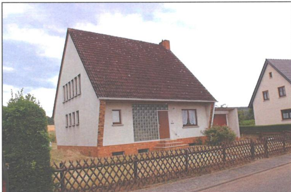
Bild B2 exemplarische Gebäudeansicht