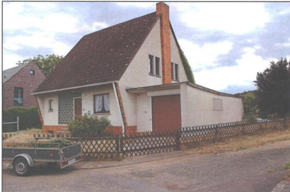
Bild B3 exemplarische Gebäudeansicht