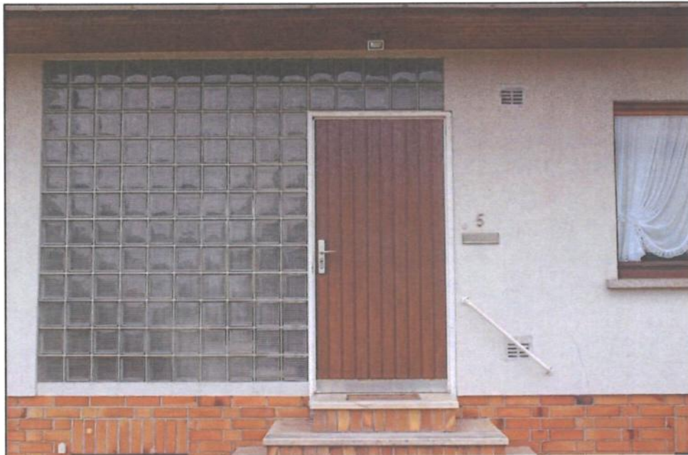
Bild B7 Hauseingang