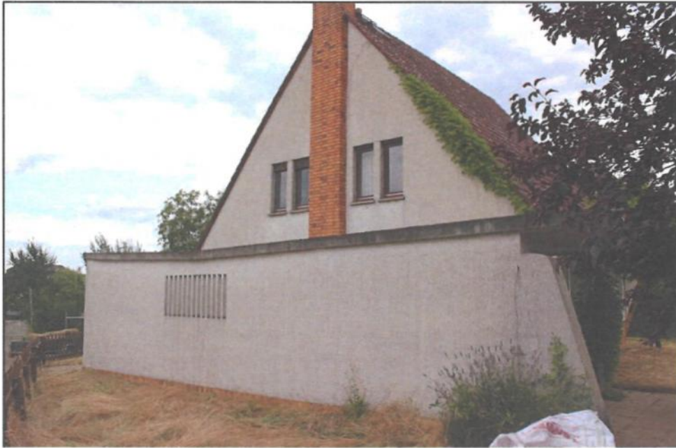
Bild B5 exemplarische Gebäudeansicht