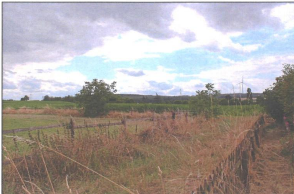
Bild A6 Umfeld