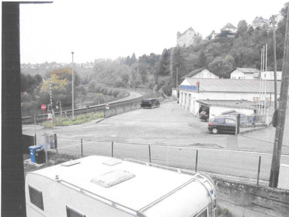
Foto Nr. 34: OG, Ausblick aus westlichstem Wohn-/Schlafraum Blickrichtung Norden