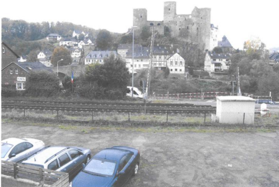
Foto Nr. 33: OG, Ausblick aus westlichstem Wohn-/Schlafraum Blickrichtung Westen

Objekt: Brückeberg 2 65594 Runkel bebaut mit einem Einfamilienwohnhaus Ortstermin: 16.10.2023