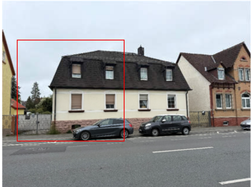
Foto 1 des SV: Doppelhaushälfte Frankfurter Straße 73 in Dreieich-Sprendlingen, Ansicht von Westen; Rotmarkierung d.d. SV