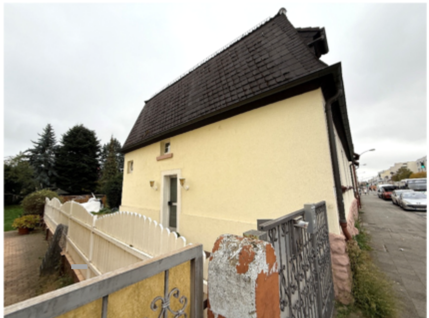
Foto 2 des SV: Doppelhaushälfte Frankfurter Straße 73, Ansicht von Norden, Hauseingangsseite