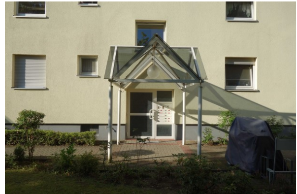
Ansicht des Hauseingangsbereiches