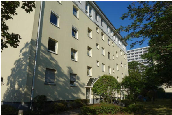
Ansicht des Bewertungsobjekts