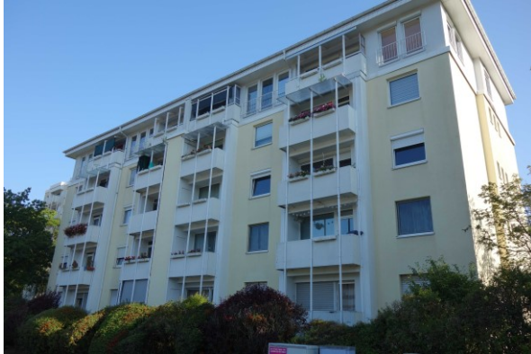
Ansicht des Bewertungsobjekts