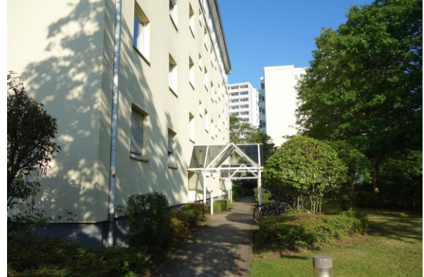
Ansicht des Bewertungsobjekts