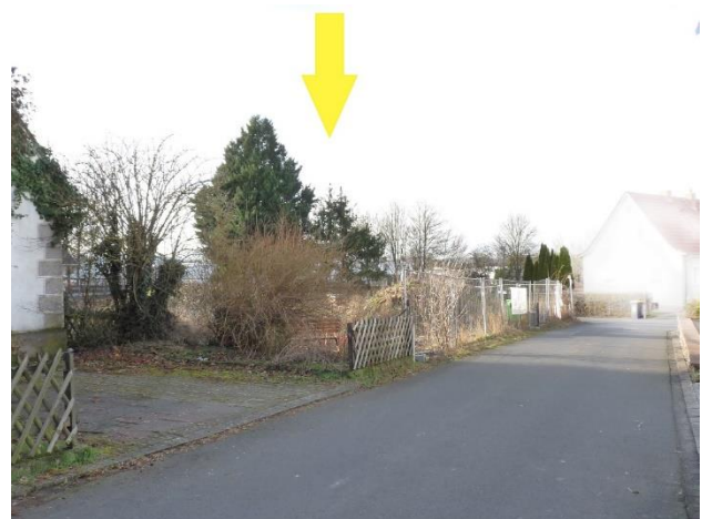
Foto 1 – Blick von der Straße „Im kleinen Feld“ in nordwestliche Richtung auf das Bewertungsgrundstück