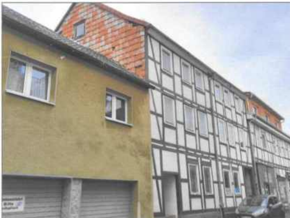
Abb. 6: Straßenansicht mit Umgebungsbebauung