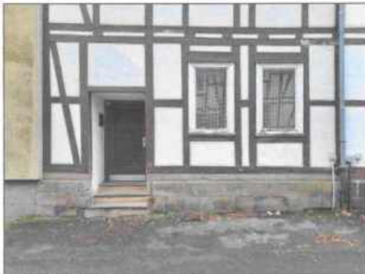
Abb. 8: Straßenseite, Erdgeschoß