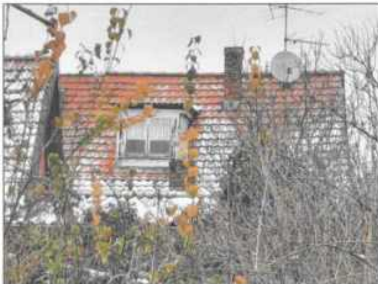
Abb. 14: Gebäuderückseite