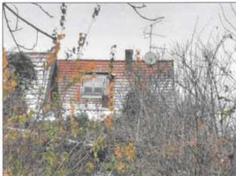
Abb. 12: Gebäuderückseite