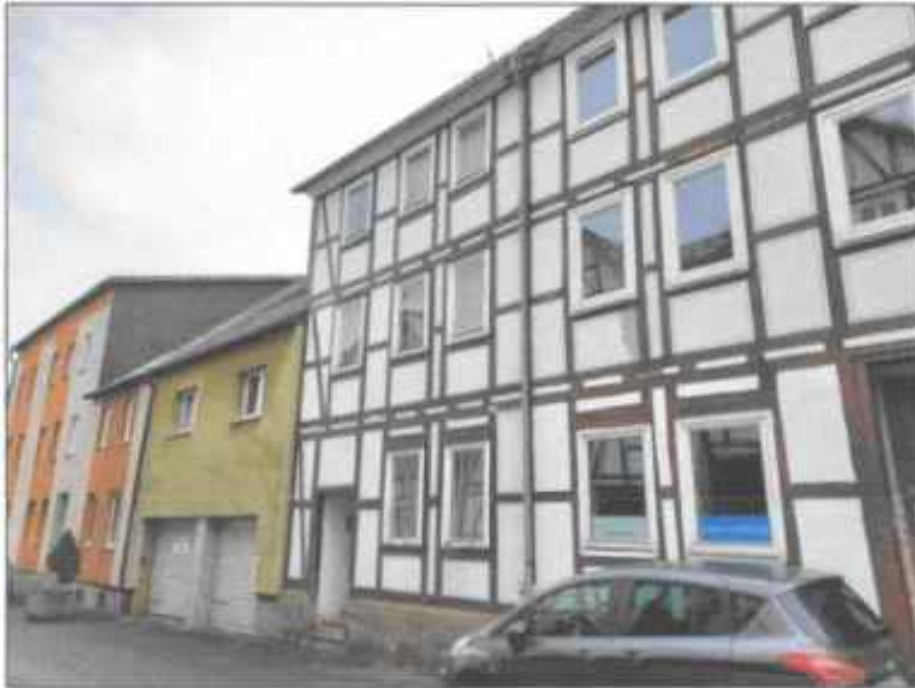
Abb. 1: Straßenansicht mit Umgebungsbebauung