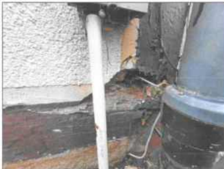
Abb. 18: Schadstellen, Holzfachwerkbalken