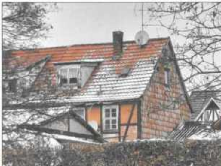
Abb. 15: Gebäuderückseite