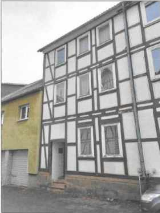
Abb. 3: Strassenansicht