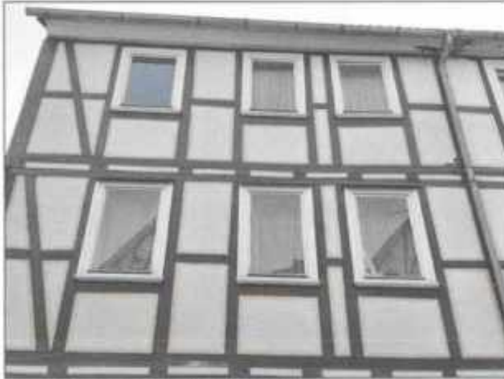
Abb. 7: Straßenseite, Obergeschoße