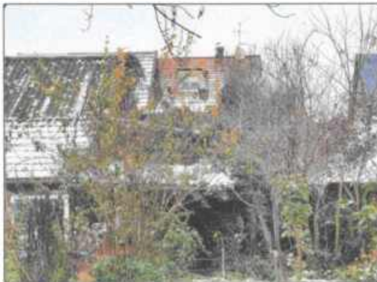
Abb. 11: Gebäuderückseite