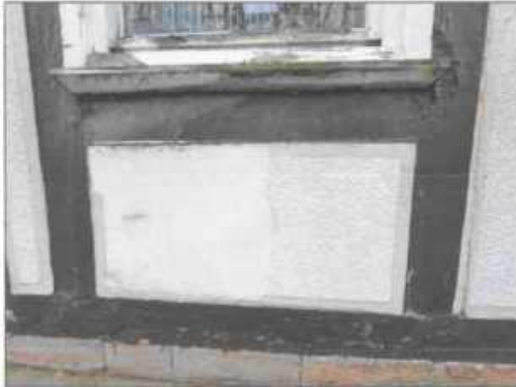
Abb. 16: Schadstellen Fassade, Putz, Holzbalken, Fensterrahmen