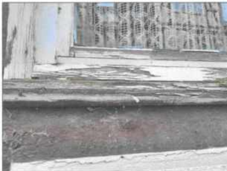
Abb. 17: Schadstellen, Fensterrahmen