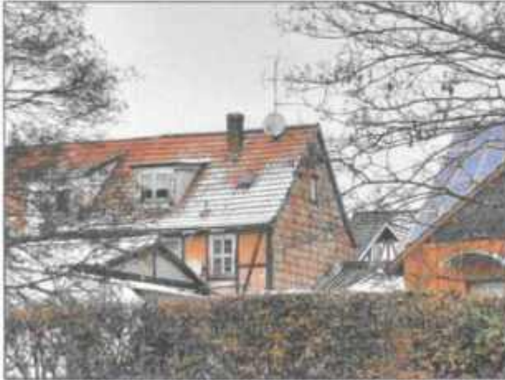
Abb. 13: Gebäuderückseite