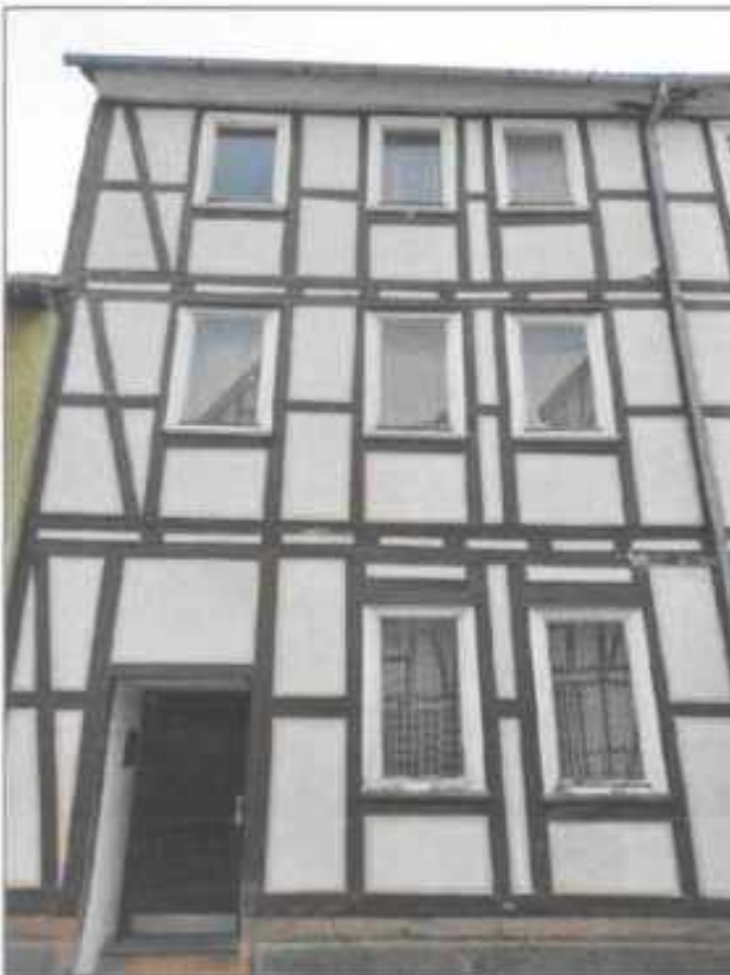
Abb. 2: Straßenansicht