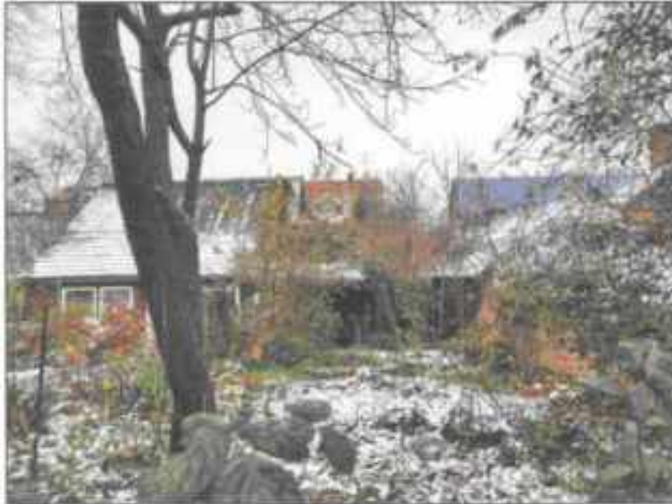
Abb. 10: Garten und Gebäuderückseite