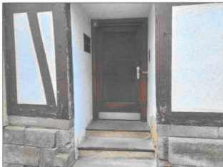
Abb. 9: Hauseingang