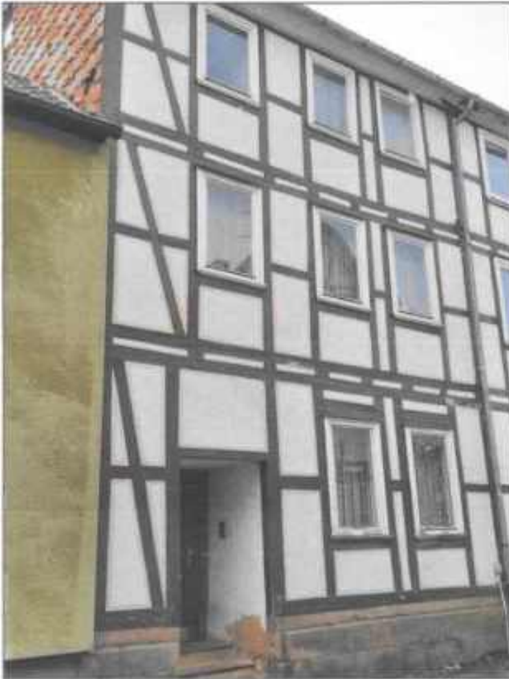
Abb. 5: Straßenansicht