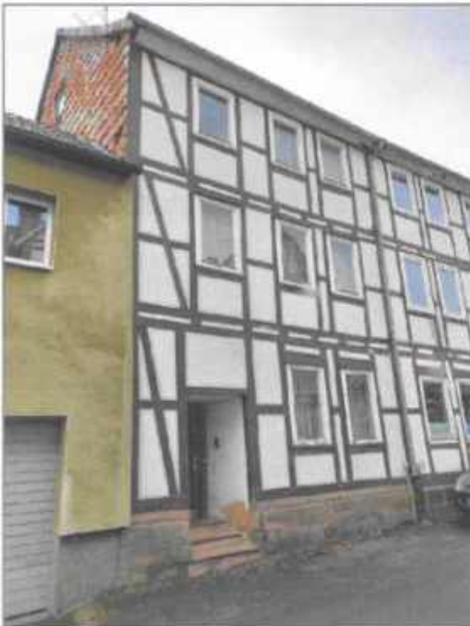
Abb. 4: Strassenansicht