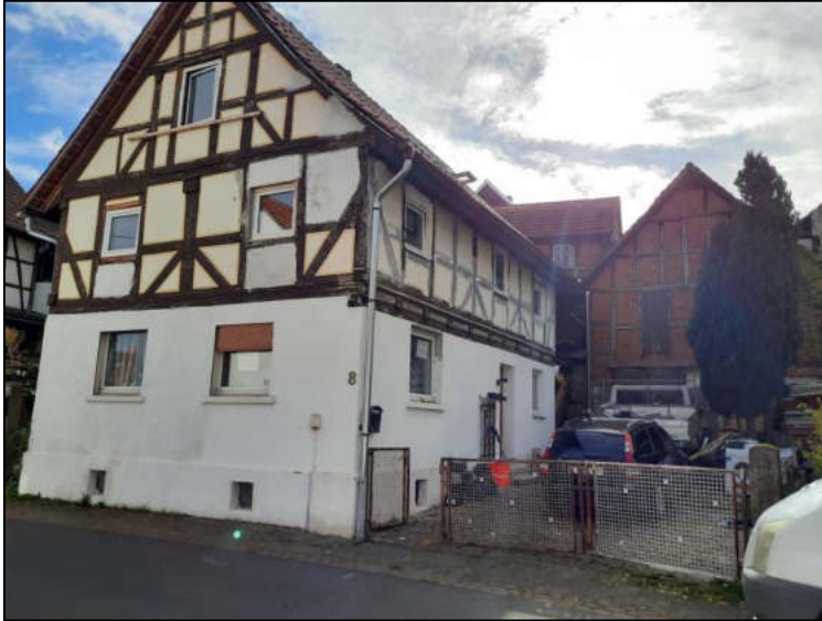
Abb. 7: Straßenansicht Giebelseite und Hof