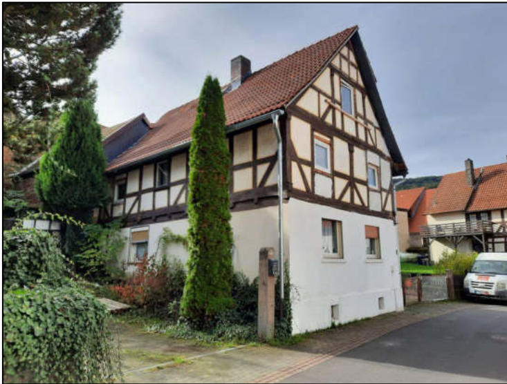
Abb. 1: Straßenansicht Ostseite und Giebelseite