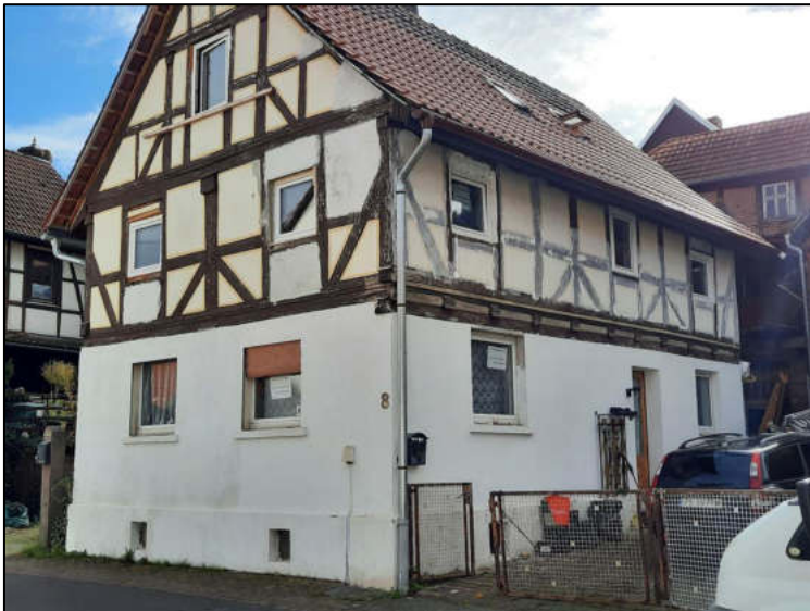
Abb. 8: Straßenansicht Giebelseite und Westseite