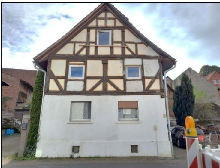
Abb. 3: Straßenansicht Giebelseite