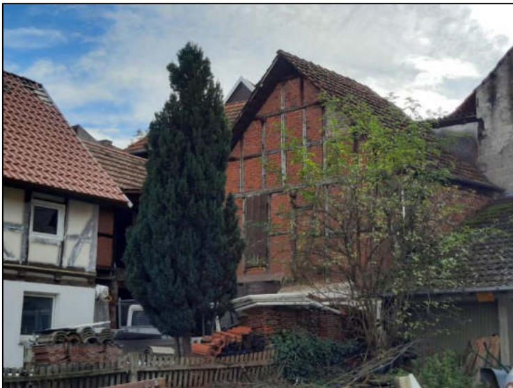
Abb. 11: Ansicht Westseite mit Scheune rechts