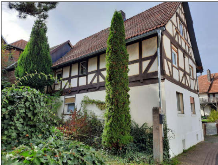
Abb. 2: Straßenansicht Ostseite und Giebelseite