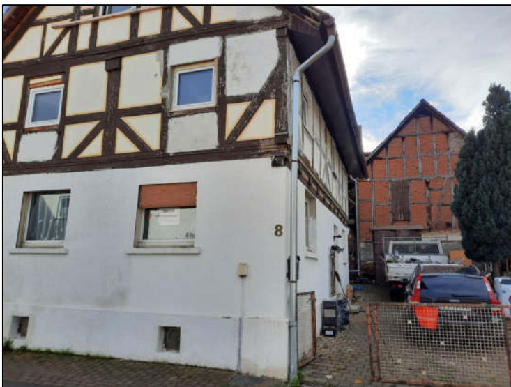
Abb. 5: Straßenansicht Giebelseite und Hof