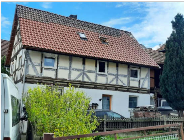
Abb. 12: Ansicht Westseite