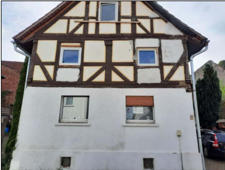
Abb. 4: Straßenansicht Giebelseite