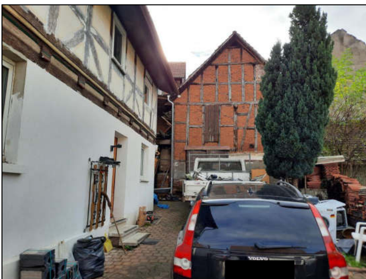
Abb. 6: Hof und Scheune im Hintergrund