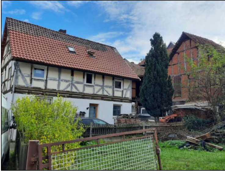
Abb. 10: Ansicht Westseite mit Scheune rechts