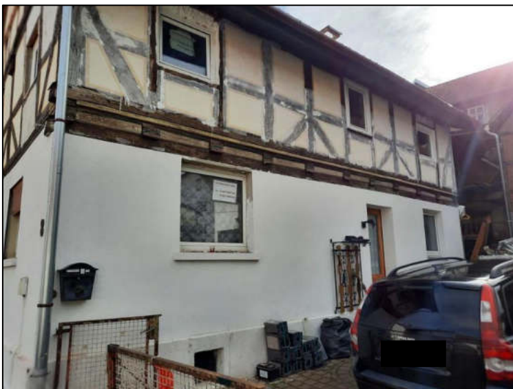
Abb. 9: Ansicht Westseite