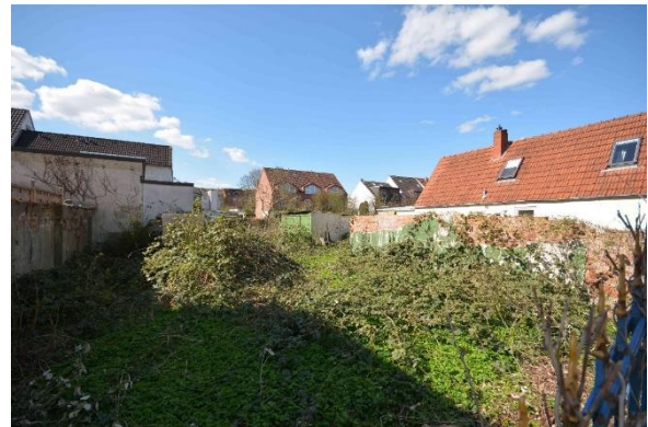
Blick auf das Bewertungsgrundstück; hinter dem ehemaligen Wohnhaus befindet sich ein massives Schuppengebäude

Der Verkehrswert des Grundstücks wurde zum Stichtag 05.04.2023 ermittelt mit