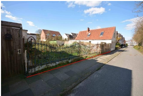
Straßenfront des Bewertungsgrundstücks mit Radfahrstraße vor dem öffentlichen Gehweg

für das unbebaute Grundstück in 28757 Bremen, Kirchheide 63