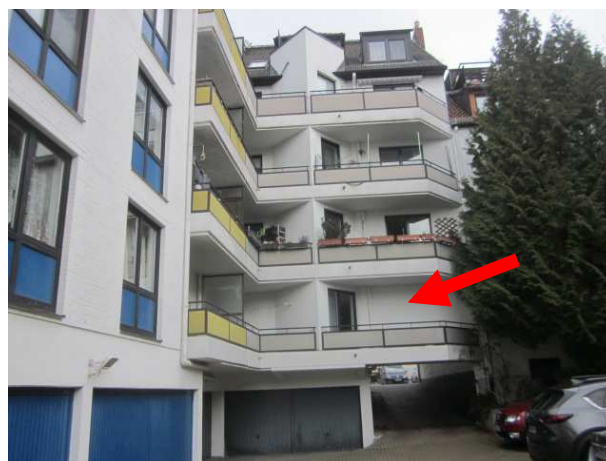
Hausansicht von der Hofseite

Objektbeschreibung: 3-Zi.-ETW (Nr. 6, 1. Obergeschoss links) in einer viergeschossigen massiven Eigentumswohnanlage mit ausgebautem Dachgeschoss. Die Außenwände sind verputzt und hell gestrichen. Das Satteldach ist mit dunklen Frankfurter Pfannen eingedeckt. Im Hause befinden sich 14 Eigentumswohnungen und 3 Garagen.