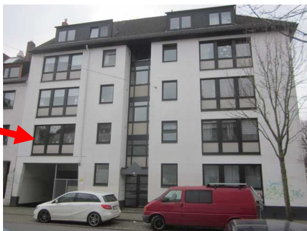
Hausansicht „Lahnstraße 1 A“

Kurzexposé zum Objekt: 3-Zimmer-Eigentumswohnung in 28199 Bremen-Neustadt, Lahnstraße 1 A