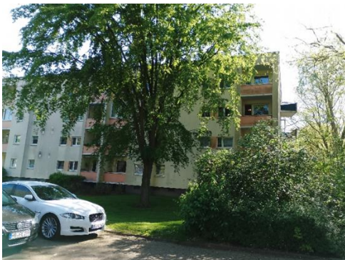
Die Rückseite des Gebäudes

Lage der Wohnung: 2. Obergeschoss links Türen: Glatte Holztüren, Küche: Glas-Schiebetür, Wohnen: ohne. Böden: Flur, Bad, Küche, Wohnen: Fliesen, Kind, Eltern: Textilbelag. Wände: Tapeziert, Bad: Fliesensockel. Decken: Überwiegend tapeziert Fenster: Kunststofffenster mit Isolierverglasung Heizkörper: Flach- und Rippenheizkörper, im Bad als Handtuchhalter Sanitäre Einrichtung: Dusche, Wand-WC, Handwaschbecken, elektrische Entlüftung.