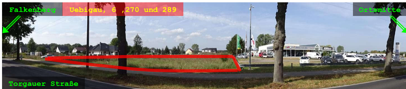
Beispiel für die Nutzung; hier Gesamtsituation in der Torgauer Straße, im Bereich Flur 6, Flurstücke 270 und 289