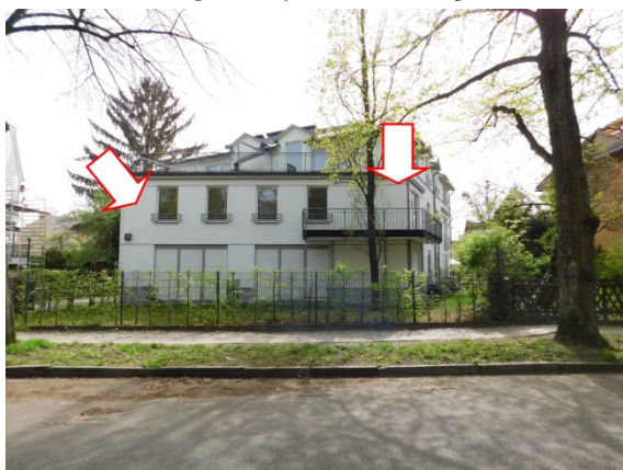
Ansicht straßenseitig/ Stellplatz hofseitig