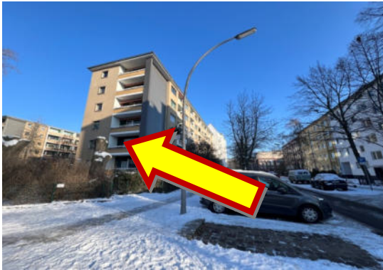
Ansichten Gebäude seitlich und vorne: