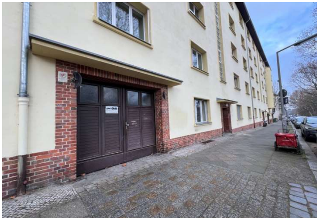
Ansichten Gebäude und Einfahrt: