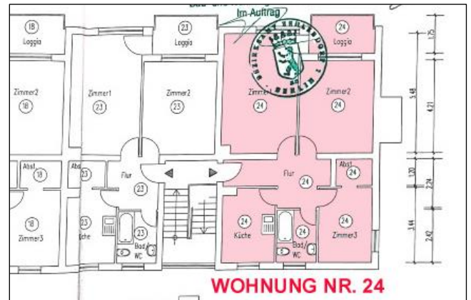
Grundriss 2. Obergeschoss