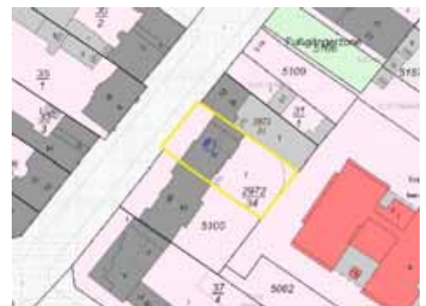
Ausschnitt Katasterkarte, Kennzeichnung Bewertungsgrundstück gelb