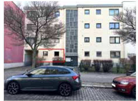
Vorderansicht, Kennzeichnung WE Nr. 3

319.000,00 € (zum Wertermittlungstichtag)