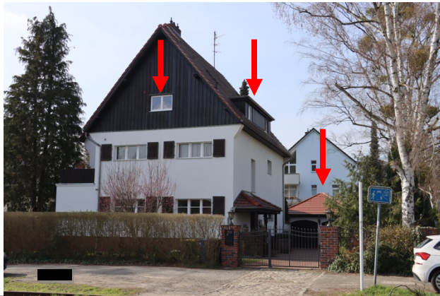
Eingang zum Gebäude Straßenansicht