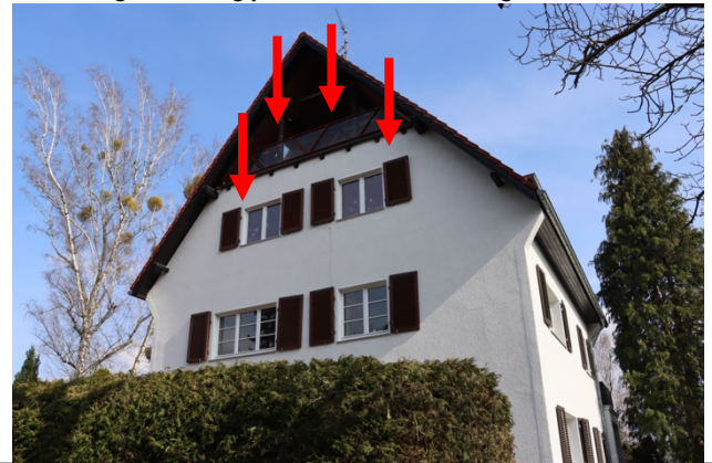
Rückansicht des Gebäudes Bewertungswohnung jeweils markiert, Garage markiert