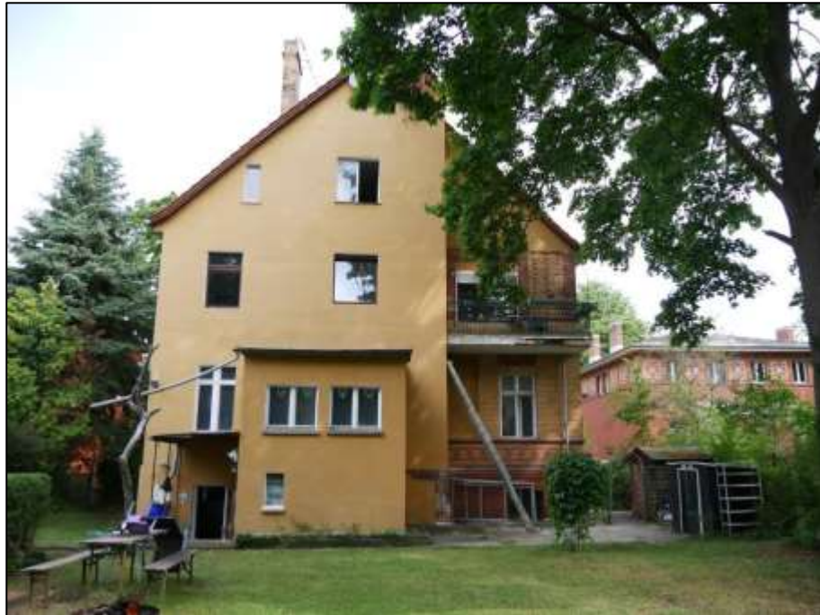
gartenseitige Giebelseite des straßenseitig auf dem Grundstück aufstehendes Mehrfamilien-Wohnhauses mit rückwärtig zusätzlichem Eingang in das Untergeschoss links im Bild