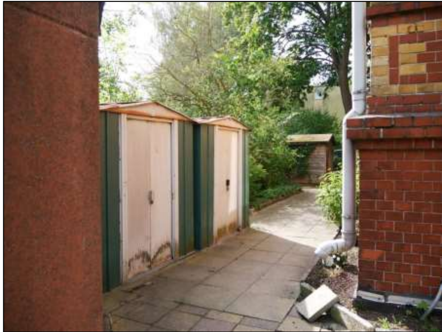
linker Bauwich des auf dem Grundstück Jägerstr. 8 aufstehenden Mehrfamilien-Wohnhauses mit hinter der Grenzgarage belegenen Stahlblechschuppen als Kellerersatzräume der im Gebäude belegenen Wohnungen und entsprechendem Holzschuppen im Hintergrund