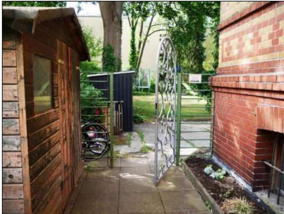
Sperrpforte im linken Bauwich des Mehrfamilien-Wohnhauses zu dem dahinter belegenen Garten des Anwesens mit Zuwegung u.a. zu dem auf dem Grundstück außerdem belegenen Einfamilienhaus