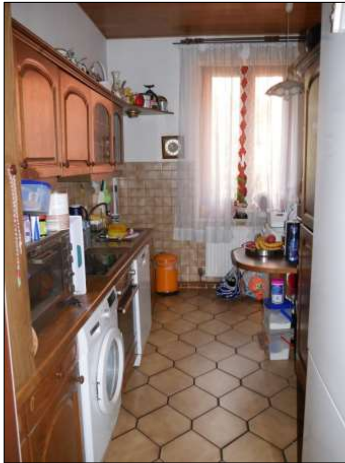
Küche einer Wohnung in dem auf dem Grundstück aufstehenden Mehrfamilien-Wohnhaus