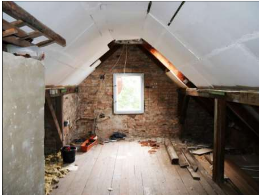
Spitzboden des auf dem Grundstück aufstehenden Mehrfamilien-Wohnhauses mit stehenden Fenstern in den Giebelseiten