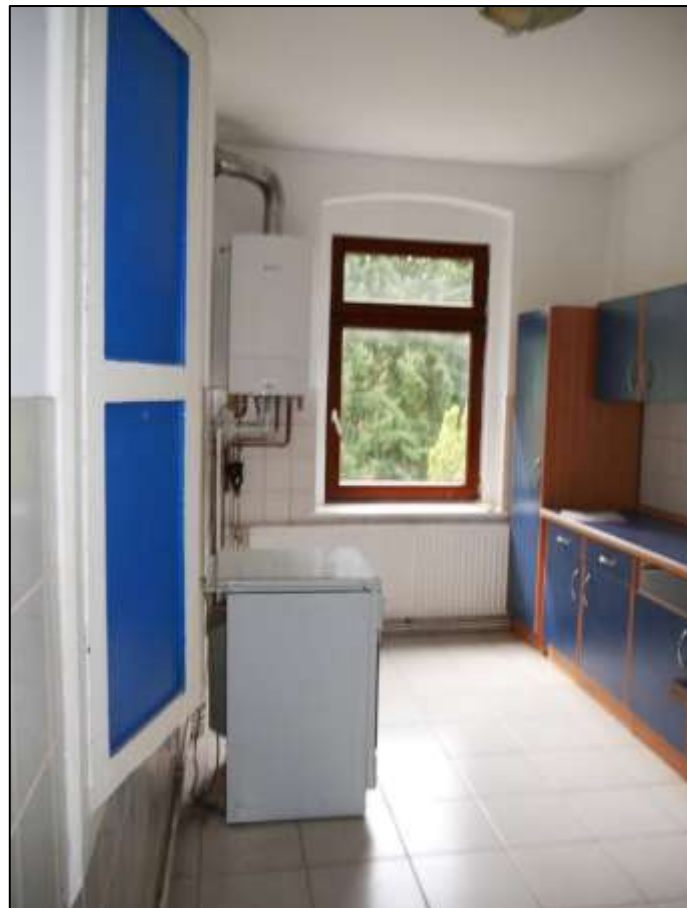
Küche der leer- stehenden Wohnung in dem auf dem Grundstück aufstehenden Mehrfamilien- Wohnhaus