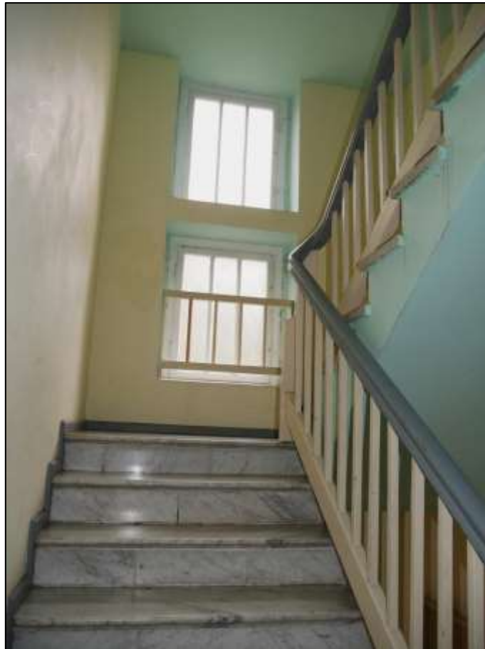
Treppenaufgang mit Zwischengeschosspodest des auf dem Grundstück aufstehenden Mehrfamilien-Wohnhauses