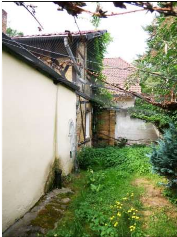
zum rechten Bauwich orientierte rückwärtige Front des 1-geschossigen Wohnzimmer-Anbaus an das im Hintergrund anbindende sogen. Einfamilienhaus (ehemals: Stall-/Remise etc.) und massive Grenzscheideung zum Nachbargrundstück