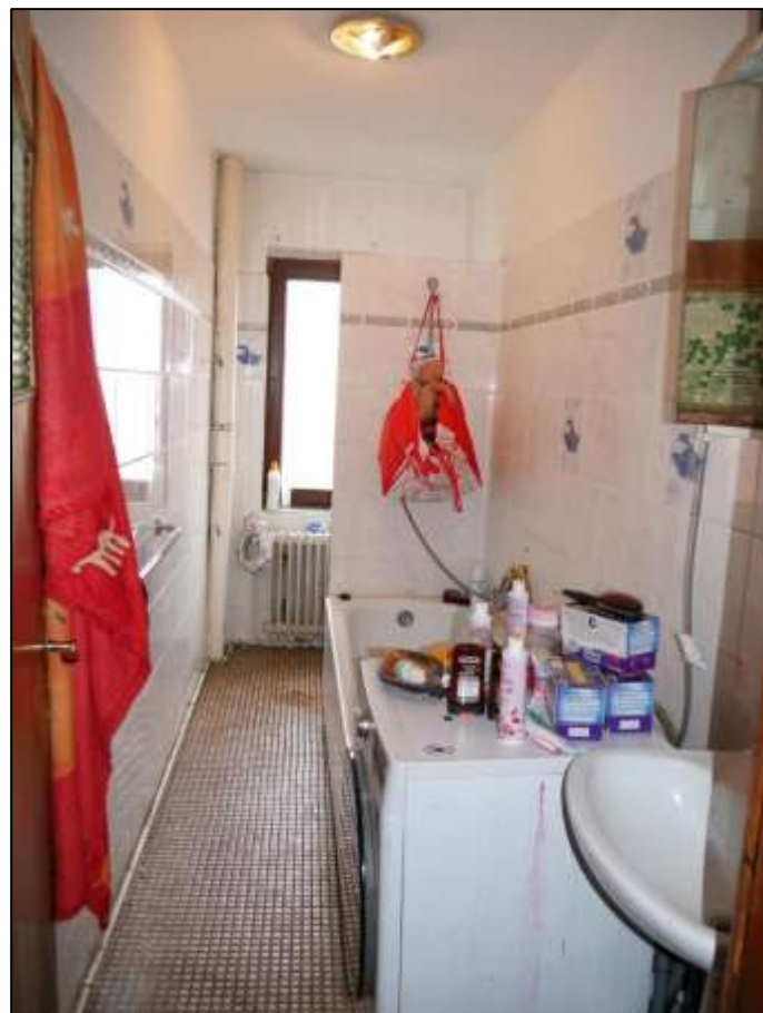
Badezimmer einer Wohnung in dem auf dem Grundstück aufstehenden Mehrfamilien-Wohnhaus