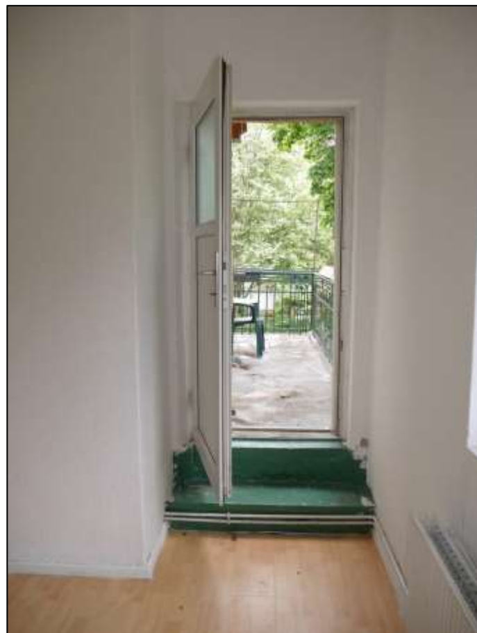
Fenstertür zum Balkon im Schlafzimmer der leerstehen- den Wohnung in dem auf dem Grundstück aufstehenden Mehrfamilien- Wohnhaus