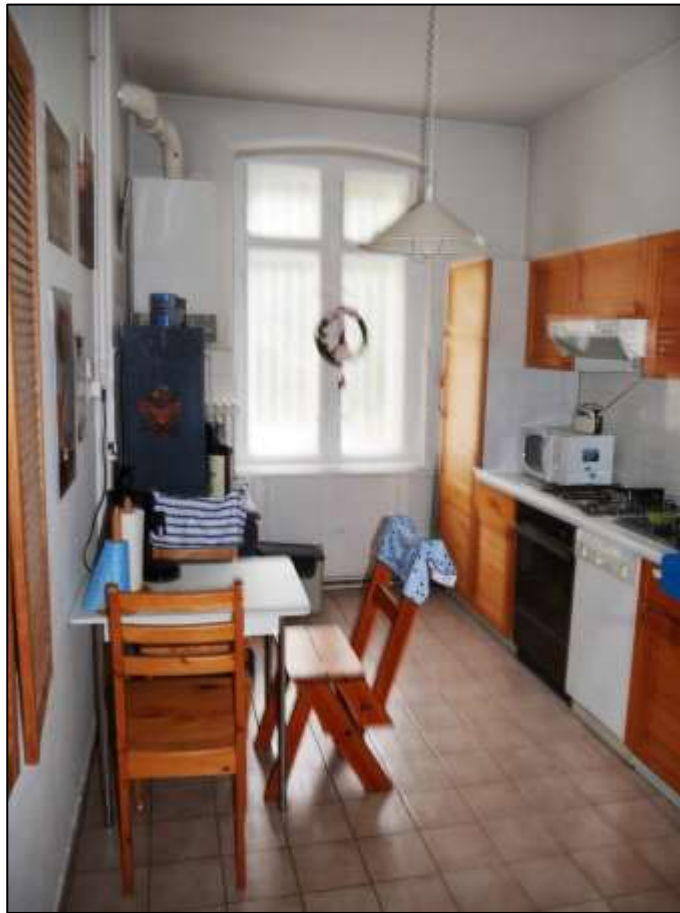
Küche einer Wohnung in dem auf dem Grundstück aufstehenden Mehrfamilien-Wohnhaus