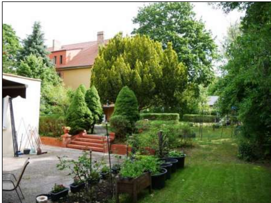
Blick nach Nord-Osten über die in das Gelände eingesenkte Terrasse des sogen. Einfamilienhauses hinweg auf das straßenseitig auf dem Grundstück aufstehende Mehrfamilien-Wohnhaus im Hintergrund links