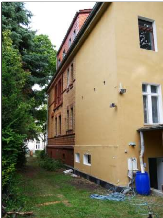
zum rechten Bauwich orientierte Gebäudefront des straßenseitig auf dem Grundstück aufstehenden Mehrfamilien-Wohnhauses