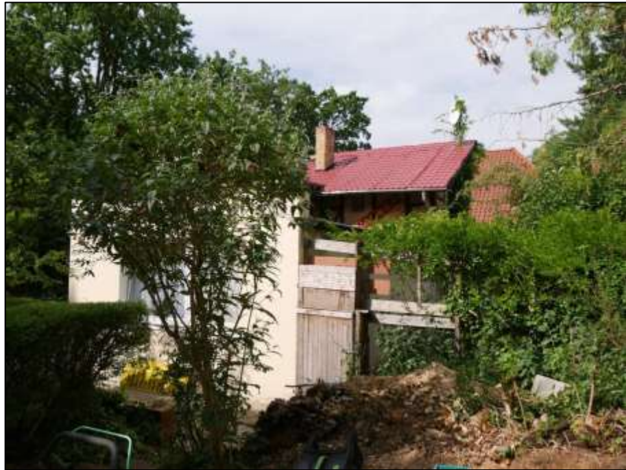
Blick nach Süd-Westen auf den 1-geschossigen Wohnzimmer-Anbau an das sogen. Einfamilienhaus im Hintergrund (ehemals: Stall-/Remise etc.)