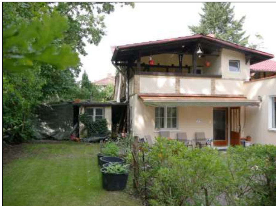
vor der süd-westlichen Grundstücksgrenze als Grenzbebauung belegenes Einfamilienhaus mit Gebäudestamm als ehemaliges Stall-/Remisengebäude - Blick nach Westen (links im Bild einfachster Schuppen-Anbau und rechts im Bild 1-geschossiger Wohnzimmer-Anbau)