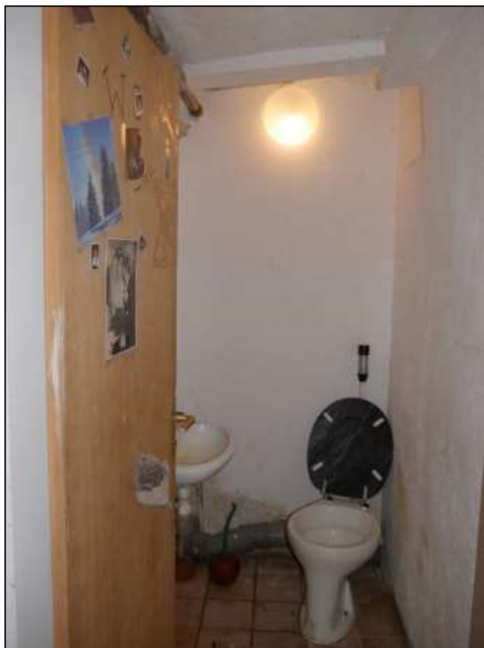
Toilettenraum im Kellerbereich des auf dem Grundstück aufstehenden Mehrfamilien-Wohnhauses aufgrund einer vormals teilgewerblichen Nutzung des Kellergeschosses und späterer temporärer Vermietung zu Wohnzwecken