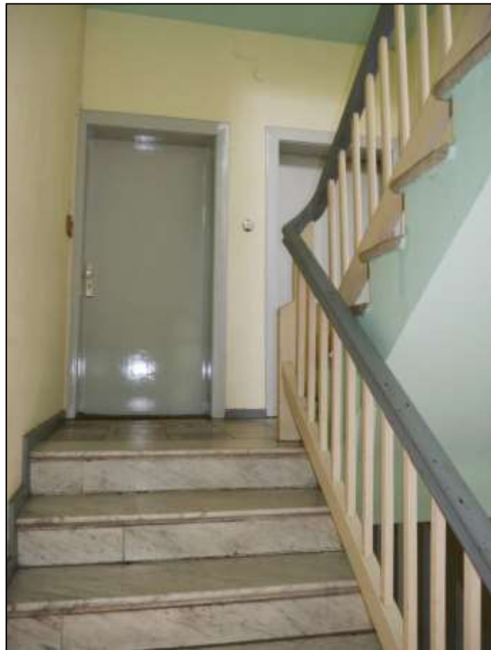
Treppenaufgang zum Hochparterre des auf dem Grundstück aufstehenden Mehrfamilien-Wohnhauses