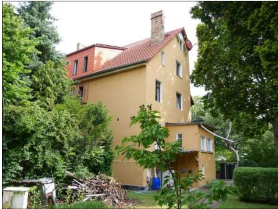
gartenseitige Giebelseite des straßenseitig auf dem Grundstück aufstehendes Mehrfamilien-Wohnhauses mit zum rechten Bauwich orientierter Gebäudefront