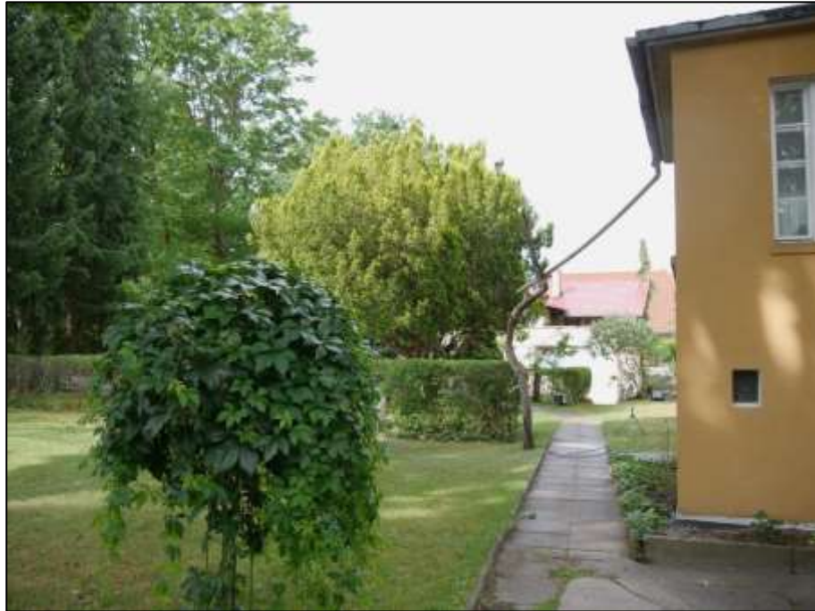
Zuwegung u.a. zu dem auf dem Grundstück außerdem belegenen Einfamilienhaus im Hintergrund - im Vordergrund rechts: straßenseitig auf dem Grundstück aufstehendes Mehrfamilien-Wohnhaus