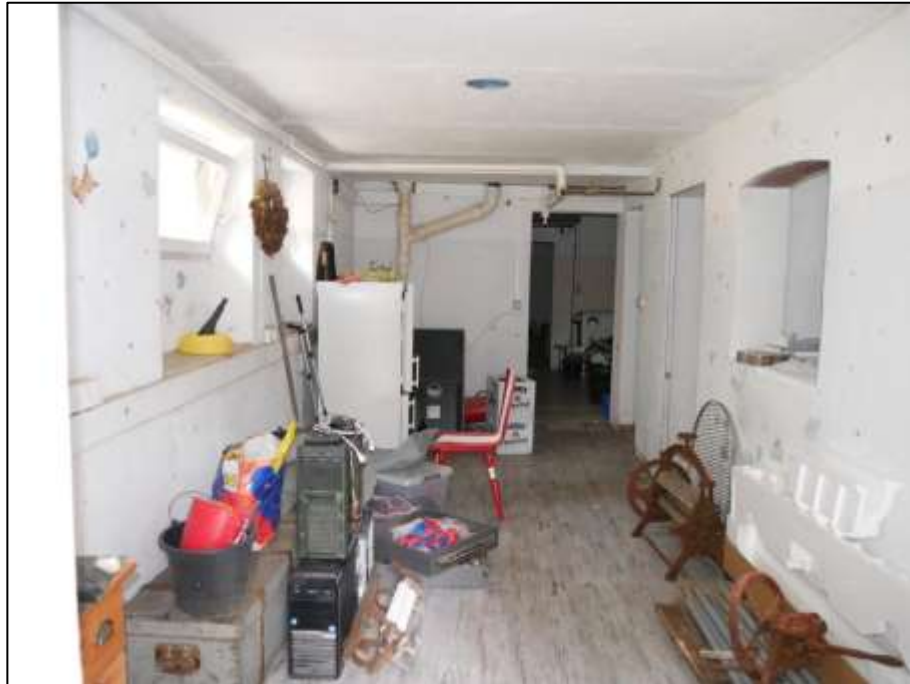
Kellerraum mit Zugang u.a. unmittelbar aus dem Freien über die gartenseitige Giebelseite des auf dem Grundstück aufstehenden Mehrfamilien-Wohnhauses