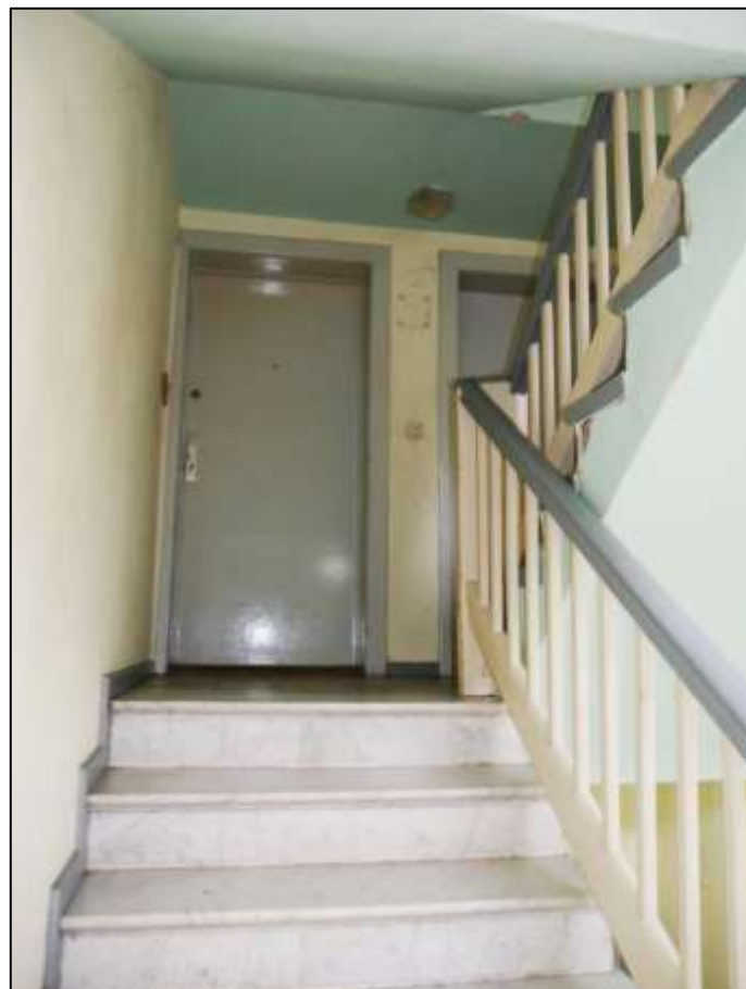
Treppenaufgang mit Vollgeschosspodest im Dachgeschoss des auf dem Grundstück aufstehenden Mehrfamilien-Wohnhauses