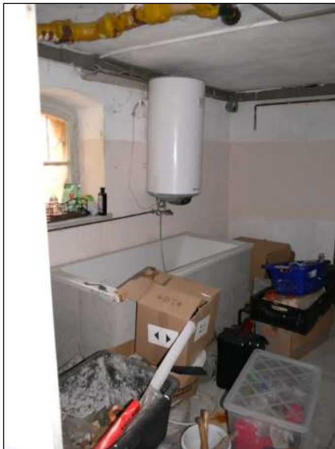
Badezimmer im Kellerbereich des auf dem Grundstück aufstehenden Mehrfamilien-Wohnhauses aufgrund einer vormals teilgewerblichen Nutzung des Kellergeschosses und späterer temporärer Vermietung zu Wohnzwecken