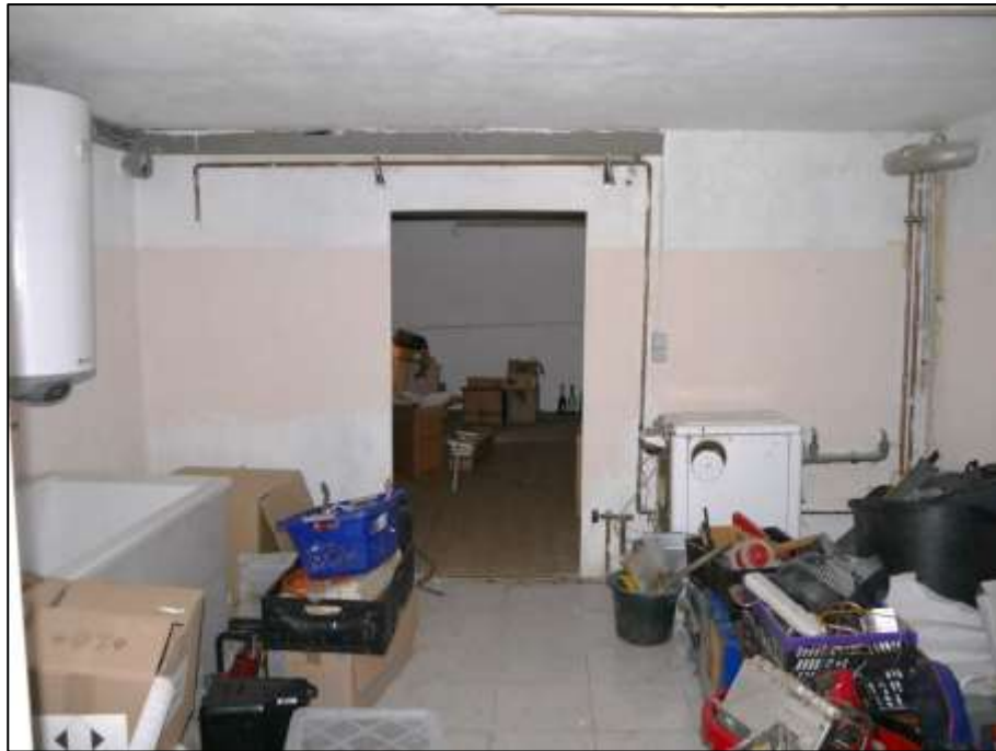
Badezimmer im Kellerbereich des auf dem Grundstück aufstehenden Mehrfamilien-Wohnhauses aufgrund einer vormals teilgewerblichen Nutzung des Kellergeschosses und späterer temporärer Vermietung zu Wohnzwecken als Durchgangsraum zu einem rückwärtigen Lager-raum