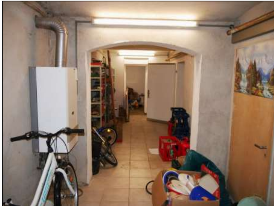
Kellerbereich des auf dem Grundstück aufstehenden Mehrfamilien-Wohnhauses mit Heiztherme der Etagenheizung einer im Hochparterre belegenen Wohnung