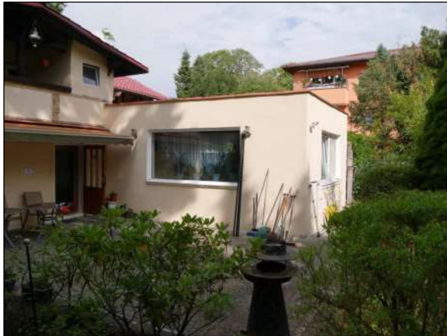
Blick nach Nord-Westen mit 1-geschossigem Wohnzimmer-Anbau an das sogen. Einfamilienhaus (ehemals: Stall-/Remise etc.)