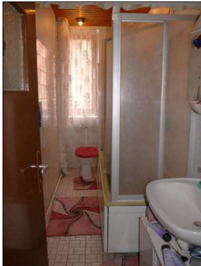
Badezimmer einer Wohnung in dem auf dem Grundstück aufstehenden Mehrfamilien-Wohnhaus