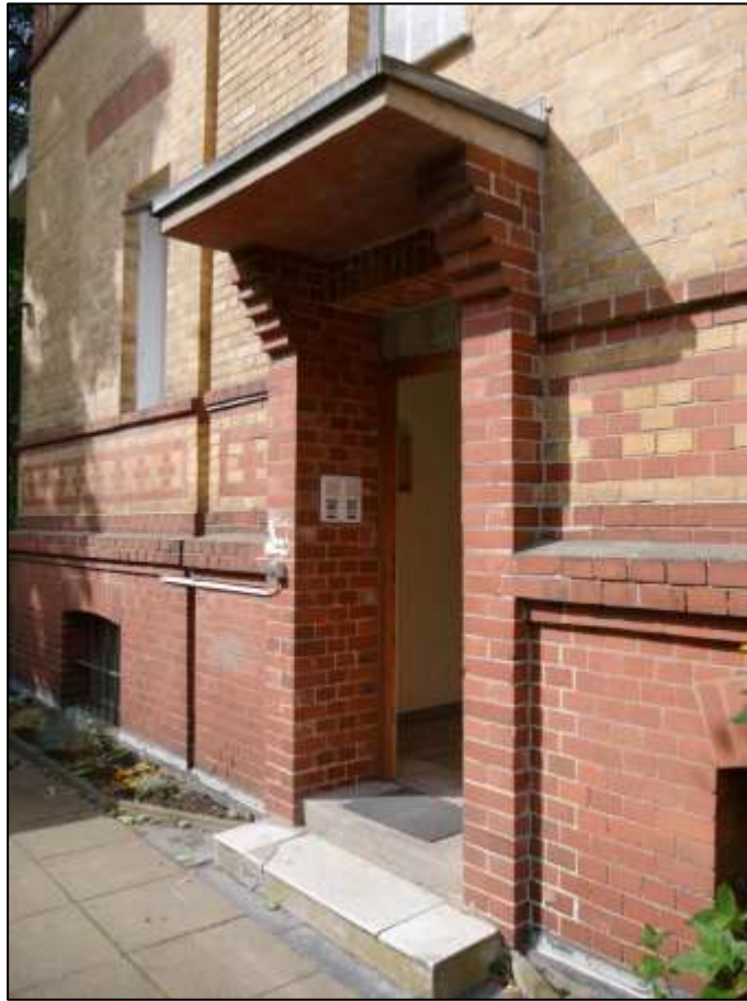
zum linken Bau- wich orientierte Hauseingangs- tür des auf dem Grundstück Jä- gerstr. 8 aufste- henden Mehr- familien-Wohn- hauses