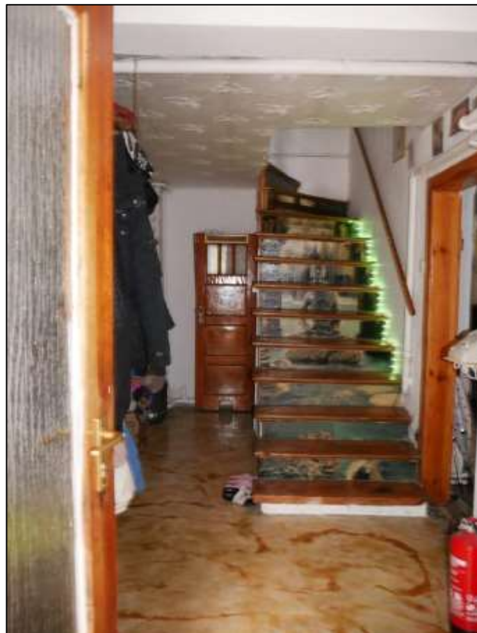
Blick durch die Hauseingangstür des sogen. „Einfamilienhauses“ auf dem Grundstück mit Blick in die Diele mit aufgehender Treppe in das Dachgeschoss