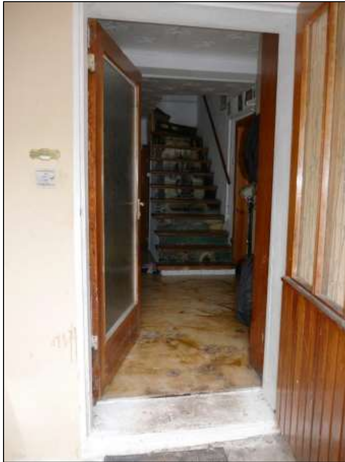
Hauseingangstür des sogen. „Einfamilienhauses“ auf dem Grundstück mit Blick in die Diele mit aufgehender Treppe in das Dachgeschoss