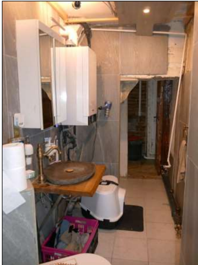
Badezimmer im Erdgeschoss des sogen. „Ein- familienhauses“