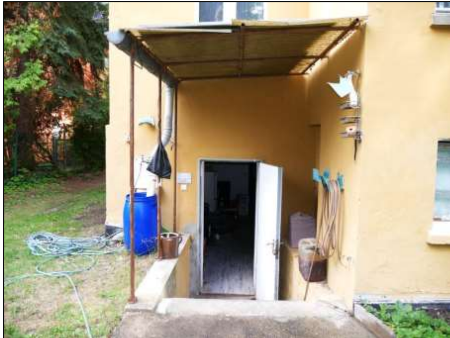
zusätzlicher Eingang in das Untergeschoss in der rückwärtigen Giebelseite des Mehrfamilien-Wohnhauses