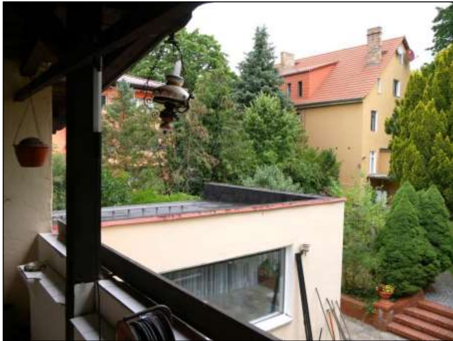
Blick von der Loggia im Dachgeschoss des sogen. „Einfamilienhauses“ auf den 1-geschossigen Wohnzimmer-Anbau und das auf dem Grundstück belegene Mehrfamilien-Wohnhaus im Hintergrund