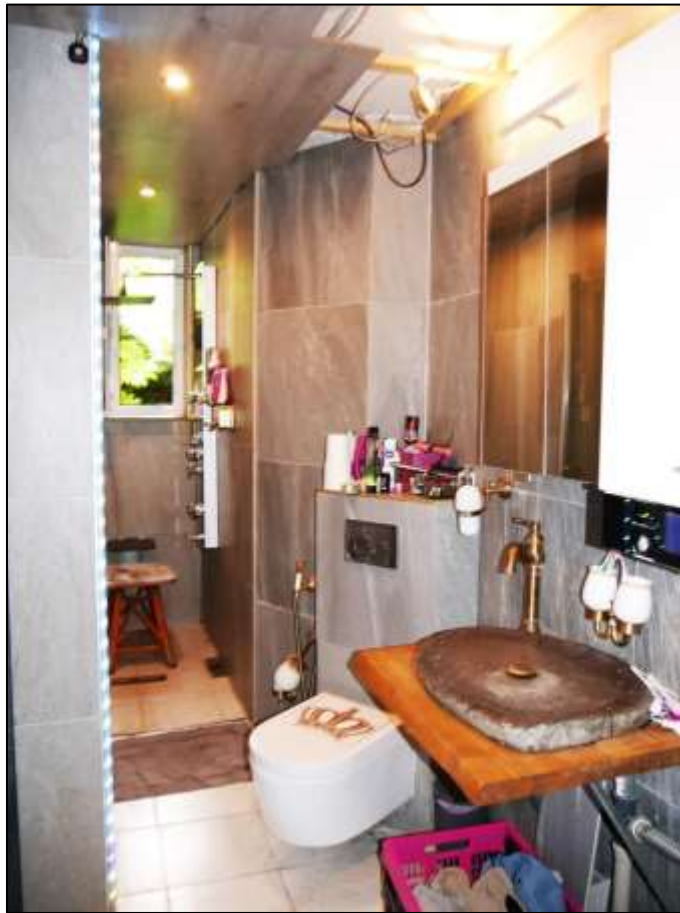
Badezimmer im Erdgeschoss des sogen. „Ein- familienhauses“