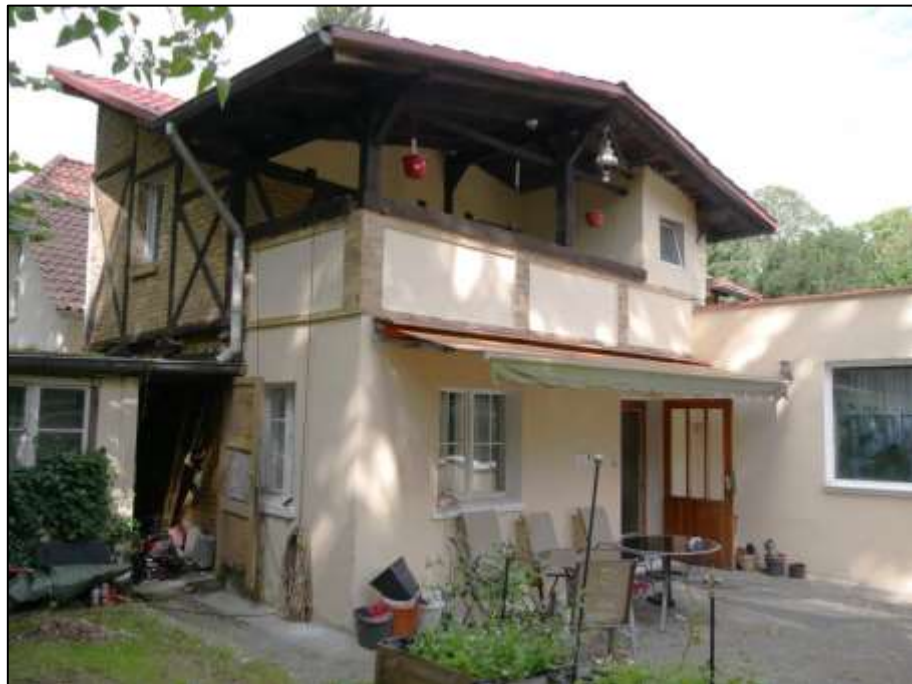
vor der süd-westlichen Grundstücksgrenze als Grenzbebauung belegenes Einfamilienhaus mit Gebäude Stamm als ehemaliges Stall-/Remisengebäude - Blick nach Nord-Westen (links im Bild einfachster Schuppen-Anbau und rechts im Bild 1-geschossiger Wohnzimmer-Anbau)