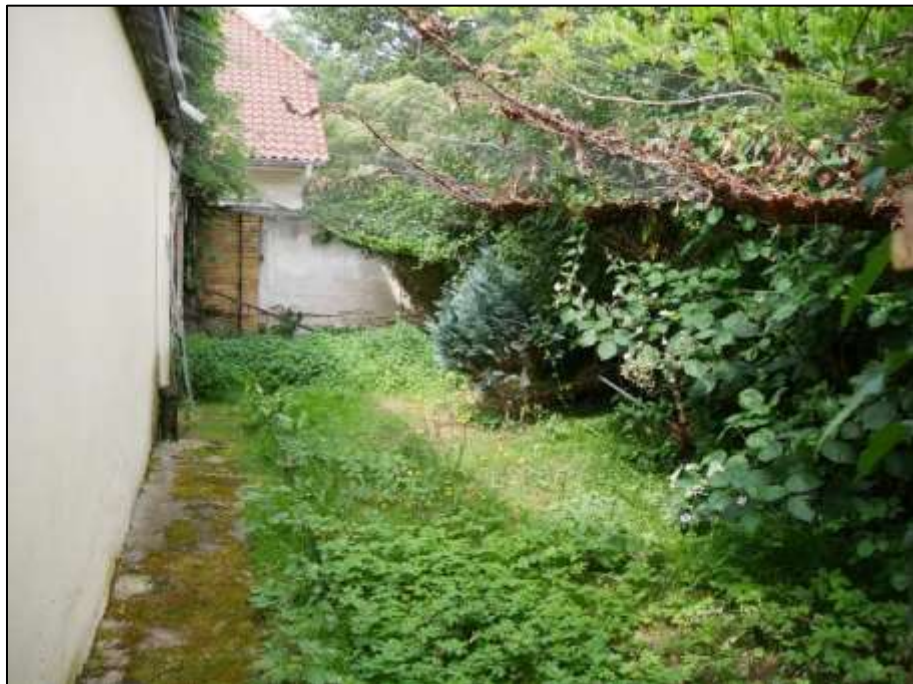
hinter dem 1-geschossigen Wohnzimmer-Anbau an das sogen. Einfamilienhaus (ehemals: Stall-/Remise etc.) belegene Grundstücksfreifläche im rechten Bauwich des Einfamilienhauses