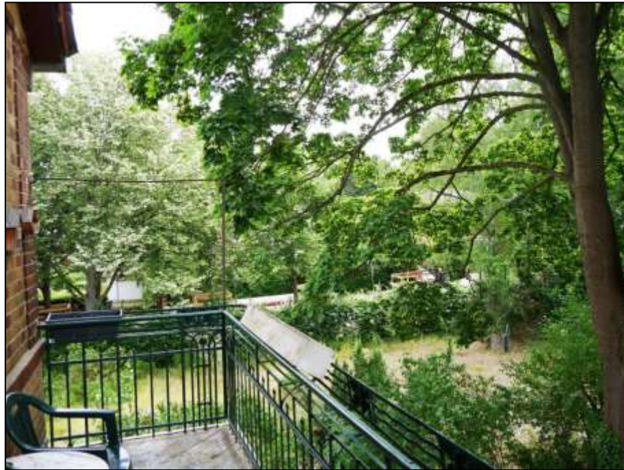
Blick von dem Balkon der leerstehenden Wohnung in dem auf dem Grundstück aufstehenden Mehrfamilien-Wohnhaus nach Süd-Osten