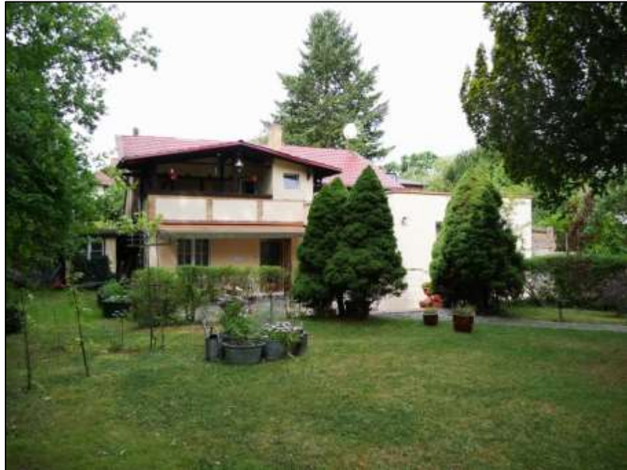
vor der süd-westlichen Grundstücksgrenze als Grenzbebauung belegenes Einfamilienhaus mit Gebäudestamm als ehemaliges Stall-/Remisengebäude - Blick nach Westen