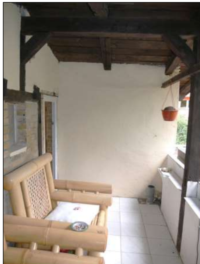
Loggia im Dachgeschoss des sogen. „Einfamilien- hauses“