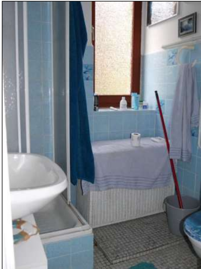
Badezimmer einer Wohnung in dem auf dem Grundstück aufstehenden Mehrfamilien- Wohnhaus