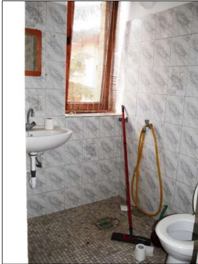
Badezimmer der leerstehen- den Wohnung in dem auf dem Grundstück aufstehenden Mehrfamilien- Wohnhaus