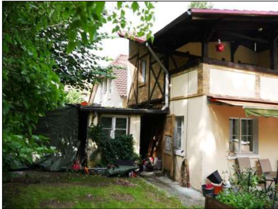
vor der süd-westlichen Grundstücksgrenze als Grenzbebauung belegenes Einfamilienhaus mit Gebäude Stamm als ehemaliges Stall-/Remisengebäude - vor der süd-östlichen Giebelseite belegener einfachster Schuppen-Anbau