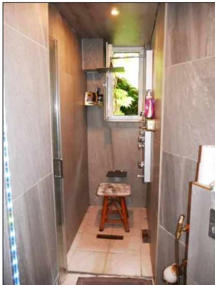
Badezimmer im Erdgeschoss des sogen. „Einfamilien- hauses“