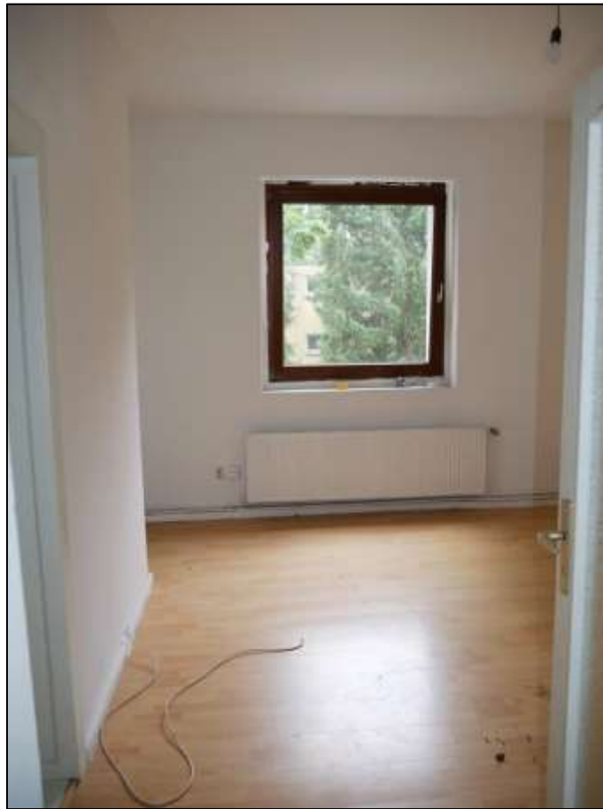
Schlafzimmer der leerstehen- den Wohnung in dem auf dem Grundstück aufstehenden Mehrfamilien- Wohnhaus