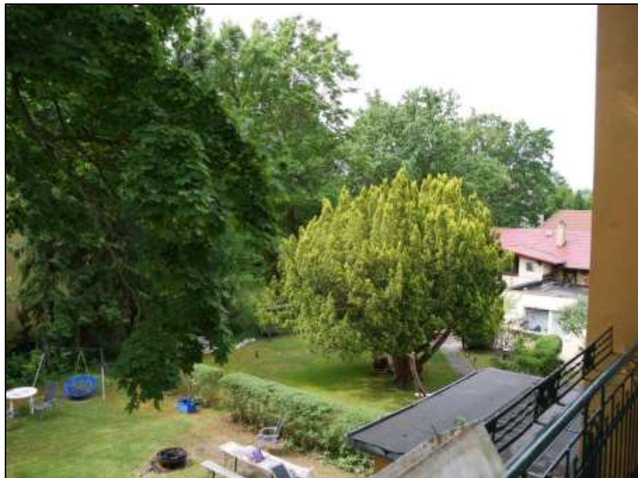
Blick von dem Balkon der leerstehenden Wohnung in dem auf dem Grundstück aufstehenden Mehrfamilien-Wohnhaus nach Süd-Westen u.a. mit auf dem Grundstück gleichfalls aufstehendem Einfamilienhaus als Grenzbebauung auf der süd-westlichen Grundstücksgrenze