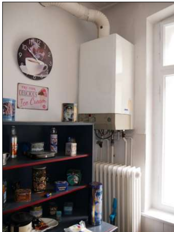
Gas-Kombi-therme einer Gas-Etagenheizung in der Küche einer Wohnung in dem auf dem Grundstück aufstehenden Mehrfamilien-Wohnhaus