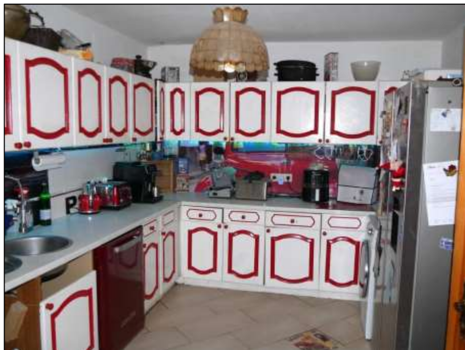
Küche im Erdgeschoss des sogen. „Einfamilienhauses“