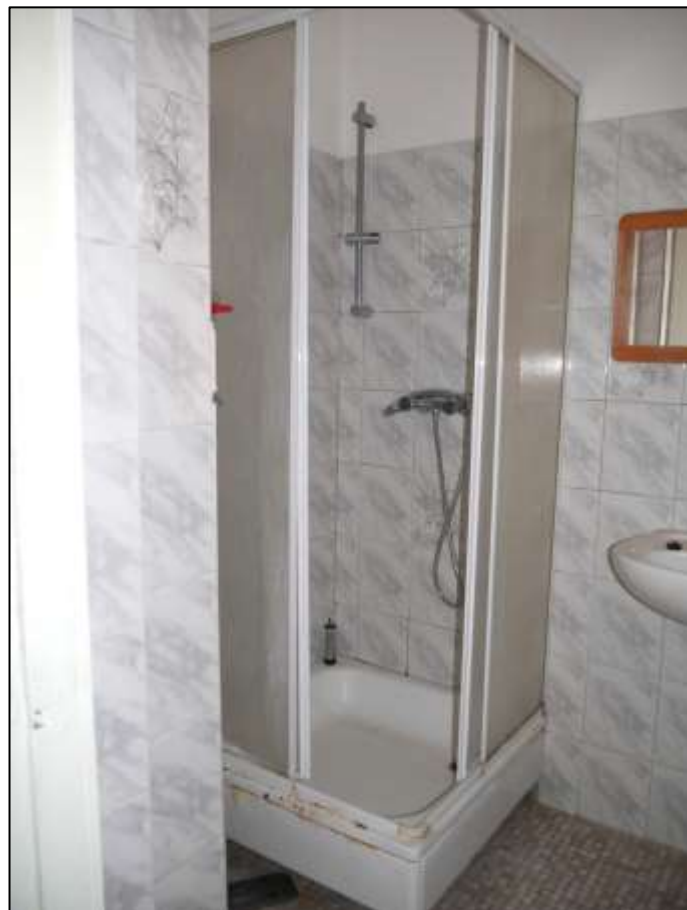
Badezimmer der leerstehenden Wohnung in dem auf dem Grundstück aufstehenden Mehrfamilien-Wohnhaus