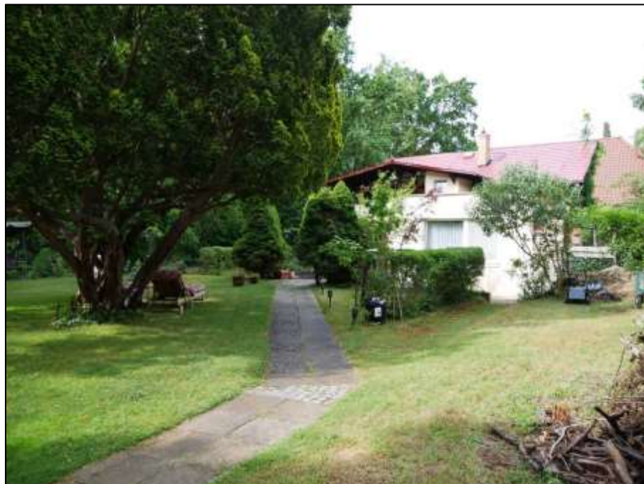
Blick aus dem Bereich des rechten Bauwuchs des auf dem Grundstück aufstehenden Mehrfamilien-Wohnhauses auf das vor der süd-westlichen Grundstücksgrenze als Grenzbebauung belegene Einfamilienhaus mit Gebäudestamm als ehemaliges Stall-/Remisengebäude