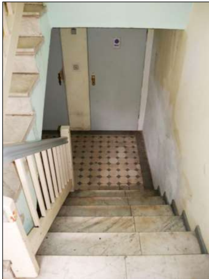
Kellertreppen- abgang im Treppenhaus des auf dem Grundstück aufstehenden Mehrfamilien- Wohnhauses