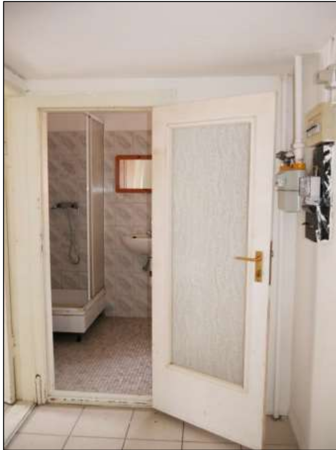
Blick aus der Diele in das Badezimmer der leerstehenden Wohnung in dem auf dem Grundstück aufstehenden Mehrfamilien-Wohnhaus