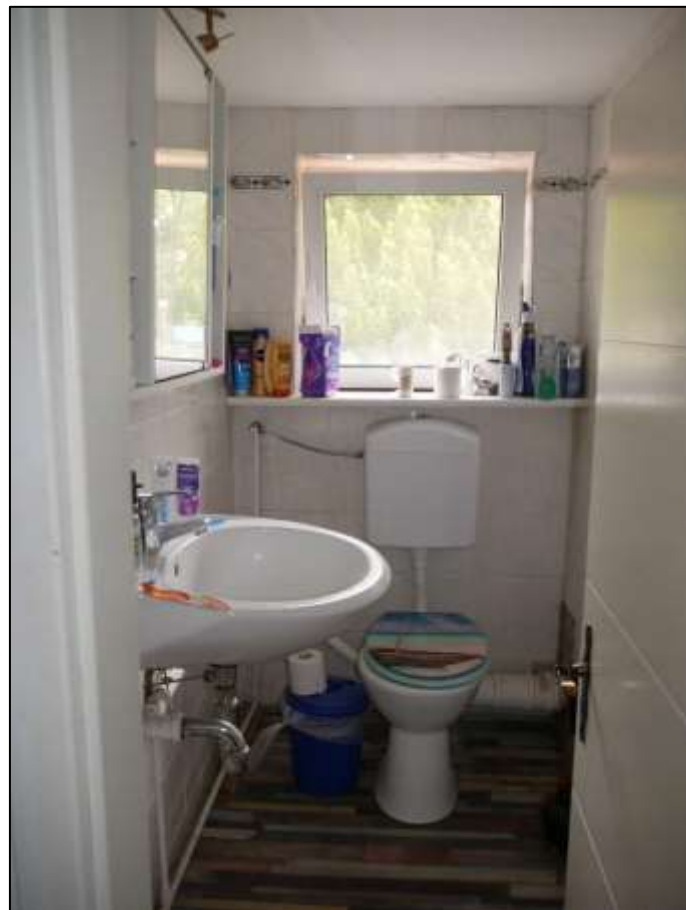
Toilettenraum im Dachge- schoss des sogen. „Einfam- ilienhauses“