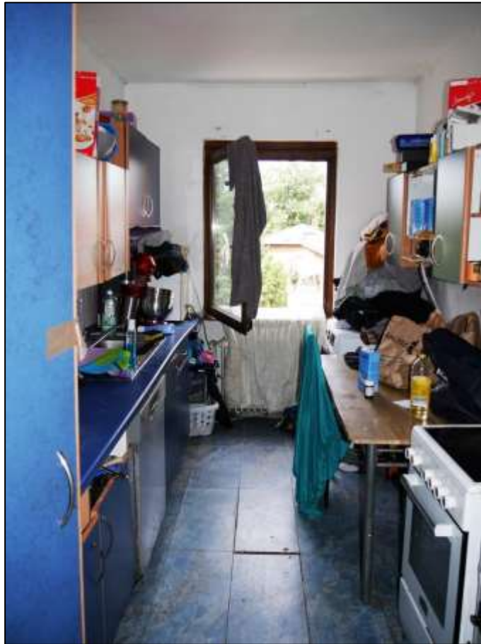
Küche einer Wohnung in dem auf dem Grundstück aufstehenden Mehrfamilien-Wohnhaus