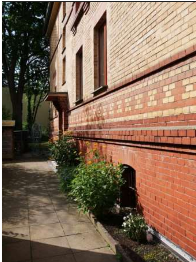
zum linken Bauwich orientierte Hauseingangsfront des auf dem Grundstück Jägerstr. 8 aufstehenden Mehrfamilien-Wohnhauses