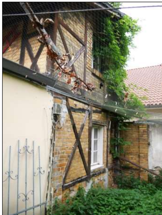
rückwärtige Front des 1-geschossigen Wohnzimmer-Anbaus im Vordergrund und daran anbindendes sogen. Einfamilienhaus (ehemals: Stall-/Remise etc.) - rechts im Bild angrenzende massive Grenzscheideung zum Nachbargrundstück