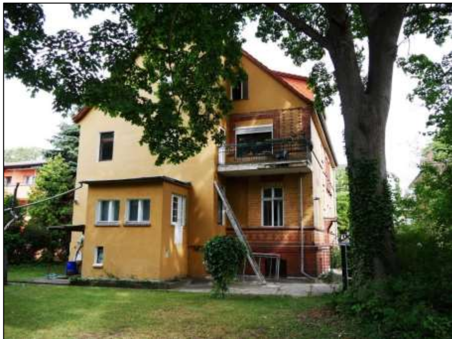
gartenseitige Giebelseite des straßenseitig auf dem Grundstück aufstehendes Mehrfamilien-Wohnhauses mit Hauseingangsfront rechts im Bild