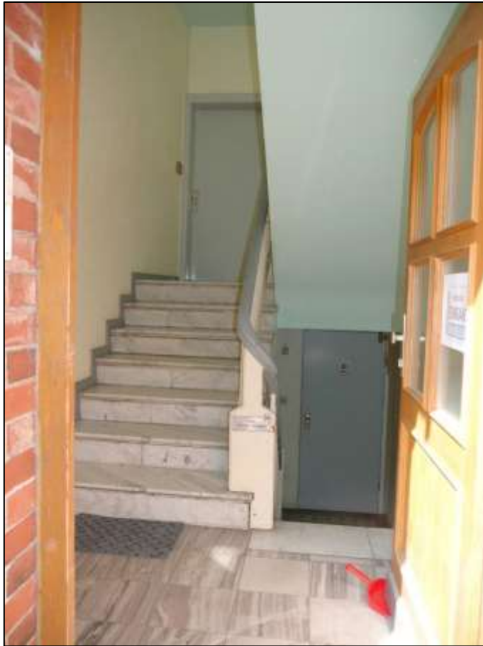
Hauseingangsbereich des auf dem Grundstück aufstehenden Mehrfamilien-Wohnhauses