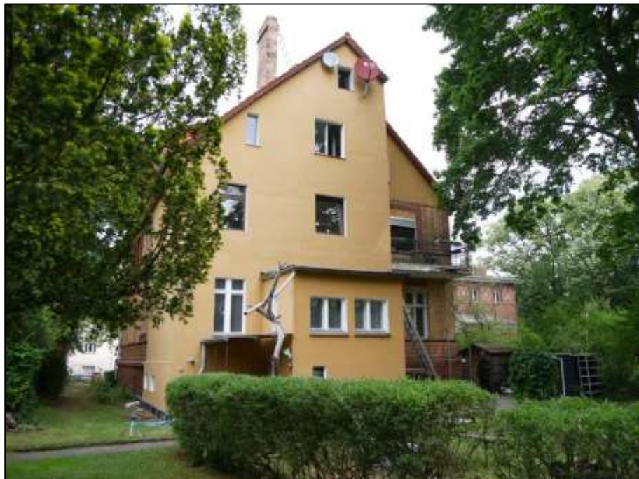
gartenseitige Giebelseite des straßenseitig auf dem Grundstück aufstehendes Mehrfamilien-Wohnhauses mit zum rechten Bauwich orientierter Gebäudefront links im Bild