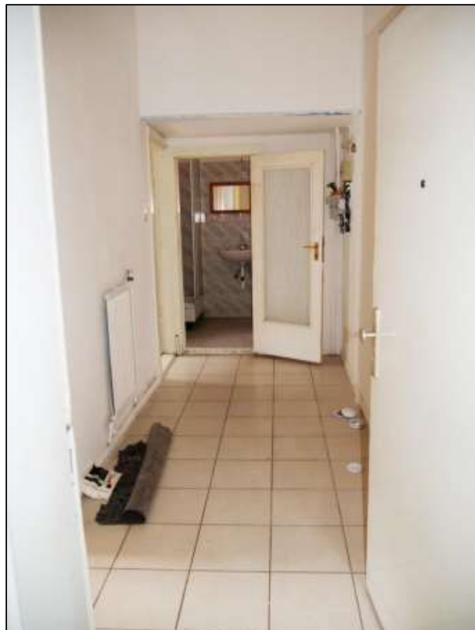
Blick durch die Wohnungsein- gangstür einer leerstehenden Wohnung in dem auf dem Grundstück aufstehenden Mehrfamilien- Wohnhaus