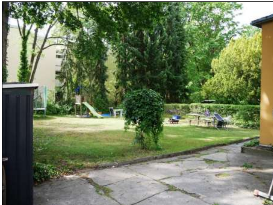
Blick aus dem linken Bauwich des Mehrfamilien-Wohnhauses in den dahinter belegenen Garten des Anwesens mit Zuwegung u.a. zu dem auf dem Grundstück außerdem belegenen Einfamilienhaus