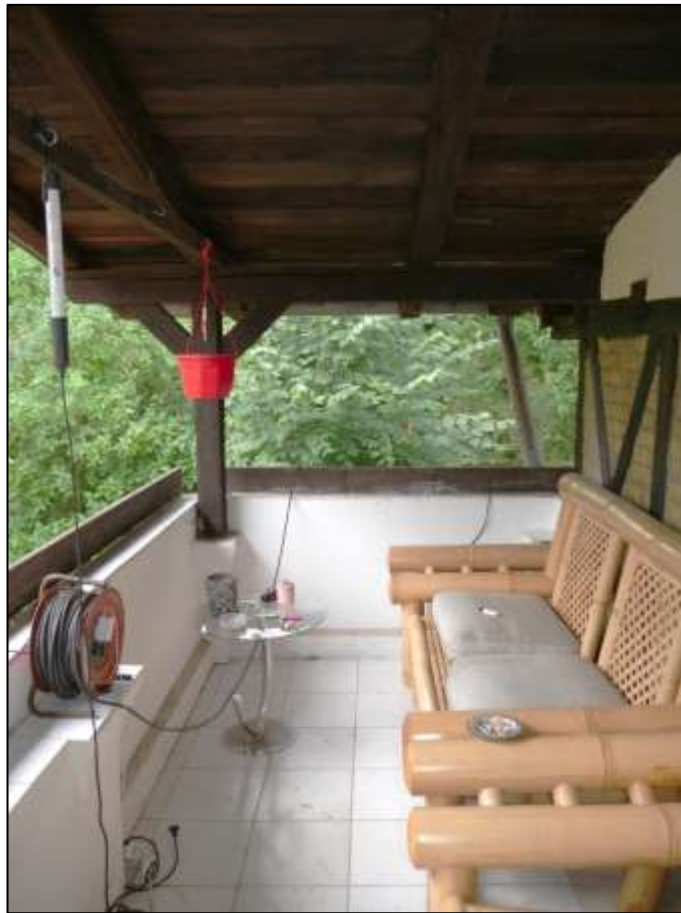
Loggia im Dachgeschoss des sogen. „Einfamilien- hauses“