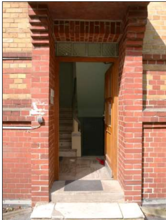
zum linken Bauwich orien- tierte Hausein- gangstür zum Treppenhaus des auf dem Grundstück Jä- gerstr. 8 auf- stehenden Mehrfamilien- Wohnhauses