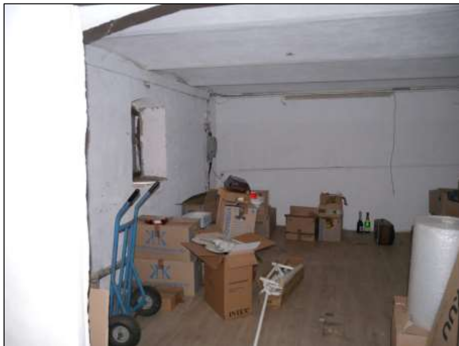
Lagerraum im Kellergeschoss des auf dem Grundstück aufstehenden Mehrfamilien-Wohnhauses