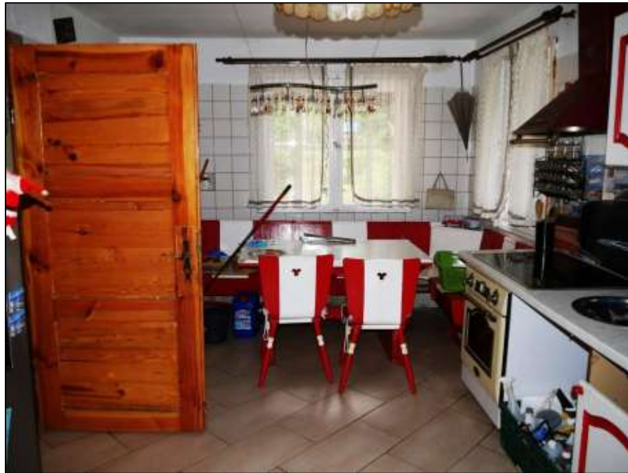
Küche im Erdgeschoss des sogen. „Einfamilienhauses“