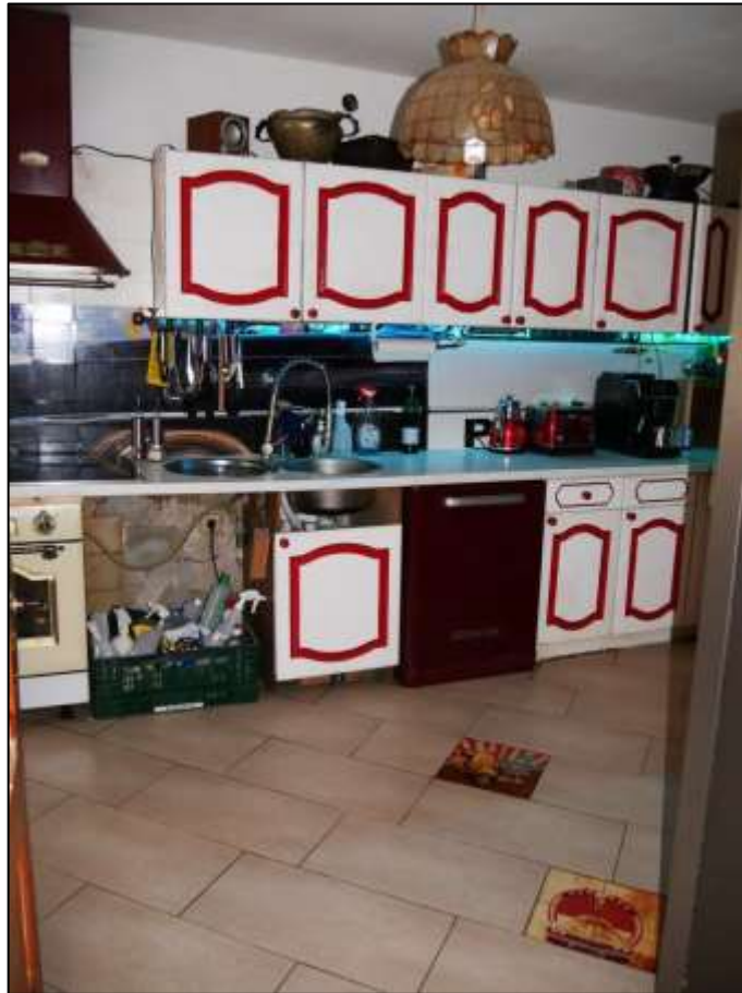
Küche im Erdgeschoss des sogen. „Einfamilienhauses“