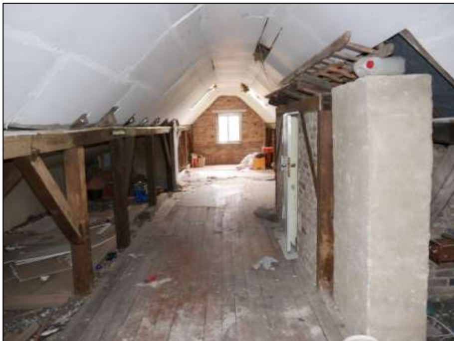
Spitzboden des auf dem Grundstück aufstehenden Mehrfamilien-Wohnhauses mit stehenden Fenstern in den Giebelseiten