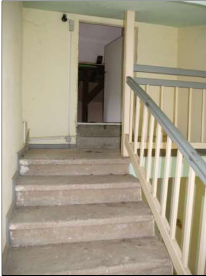
Treppenaufgang mit Zugang zum Spitzboden des auf dem Grundstück aufstehenden Mehrfamilien-Wohnhauses