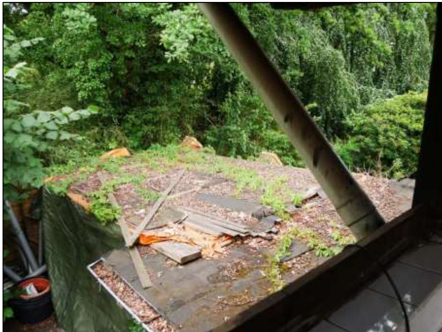
Blick von der Loggia im Dachgeschoss des sogen. „Einfamilienhauses“ auf das Dach des 1-geschossigen Schuppen-Anbaus im linken Bauwuch des Einfamilienhauses