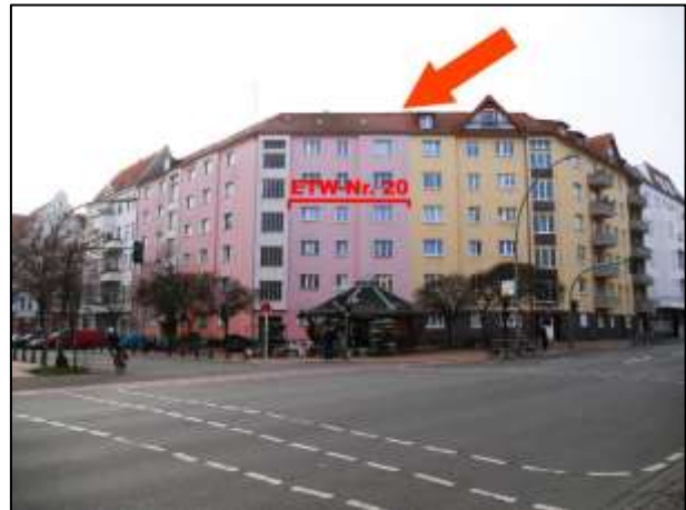
Hildegardstr. 18/18A (ETW-Nr. 20 im 3.OG)