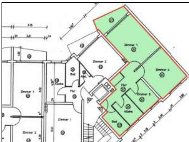
ETW-Nr. 20 im 3.OG im Geb. Hildegardstr.18