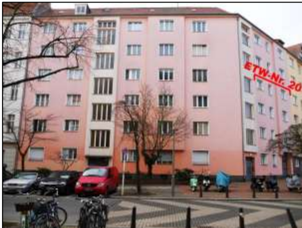
Gebäudefront Hildegardstraße 18A