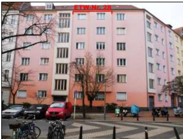
Hildegardstraße 18A mit ETW-Nr. 28 im 5.OG