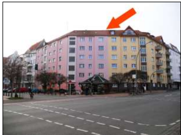
Grdst. Hildegardstraße 18, 18A