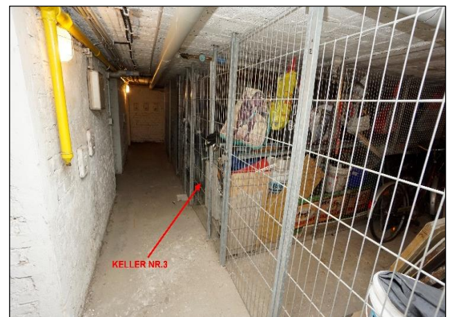
Keller Nr. 3