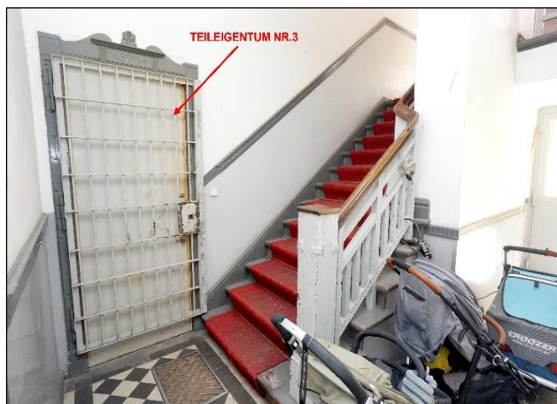
Zugangstür zum Bewertungsobjekt