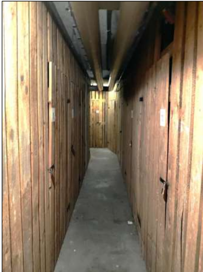
L-förmiger Kellerflur mit anbindenden Holzlattenverschlagen