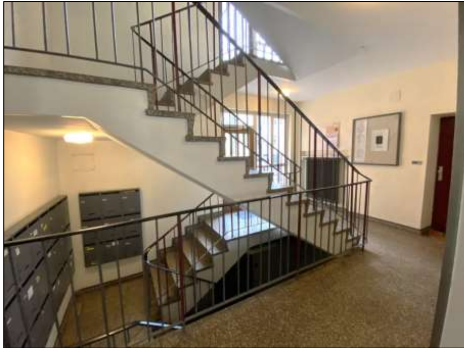
Treppenhaus des auf dem Grundstück Franklinstr. 16 aufstehenden Wohngebäudekomplexes im Bereich des Erdgeschosses mit offen anbindendem Kellertreppenabgang