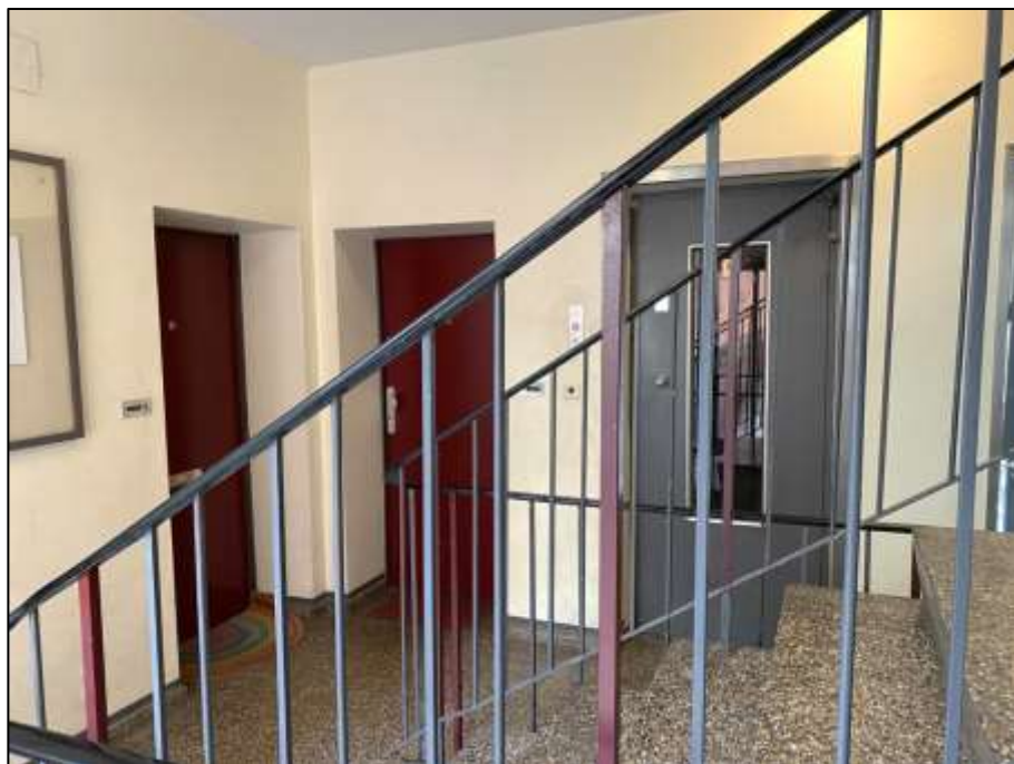
Treppenhaus im 1. Obergeschoss mit Aufzugszugang

knöcheltief überfluteter Kellerbereich in der östlichen Gebäudeecke vermtl. auf- grund einer Le- ckage