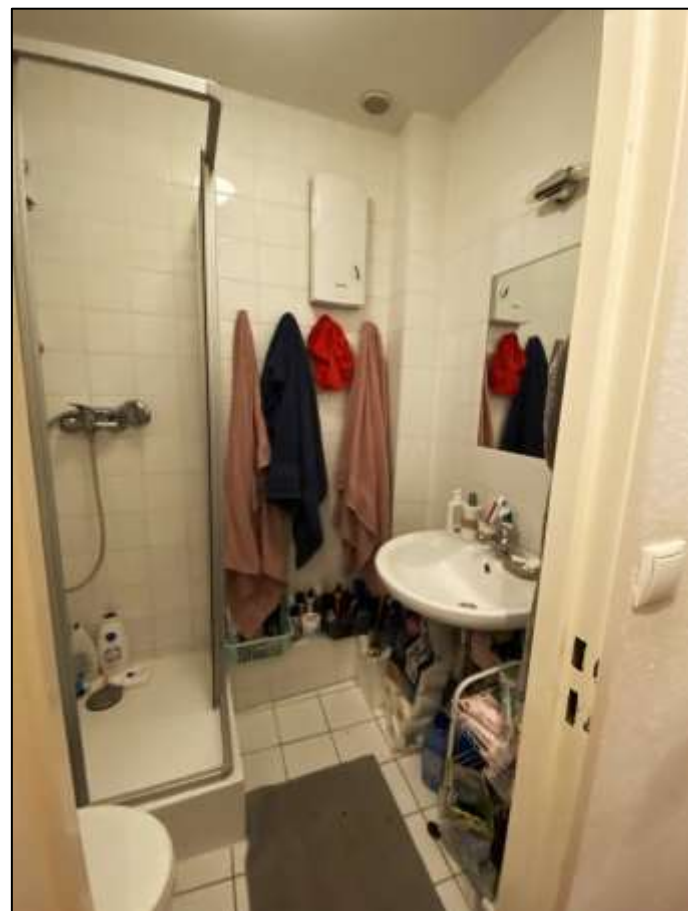
innenliegendes Duschbadezim- mer des Woh- nungseigen- tums Nr. 8