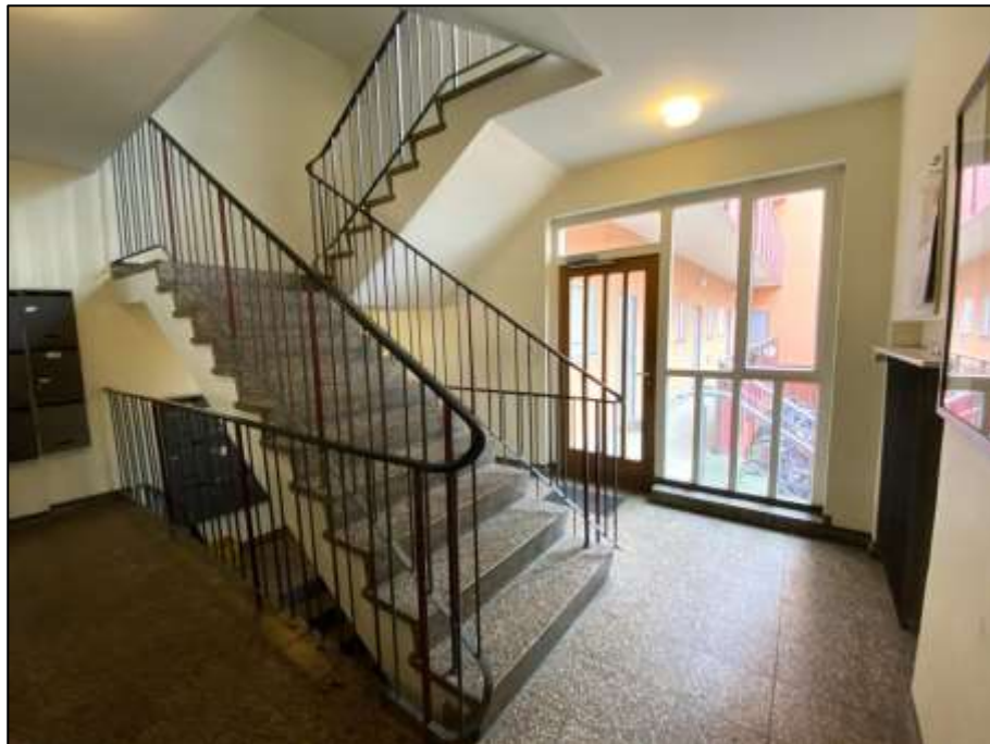
Treppenhaus des auf dem Grundstück Franklinstr. 16 aufstehenden Wohngebäudekomplexes im Bereich des Erdgeschosses mit offen anbindendem Kellertreppenabgang sowie Zugang zum Laubengang