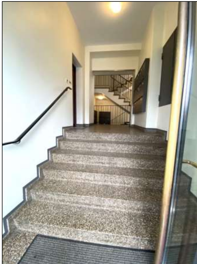
Hauseingangsbereich des auf dem Grundstück Franklinstr. 16 aufstehenden Wohngebäudekomplexes