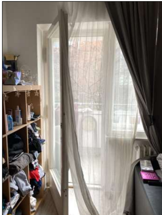
Blick aus dem Wohnzimmer auf die Fensteranlage zur Franklinstraße mit davor belegtem Balkon