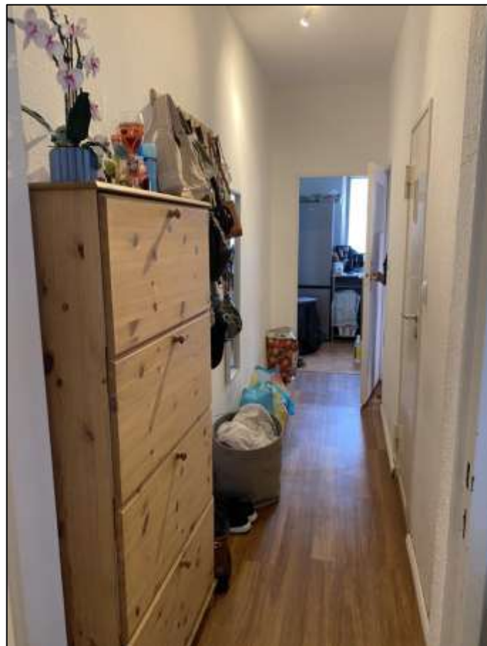
Flur innerhalb des Wohnungseigentums Nr. 8 an der rückwärtigen Stirnseite des Laubengangs im 1.OG des 6-geschossigen Gebäudeteils auf dem Grundstück Franklinstr. 16 mit im Hintergrund anbindender Küche - rechts im Bild anbindendes Badezimmer