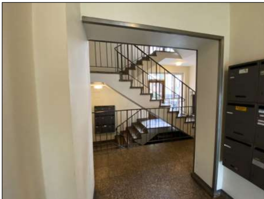
Hauseingangsbereich des auf dem Grundstück Franklinstr. 16 aufstehenden Wohngebäudekomplexes mit anbindendem Treppenhaus