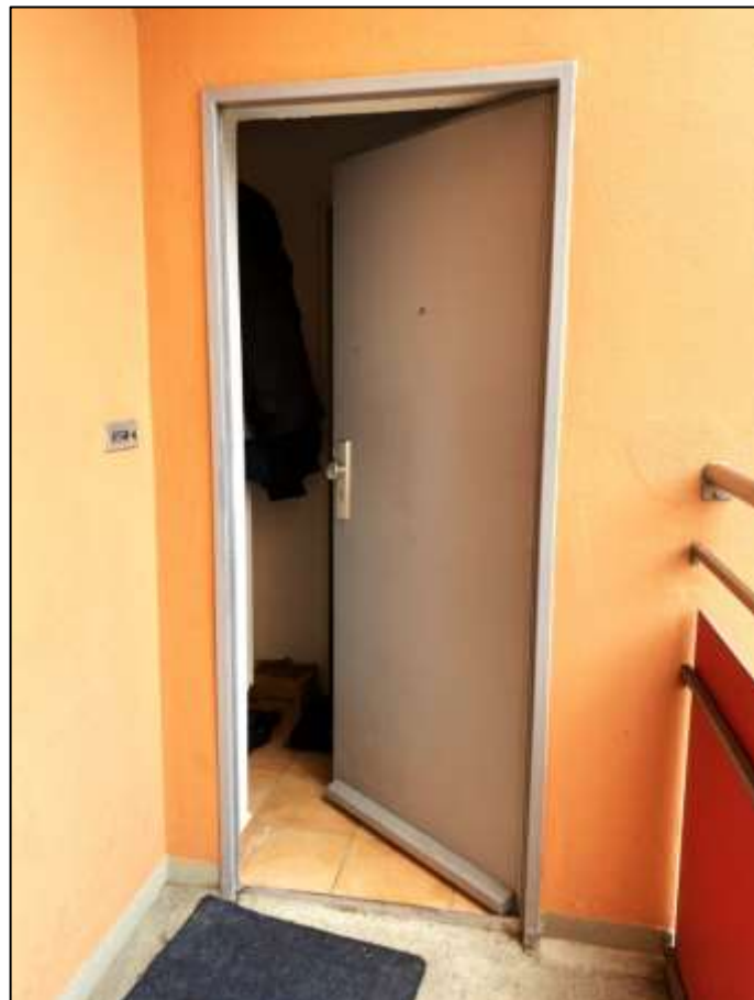
Eingangsflur des Wohnungseigentums Nr. 8 an der rückwärtigen Stirnseite des Laubengangs im 1.OG des 6-geschossigen Gebäude- teils auf dem Grundstück Franklinstr. 16