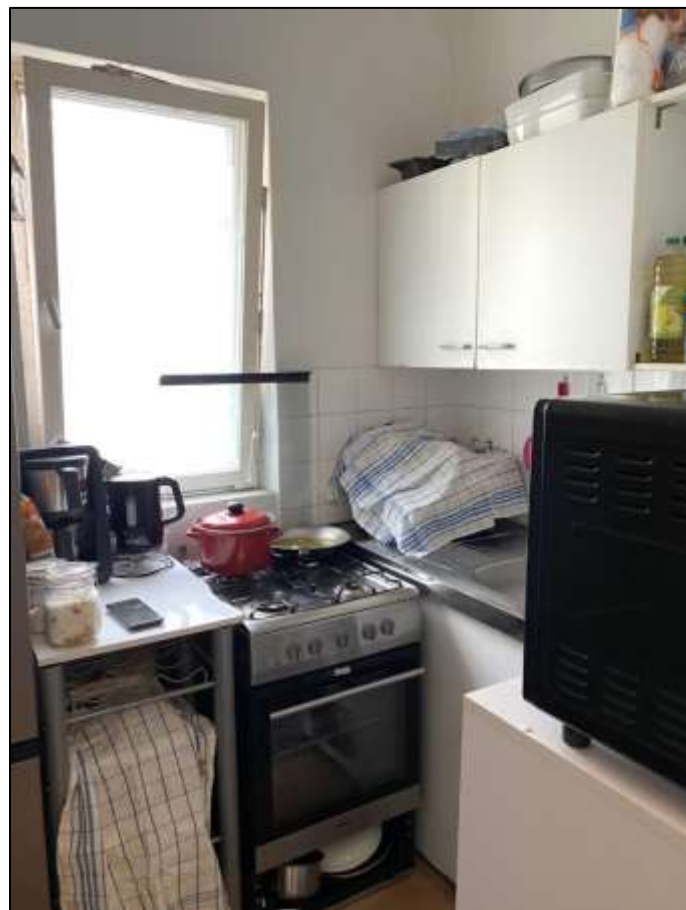
Küche des Wohnungsei- gentums Nr. 8 mit Orientierung des Fensters zur Helmholz- straße