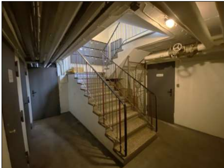
aus dem Erdgeschoss offen anbindendem Kellertreppenabgang mit anbindendem Sperrtür zu Abstellverschlagen im 6-geschossigen Gebäudetrakt rechts im Bild und an der Stirnseite links im Bild anbindendem Trockenraum