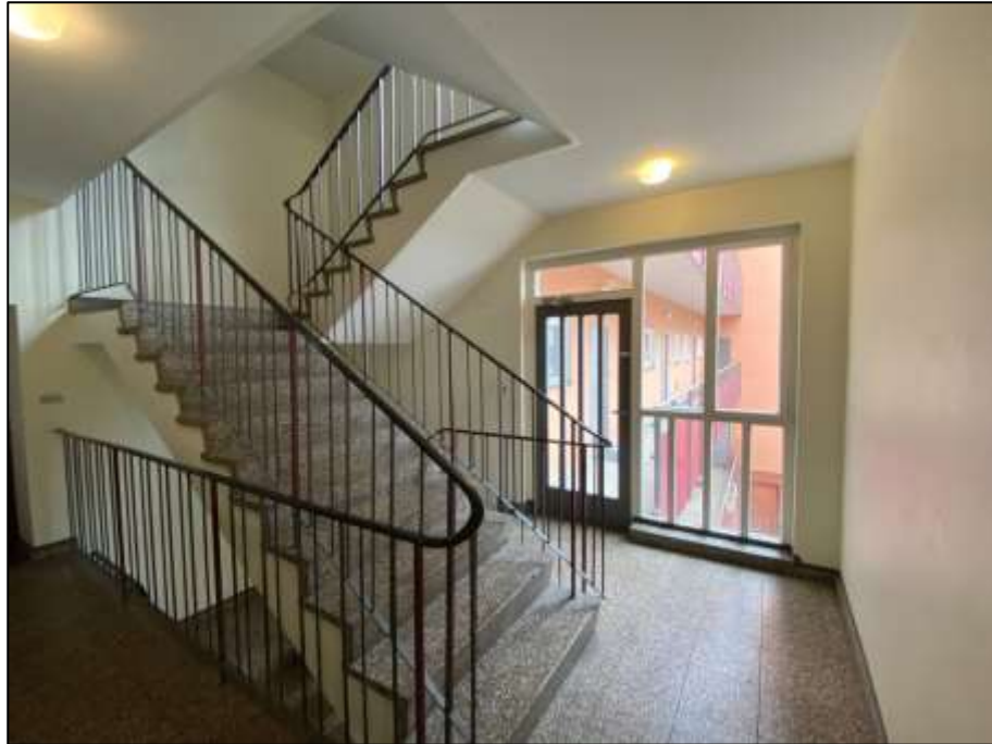
Treppenhaus im 1. Obergeschoss mit Zugang zum Laubengang