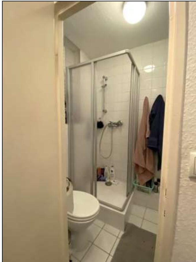
innenliegendes Duschbadezim- mer des Woh- nungseigen- tums Nr. 8