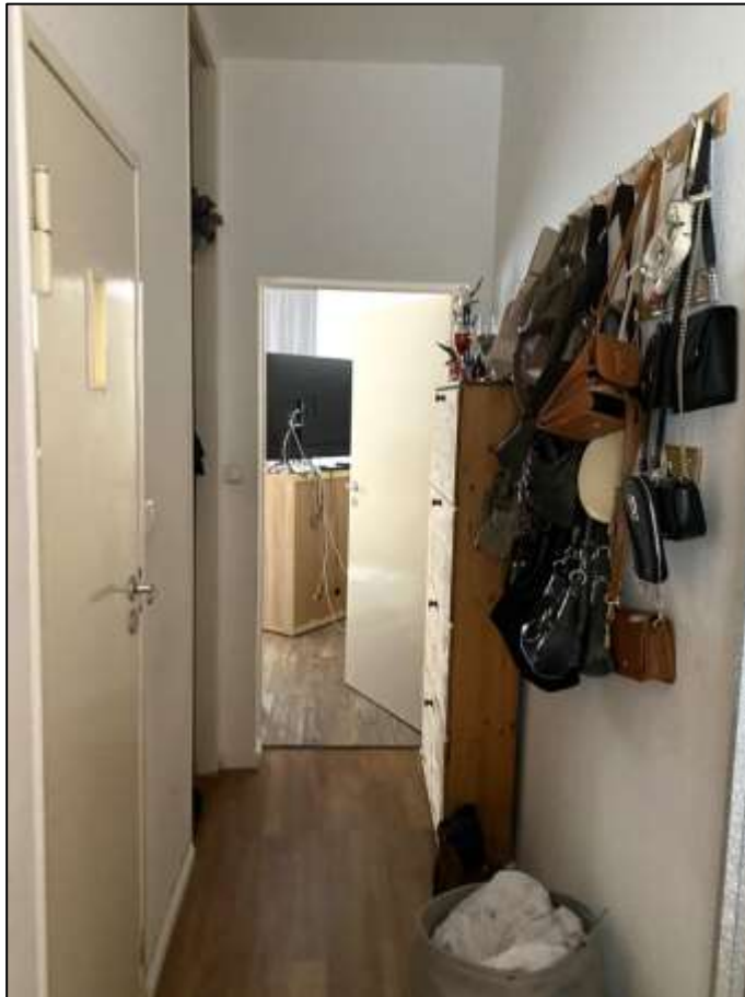
Flur innerhalb des Wohnungseigentums Nr. 8 an der rückwärtigen Stirnseite des Laubengangs im 1.OG des 6-geschossigen Gebäudeteils auf dem Grundstück Franklinstr. 16 mit im Hintergrund anbindendem Wohnzimmer - links im Bild anbindendes Badezimmer