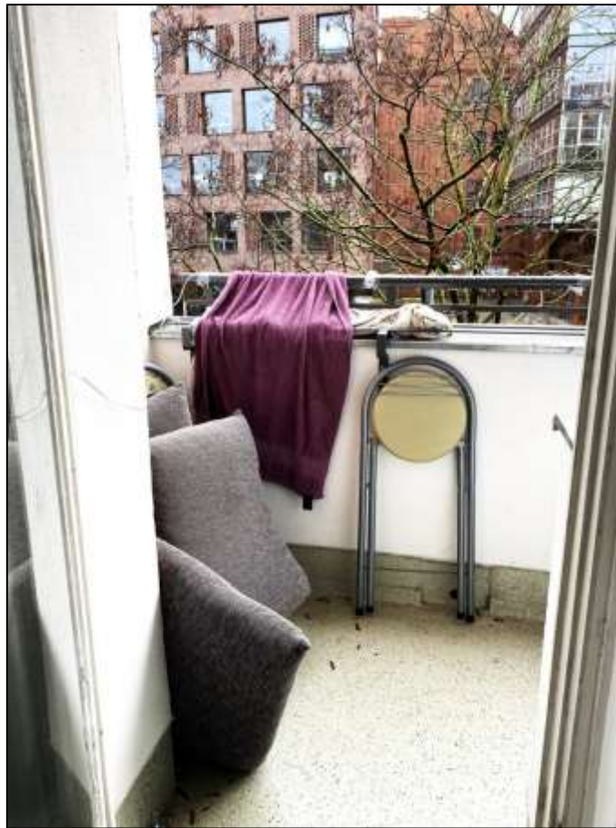
Blick aus dem Wohnzimmer auf den davor belegtem Balkon zur Franklinstraße