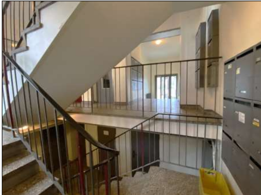
Treppenhaus des auf dem Grundstück Franklinstr. 16 aufstehenden Wohngebäudekomplexes im Bereich des Erdgeschosses mit Zugang zum Aufzug und offen anbindendem Kellertreppenabgang ohne Zugang zu der Aufzugsanlage - im Hintergrund Hauseingangsbereich