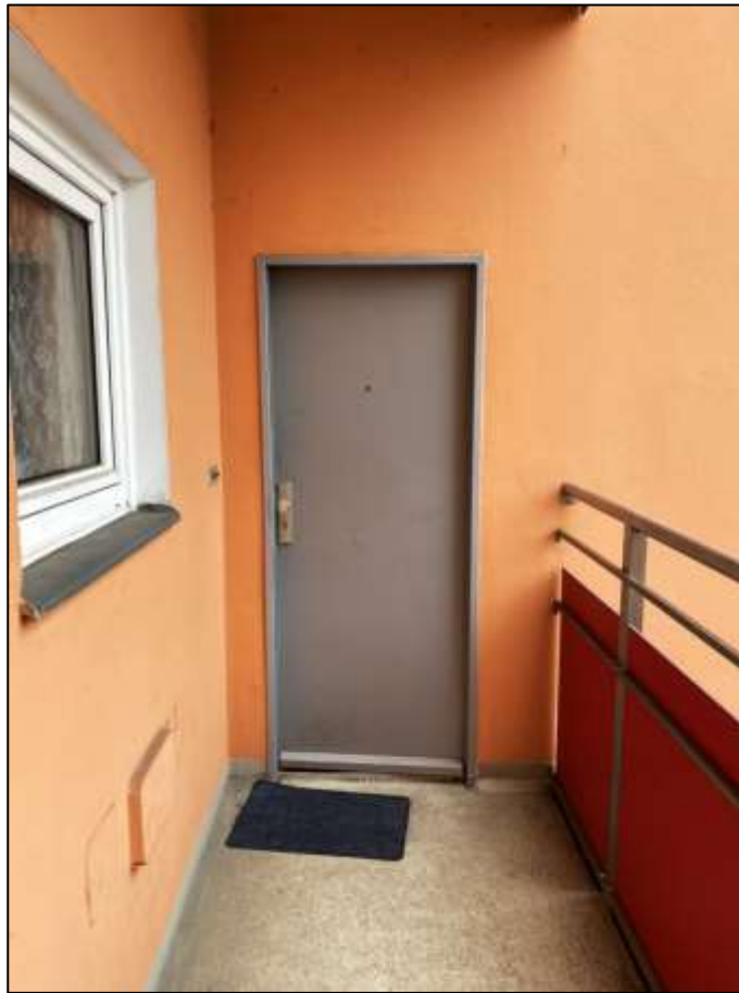
Eingangstür des Wohnungseigentums Nr. 8 an der rückwärtigen Stirnseite des Laubengangs im 1.OG des 6-geschossigen Gebäude- teils auf dem Grundstück Franklinstr. 16