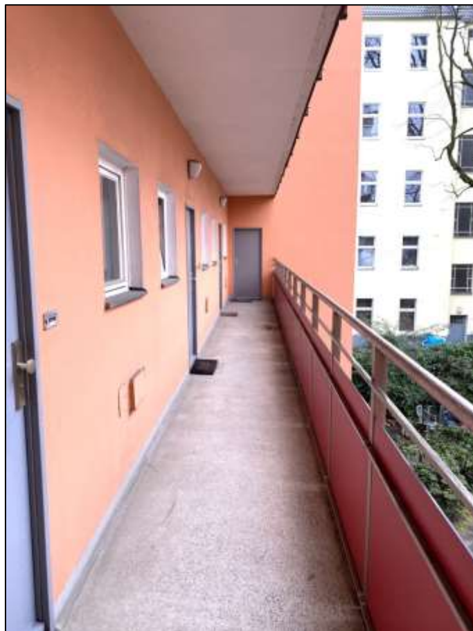
Laubengang im 1. Obergeschoss des 6-geschossigen Gebäudeteils mit Lage des Wohnungseigentums Nr. 8 an der rückwärtigen Stirnseite des Laubengangs