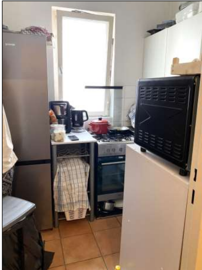
Küche des Wohnungsei- gentums Nr. 8 mit Orientierung des Fensters zur Helmholz- straße