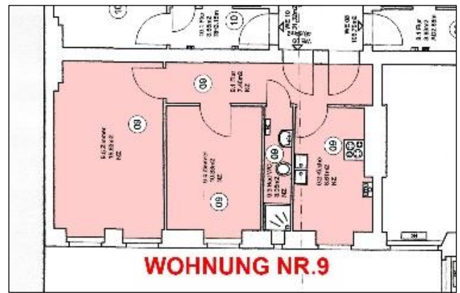
Grundriss Wohnung Nr.9