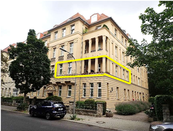
Gelbe Markierung: Lage Wohnung Nr. 7