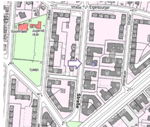
Pfeilausrichtung= Lage Wohnung Nr. 7