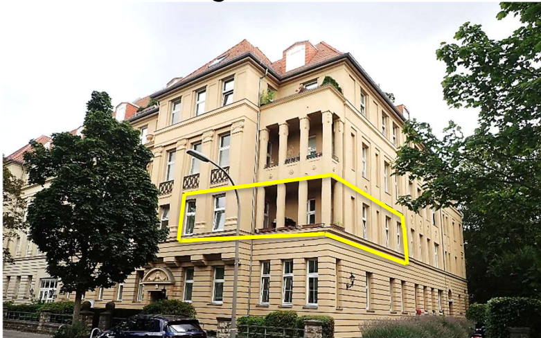
Straßenansicht, gelbe Markierung = Lage Wohnung Nr. 7

Auftrag von: Amtsgericht Charlottenburg, Geschäftszeichen 70 K 13/22