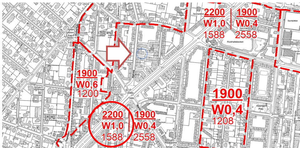
Roter Kreis: Bodenrichtwert zum 01.01.2022, Bodenrichtwertzone 1588, Pfeilrichtung: Lage Bewertungsgegenstand

Zum 01.01.2014 lag der betreffende Wert für die Bodenrichtwertzone 1588 noch bei 650 €/m 2 Bodenfläche, d. h. der Wert hat sich innerhalb von acht Jahren um das 3,4-fache erhöht. Dieser Wertanstieg verdeutlicht, dass sich unbebaute und bebaute Grundstücke im Land Berlin erheblich verteuert haben.