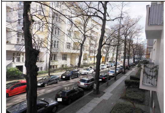
Umgebungsbebauung mit Blick zum Kudamm

Gemeinschaftseigentum Baujahr: um 1960 kein Denkmalschutz Grundstück, bebaut mit einem Mehrfamilienwohnhaus mit 6 Geschossen, als „Zweispänner“ konzipiert, unterkellert, 3 Hausaufgänge, zentrale Heizung, dezentrale WW-Versorgung, Gasanschluss in den Wohnungen, eine Durchfahrt zum Hof, Pkw-Stellplätze im Hof, guter Bauzustand, instand gehalten