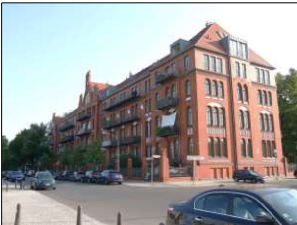
Grundstück Sophie-Charlotten-Str. 115 u.a.