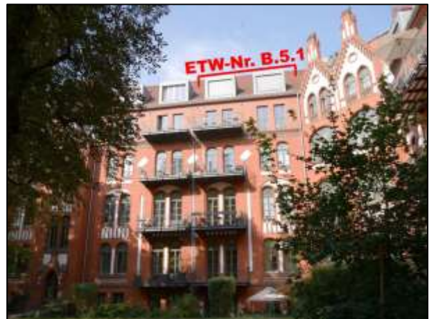
Sophie-Charlotten-Str. 115 - WE-Nr. B.5.1