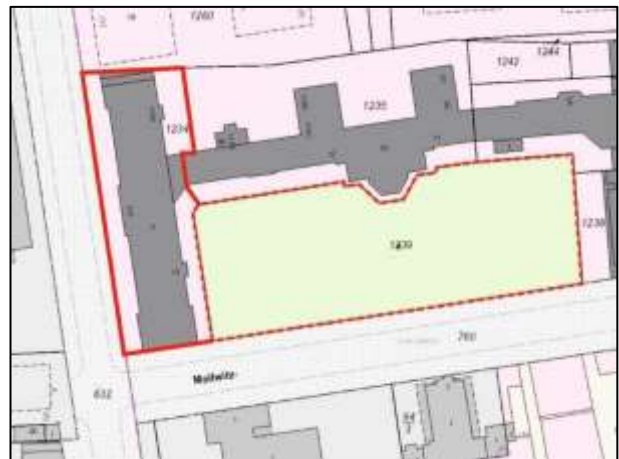
Flurkarte (S.-Charl.Str. 115 u.a.- Flst. 1234 u.a.)