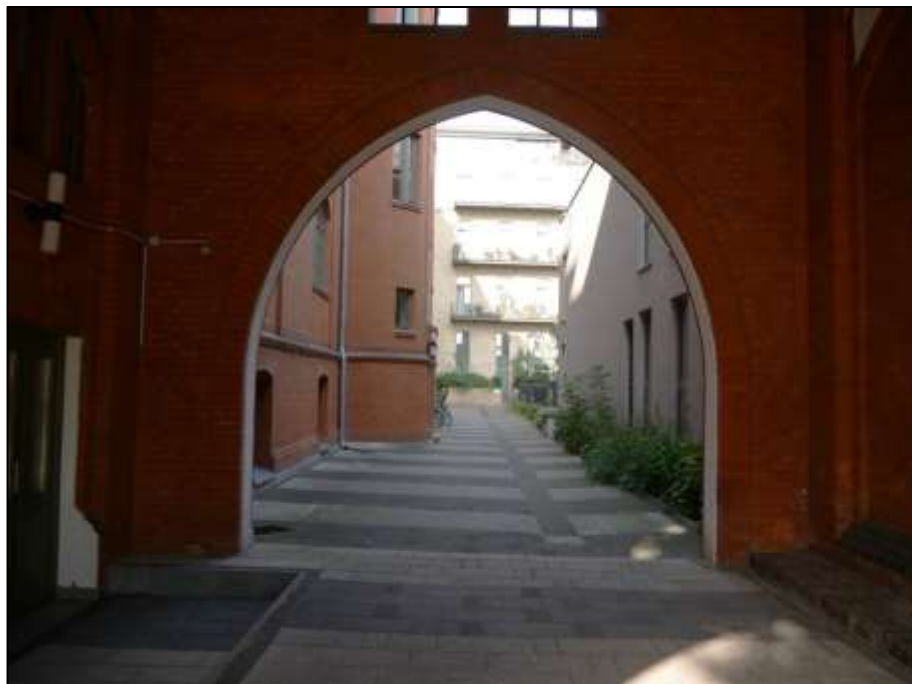
Blick aus dem Tordurchgang im Gebäudeteil Heubnerweg 3 auf dem Nachbargrundstück Heubnerweg 3, 3A, 5 (Flurstück 1243 u.a.) in den Blockinnenbereich u.a. zu dem hier betroffenen Hinterliegergrundstück Mollwitzstr. 11, 12, u.a. (Flurstück 1235) im Hintergrund