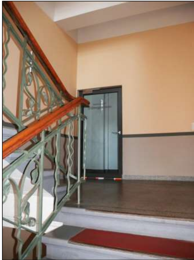
an das Treppenhaus in einem Obergeschoss anbindender Flur zu einer anbindenden Wohnung und zu der in jedem Geschoss anbindenden Aufzugsanlage