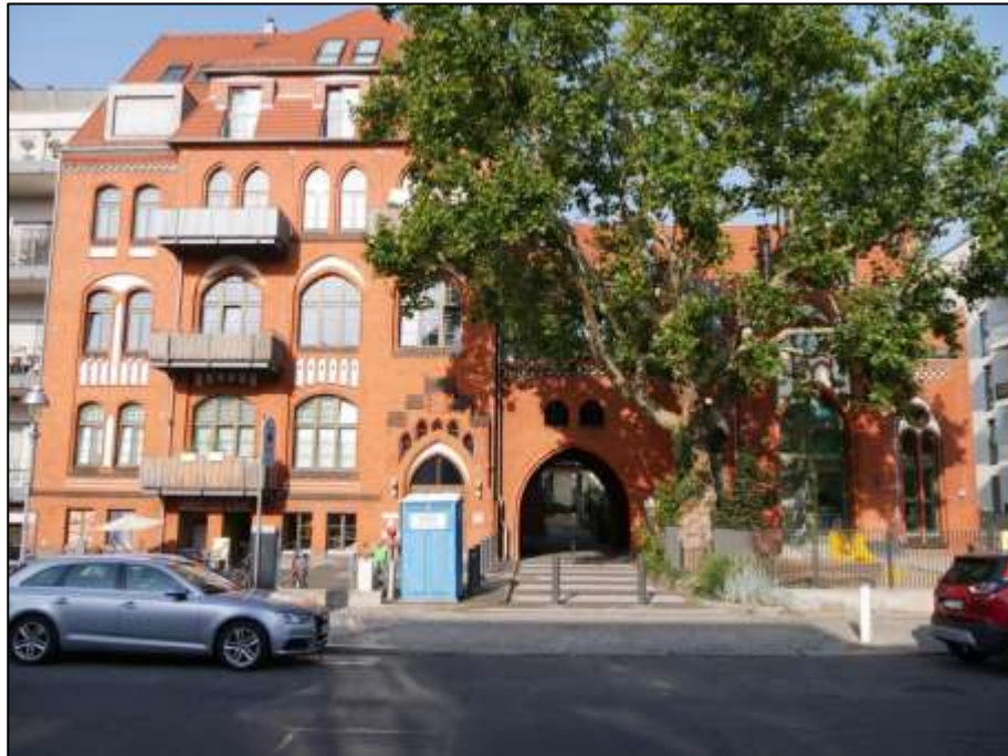
Blick über den Heubnerweg auf den auf dem Nachbargrundstück Heubnerweg 3, 3A, 5 (Flurstück 1243 u.a.) aufstehenden Gebäudeteil Heubnerweg 3 mit Tordurchgang in den Blockinnenbereich u.a. zu dem hier betroffenen Hinterliegergrundstück Mollwitzstr. 11, 12, u.a. (Flurstück 1235)