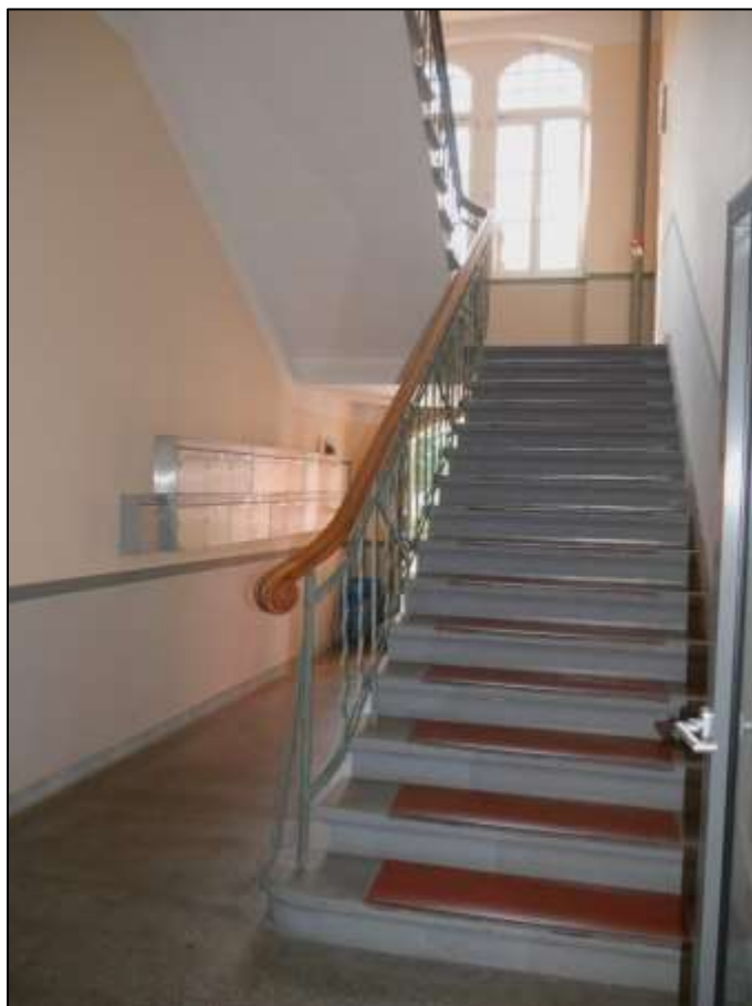
Hauseingangsbereich des Treppenhauses des Gebäudeteils Mollwitzstr. 11 im Erdgeschoss („Beletage“) in dem auf dem Grundstück Mollwitzstr. 11, 12 (Flurstück 1235) aufstehenden Gebäudekomplex mit in die Obergeschosse aufgehendem Treppenlauf