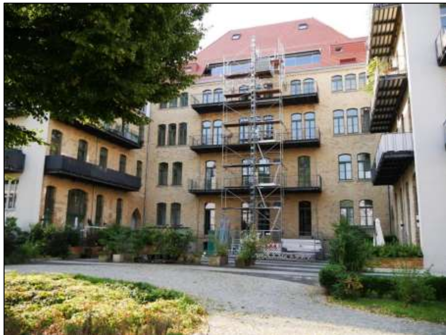
zum Blockinnenbereich orientierte Front des auf dem Hinterliegergrundstück Mollwitzstr. 11, 12 u.a. (Flurstück 1235) aufstehenden Hauptgebäudes zwischen den beiden Mittelflügeln rechts und links im Bild