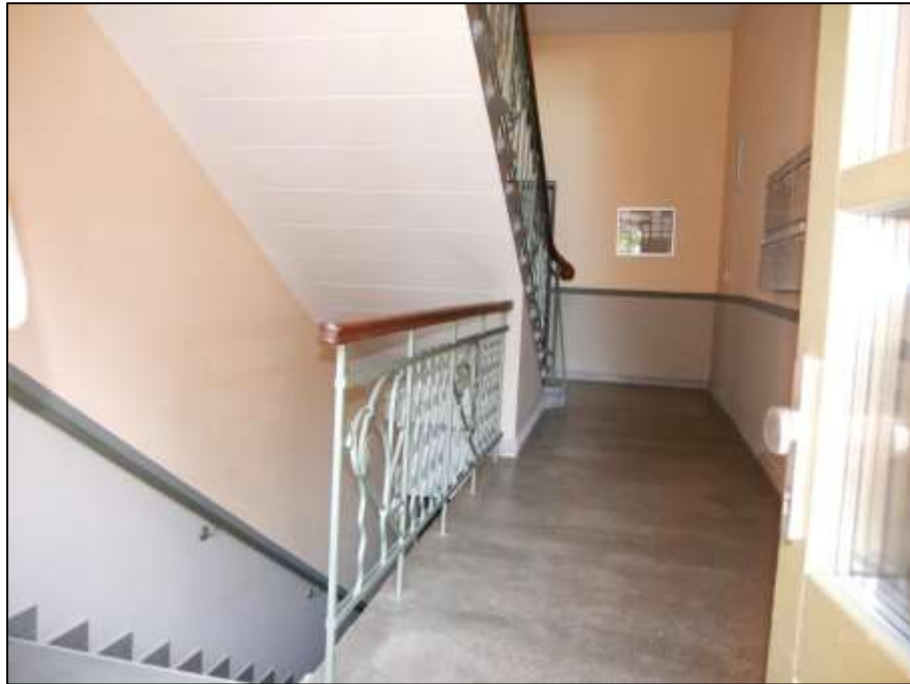
Hauseingangsbereich des Treppenhauses des Gebäudeteils Mollwitzstr. 11 im Erdgeschoss („Beletage“) in dem auf dem Grundstück Mollwitzstr. 11, 12 (Flurstück 1235) aufstehenden Gebäudekomplex