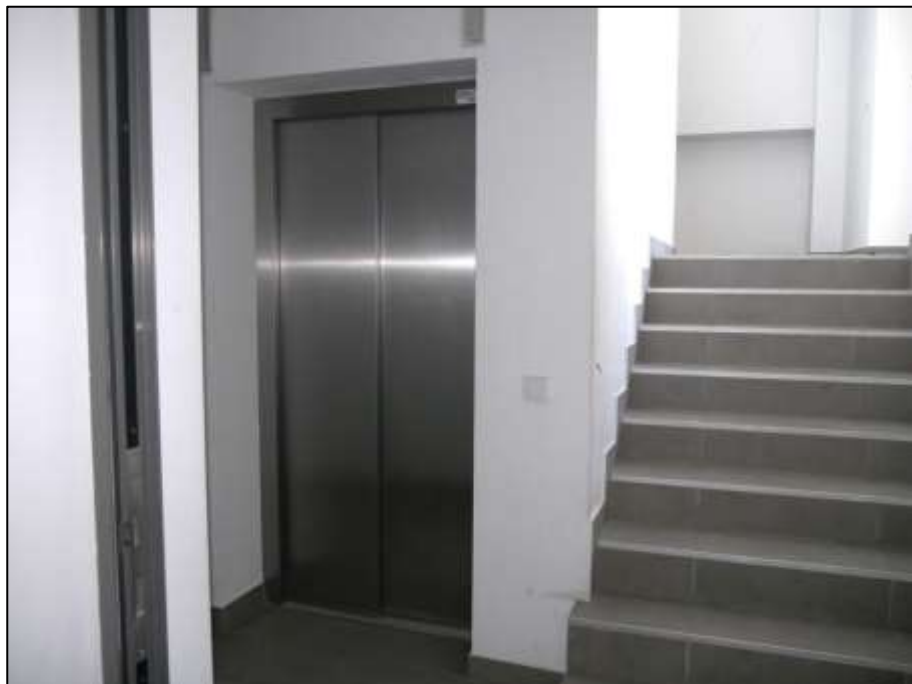
im Untergeschoss des Gebäudeteils Mollwitzstr. 11 an den Treppengang aus dem Hauseingangsbereich links anbindender Flurteil mit anbindender Aufzugsanlage und aufgehender Treppe zu einem Zwischengeschoss