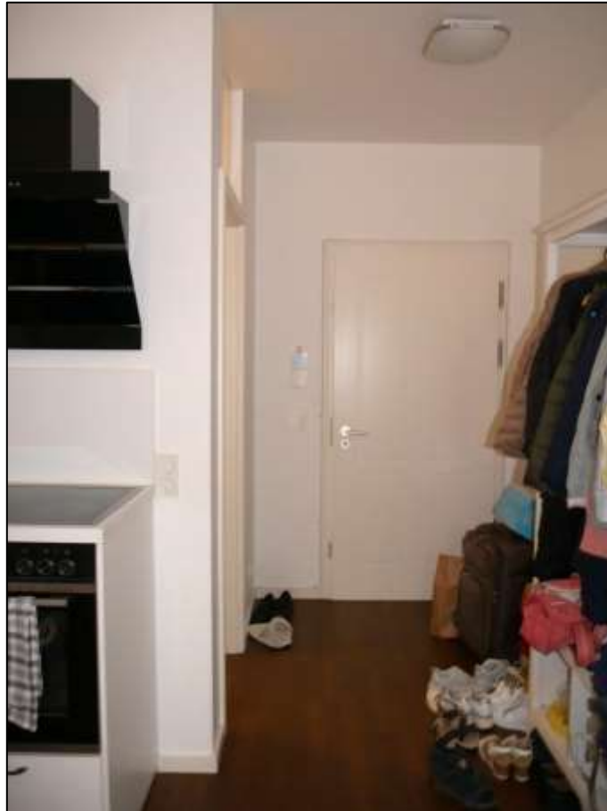
Eingangsflur mit anbindendem Duschbadezimmer und anbindender Küche im offenen Wohnzimmer im Teileigentum Nr. F.0.4 im Untergeschoss (Gartengeschoss) des Gebäudeteils Mollwitzstr. 11 auf dem Grundstück Mollwitzstr. 11, 12 u.a. (Flurstück 1235) - Eingangstür zum Treppenhauseflur im Hintergrund