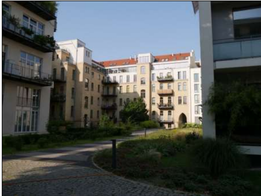
Blockinnenbereich u.a. mit dem auf dem Grdst. Mollwitzstr. 11, 12 u.a. (Flurstück 1235) aufstehenden Haupttrakt links im Bild - Blick nach Süd-Westen mit im Hintergrund rechts sichtbarem Tordurchgang im Gebäudeteil Sophie-Charlotten-Str. 115A auf dem Grundstück Mollwitzstr. 13, Sophie-Charlotten-Str. 115, 115A (Flst. 1234)