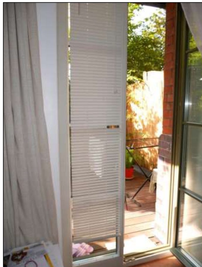
Fenstertür im Wohnzimmer im Teileigentum Nr. F.0.4 zur Gartenterrasse im Untergeschoss (Gartengeschoss) des Gebäudeteils Mollwitzstr. 11 auf dem Grundstück Mollwitzstr. 11, 12 u.a. (Flurstück 1235)