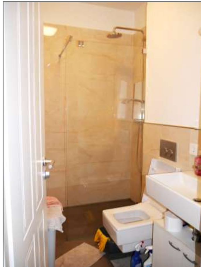
Duschbadzimmer im Teileigentum Nr. F.0.4 im Untergeschoss (Gartengeschoss) des Gebäudeteils Mollwitzstr. 11 auf dem Grundstück Mollwitzstr. 11, 12 u.a. (Flurstück 1235)