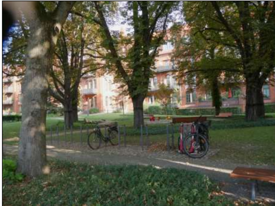
Blick nach Nord-Westen über das Gemeinschaftsgrundstück („Erholungsfläche“) Mollwitzstr. 11, 12, 13, Heubnerweg 1, 3, 3A, 3B, 3C, Sophie-Charlotten-Str. 115, 115A, 115B, 115C, 115D mit im Hintergrund in Hinterliegerlage belegendem Grundstück Mollwitzstr. 11, 12, Heubnerweg 3B, 3C, Sophie-Charlotten-Str. 115B, 115C, 115D