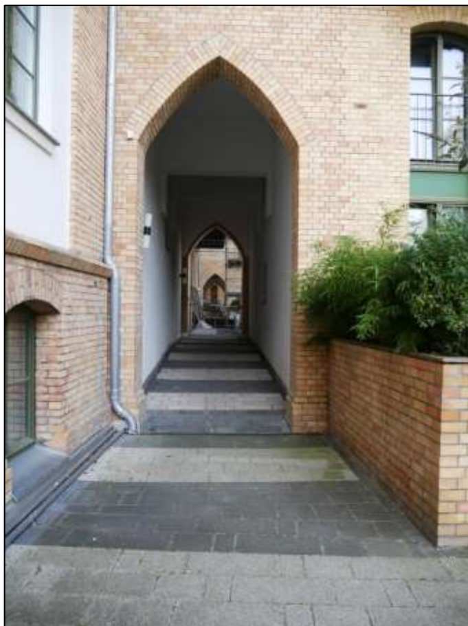
östliche Front des Gebäude-durchgangs im östlichen Mitteltrakt des auf dem hier betroffenen Hinterliegergrundstück Mollwitzstr. 11, 12, u.a. (Flurstück 1235) belegenen Gebäudekomplexes