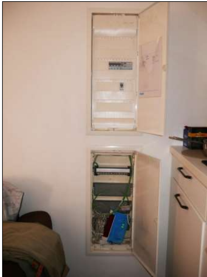
Sicherungskasten etc. innerhalb des Wohnzimmers neben der Küchenarbeitszeile im Teileigentum Nr. F.0.4 im Untergeschoss (Gartengeschoss) des Gebäudeteils Mollwitzstr. 11 auf dem Grundstück Mollwitzstr. 11, 12 u.a. (Flurstück 1235)