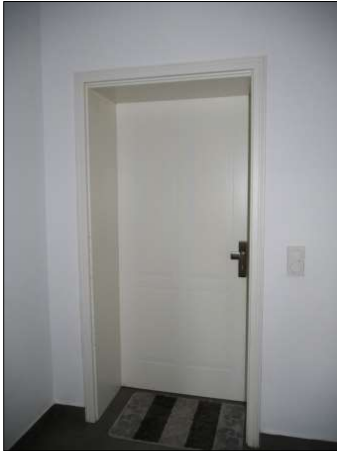
Eingangstür des Teileigentums Nr. F.0.4 im Untergeschoss (Gartengeschoss) des Gebäudeteils Mollwitzstr. 11 auf dem Grundstück Mollwitzstr. 11, 12 u.a. (Flurstück 1235)