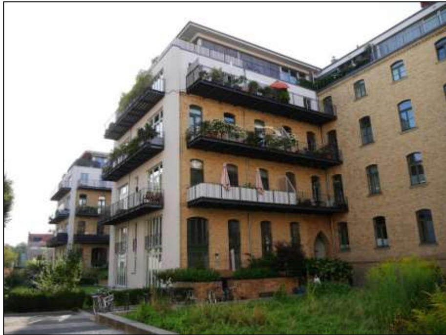
Blockinnenbereich u.a. mit den auf dem Grdst. Mollwitzstr. 11, 12 u.a. (Flurstück 1235) aufstehenden beiden an der Nord-Seite des Haupttraktes aufstehenden Mittelflügeln - Blick nach Süd-Osten