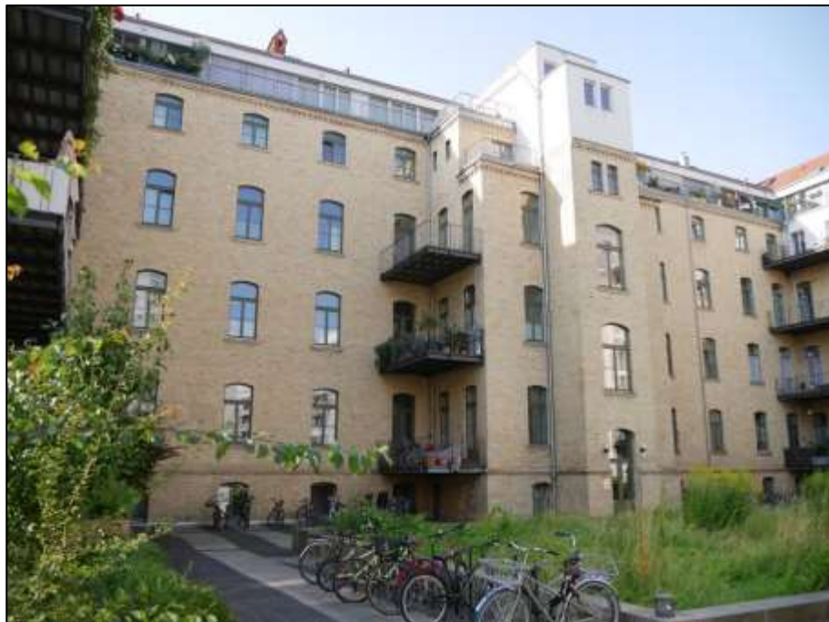
Blockinnenbereich u.a. mit dem auf dem Grdst. Mollwitzstr. 11, 12 u.a. (Flurstück 1235) aufstehenden Haupttrakt im Bereich des Gebäudeteils Mollwitzstraße 12