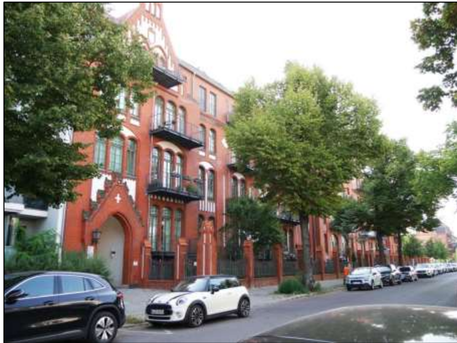
Blick über die Sophie-Charlotten-Straße nach Süd-Osten mit auf dem Grundstück Mollwitzstr. 13, Sophie-Charlotten-Str. 115, 115A (Flst. 1234) aufstehendem Gebäudekomplex u.a. mit Durchfahrt im Vordergrund links zu dem in Hinterliegerlage belegenen Grundstück Mollwitzstr. 11, 12 (Flurstück 1235)