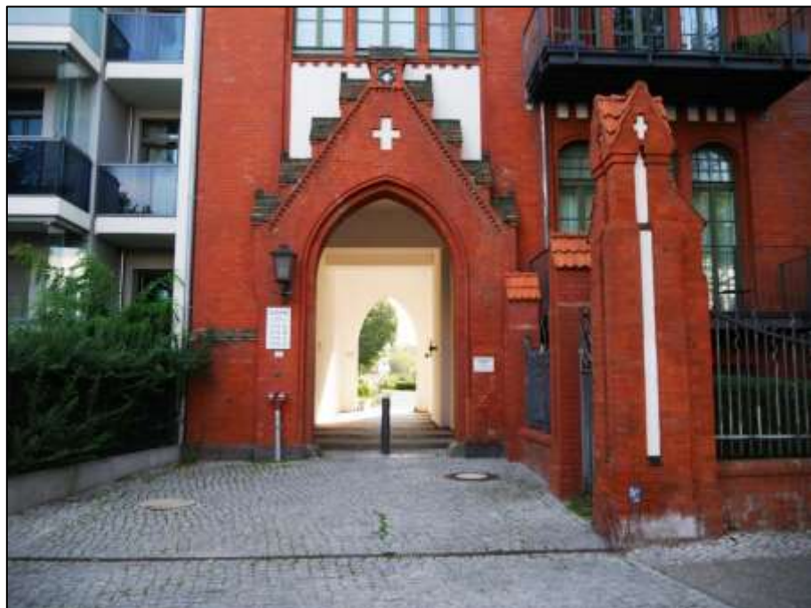
Gebäudedurchfahrt von der Sophie-Charlotten-Straße aus im Gebäude- teil 115A a.d. Grdst. Mollwitzstr. 13, Sophie-Charlotten-Str. 115, 115A (Flst. 1234) zu dem in Hinterliegerlage belegenen Grundstück Mollwitz- str. 11, 12 (Flurstück 1235)