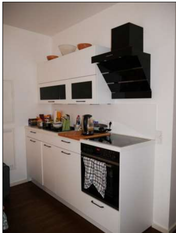
Küchenzeile innerhalb des Wohnzimmers im Teileigentum Nr. F.0.4 im Untergeschoss (Gartengeschoss) des Gebäudeteils Mollwitzstr. 11 auf dem Grundstück Mollwitzstr. 11, 12 u.a. (Flurstück 1235)