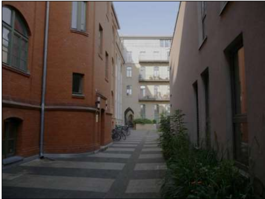
Blick nach Westen in den Blockinnenbereich im Bereich des Nachbargrundstücks Heubnerweg 3, 3A, 5 (Flurstück 1243 u.a.) auf den östlichen Mitteltrakt des auf dem hier betroffenen Hinterliegergrundstück Mollwitzstr. 11, 12, u.a. (Flurstück 1235) belegenen Gebäudekomplexes