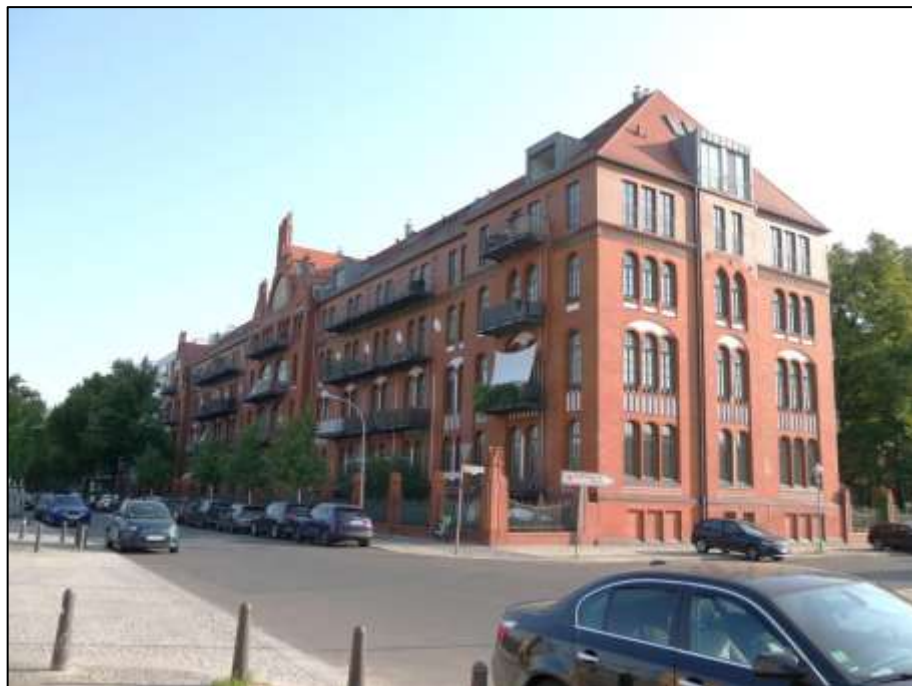
Blick über die Sophie-Charlotten-Straße nach Nord-Osten mit auf dem Grundstück Mollwitzstr. 13, Sophie-Charlotten-Str. 115, 115A (Flst. 1234) aufstehendem Gebäudekomplex u.a. mit Durchfahrt zu dem in Hinterliegerlage belegenen Grundstück Mollwitzstr. 11, 12 (Flurstück 1235)