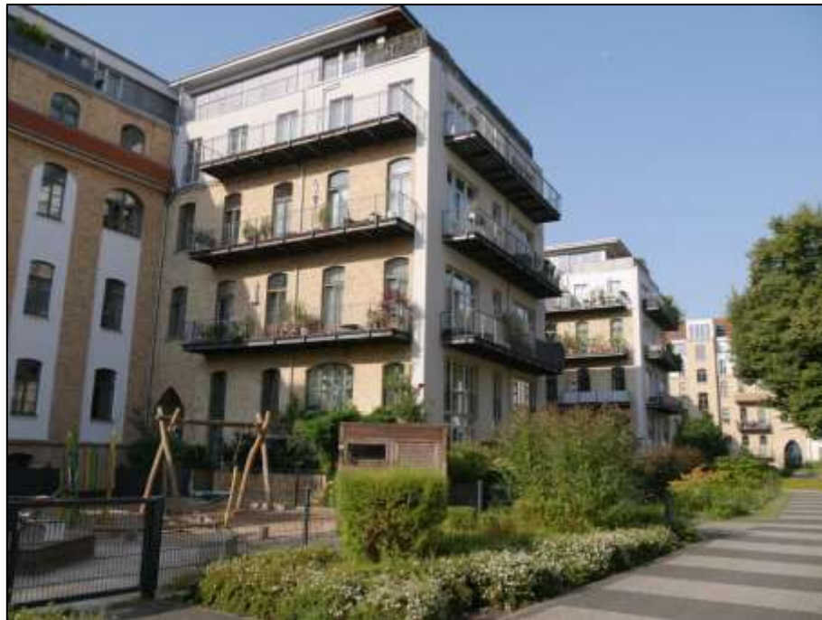
Blockinnenbereich u.a. mit den auf dem Grdst. Mollwitzstr. 11, 12 u.a. (Flurstück 1235) aufstehenden beiden an der Nord-Seite des Haupttraktes aufstehenden Mittelflügeln - Blick nach Süd-Westen mit im Hintergrund rechts sichtbarem Tordurchgang im Gebäudeteil Sophie-Charlotten-Str. 115A auf dem Grundstück Mollwitzstr. 13, Sophie-Charlotten-Str. 115, 115A (Flst. 1234)