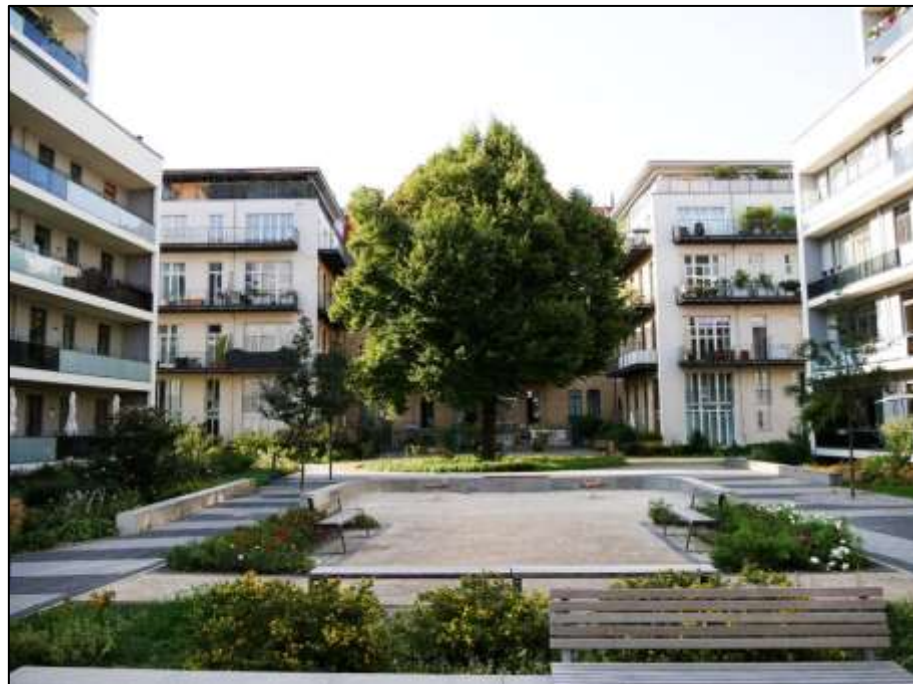
Blockinnenbereich u.a. mit den auf dem Grdst. Mollwitzstr. 11, 12 u.a. (Flurstück 1235) aufstehenden beiden an der Nord-Seite des Haupttraktes aufstehenden Mittelflügeln - Blick nach Süden