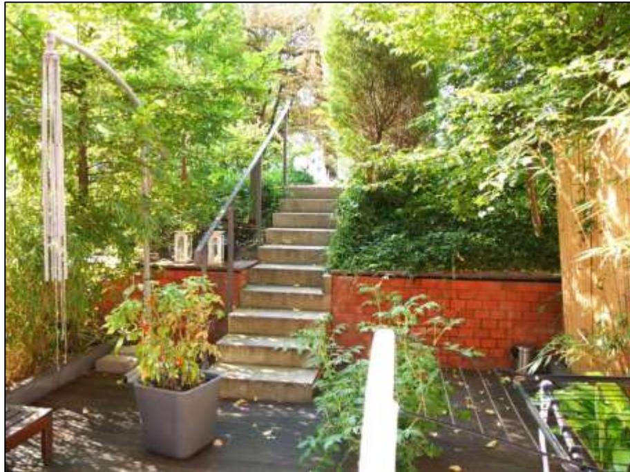
in das Gelände eingesenkte Gartenterrasse vor dem Wohnzimmer im Teileigentum Nr. F.0.4 im Untergeschoss (Gartengeschoss) des Gebäudeteils Mollwitzstr. 11 auf dem Grundstück Mollwitzstr. 11, 12 u.a. (Flurstück 1235) mit aufgehender Freitreppe in den anbindenden Grundstücksteil und das Gemeinschaftsgrundstück Mollwitzstr. 11, 12, 13 u.a.) (Flurstück 1239)