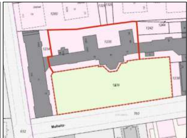
Flurkarte (Mollwitzstr. 11, 12 - Flst. 1235 u.a.)