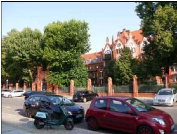
Grdst. Mollwitzstr. 11, 12 u.a. (Flst. 1235)