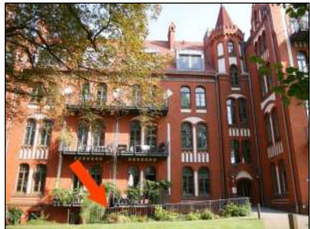
Geb. Mollwitzstr. 12 - TE-Nr. E.0.1 im UG