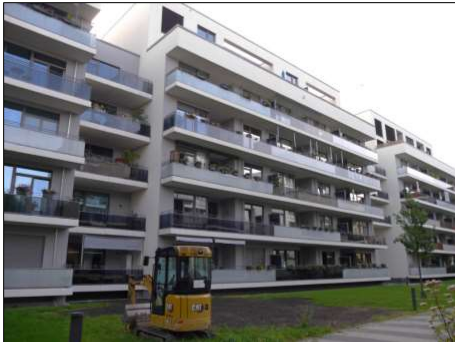
rückwärtige Front des Gebäudes Heubnerweg 9 (Haus 10)