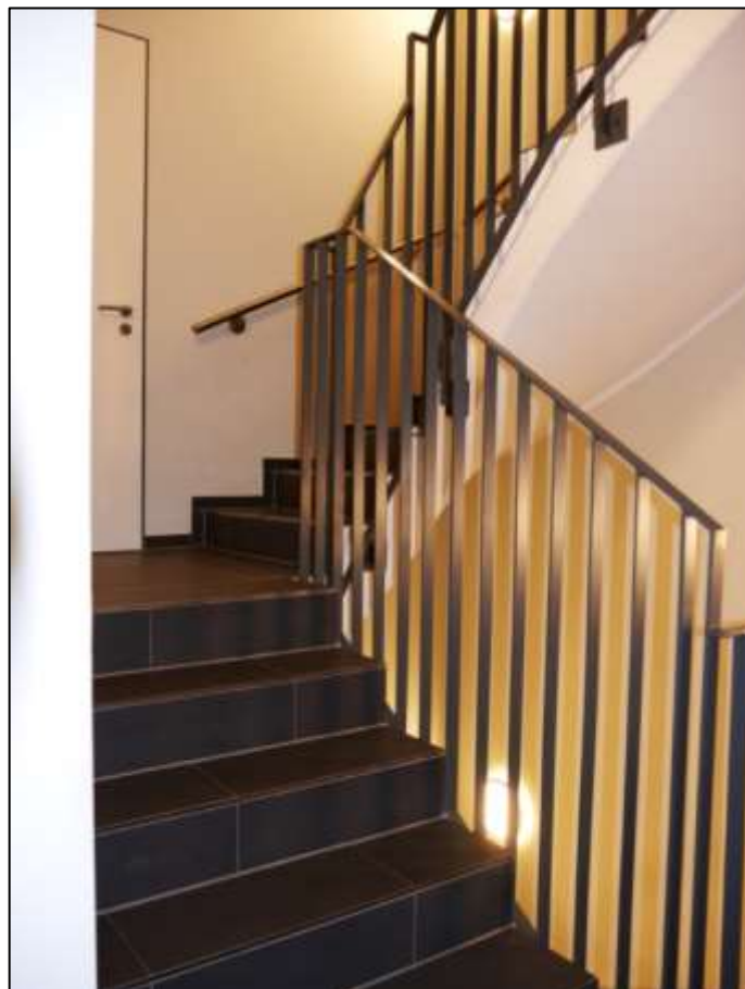
innenliegendes Treppenhaus mit anbindendem Zugang zum Zentralflur im Hochparterre links im Bild