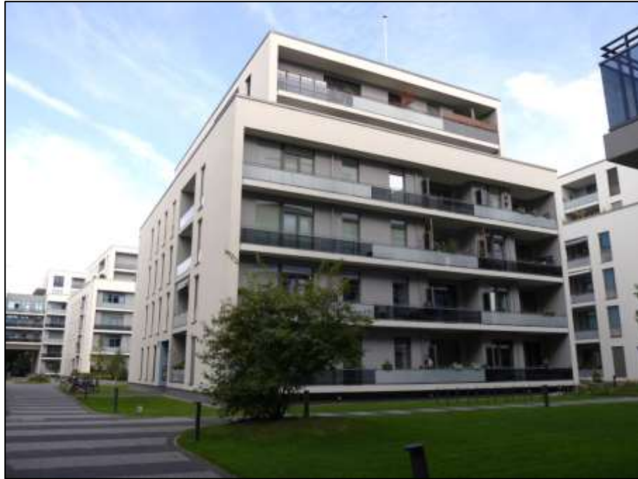
auf dem hier betroffenen Grundstück aufstehendes Haus 15 mit der Anschrift Heubnerweg 9A und zum linken Bauwich orientiertem Hauseingang links im Bild sowie zum straßenseitigen Gebäude orientierter vorderen Gebäudefront