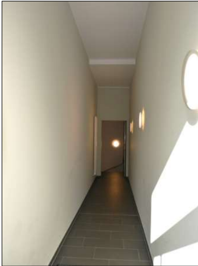
Hauseingangsbereich mit schmalem Flur-zugang zu dem innenliegenden Treppenhaus an der rechten Stirnseite des Zentralflurs der Wohngeschosse