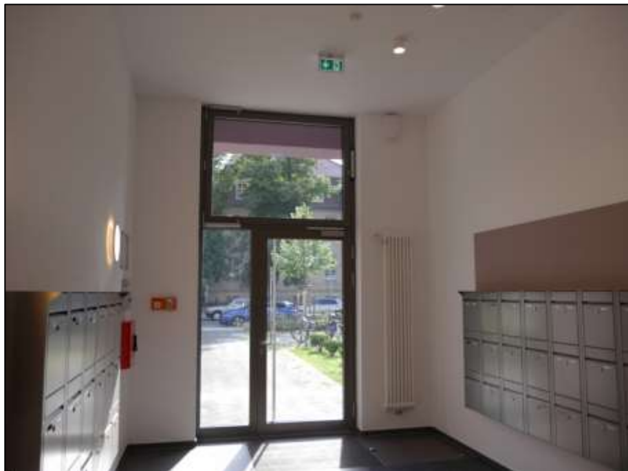
Hauseingangstür im Bereich des Aufzugsfoyers