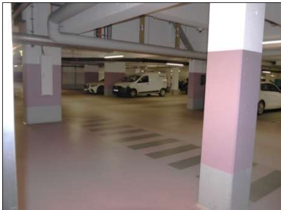
Blick aus dem Aufzugsfoyer vor der Tiefgarage in die auf dem Grundstück belegene Tiefgarage