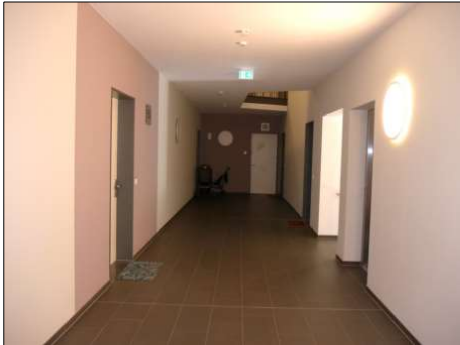
Hochparterre-Zentralflur als Atrium-Erschließung mit Zugang aus dem Aufzugsfoyer sowie Aufzugszugang recht im Bild - im Hintergrund Zugang zum innenliegenden Treppenhaus