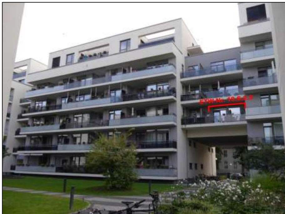
rückwärtige Front des Gebäudes Heubnerweg 9 (Haus 10) mit Lage des Wohnungseigentums Nr. 10.S.2.5 im 2.OG respektive in der unteren Ebene des sogen. „Verbindungsbaus“