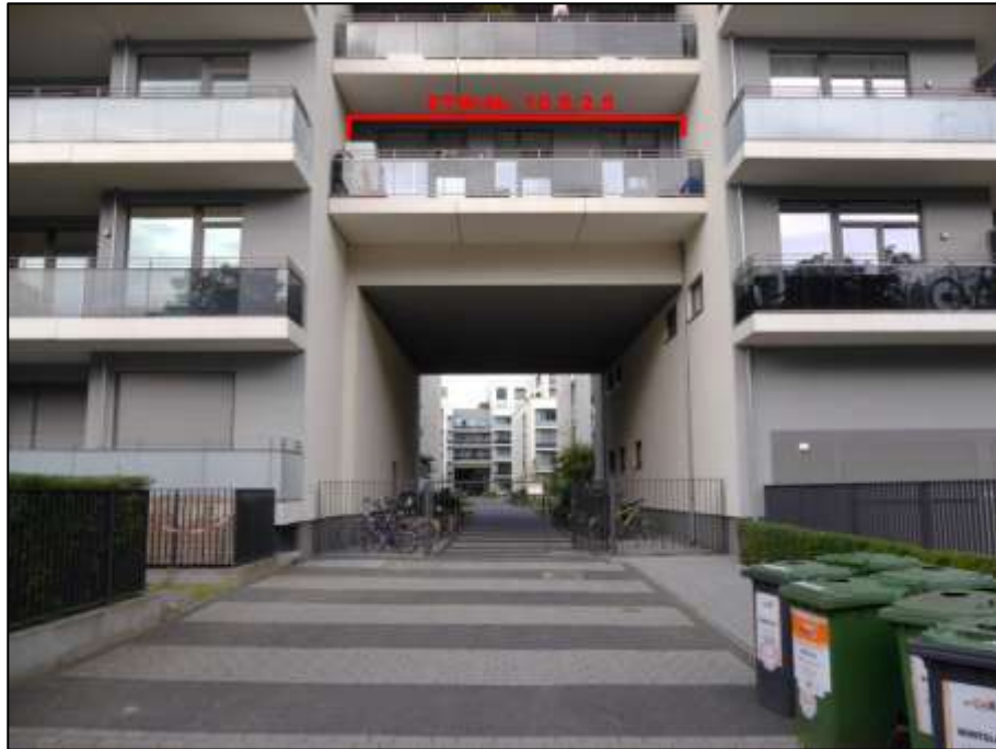
Blick aus dem öffentlichen Straßenraum auf den Gebäudedurchgang mit sogen. „Verbindungsbau“ und darin im 2.OG des Gebäudes Heubnerweg 9 (Haus 10) als unteren Ebene belegtem Wohnungseigentum Nr. 10.S.2.5