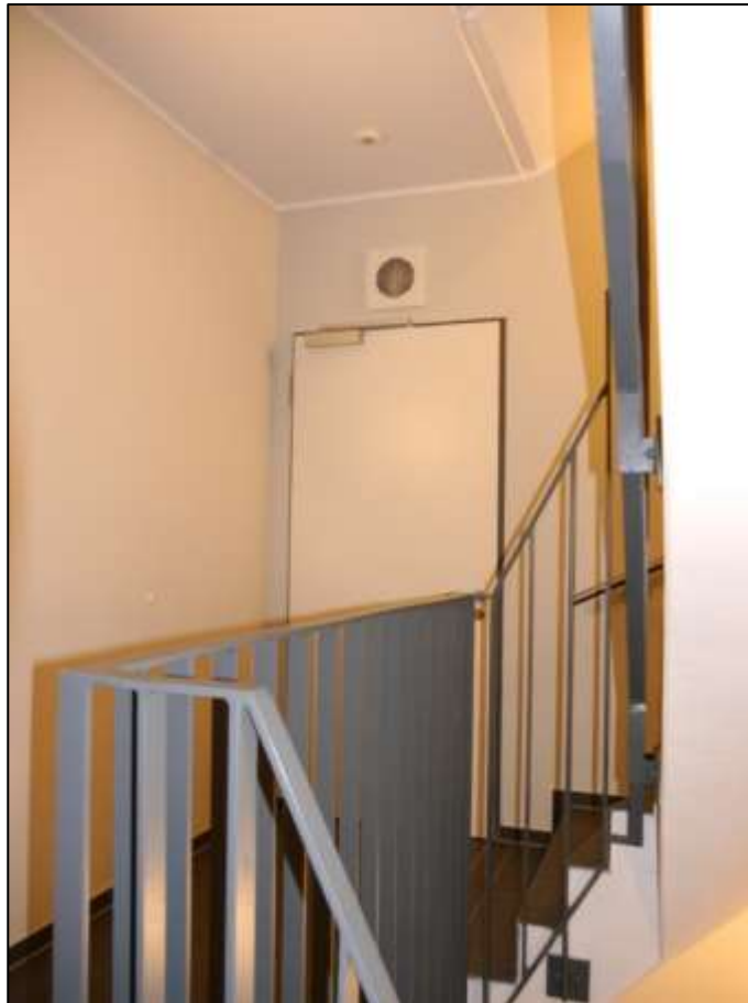
innenliegendes Treppenhaus mit Zugang zum Zentralflur im 2. Oberge- schoss