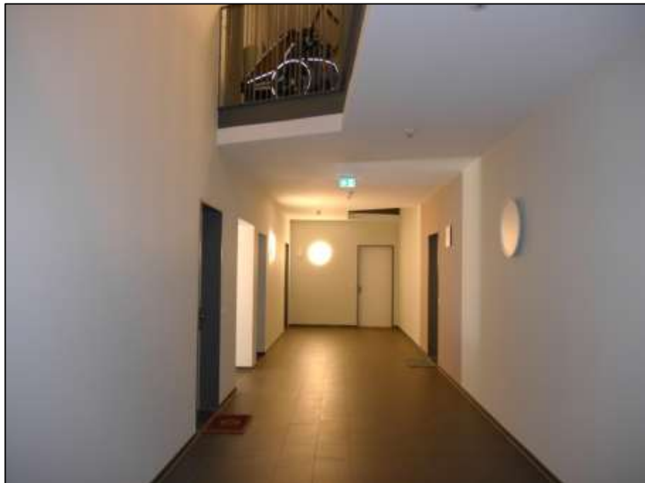
Hochparterre-Zentralflur als Atrium-Erschließung mit Zugang aus dem Aufzugsfoyer sowie Aufzugszugang links im Bild