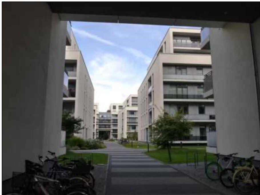
Blick aus dem Gebäudedurchgang unterhalb des sogen. „Verbindungsbaus“ in den rückwärtigen Wohnblock u.a. mit auf dem hier betroffenen Grundstück aufstehenden Haus 15 mit der Anschrift Heubnerweg 9A rechts im Bild