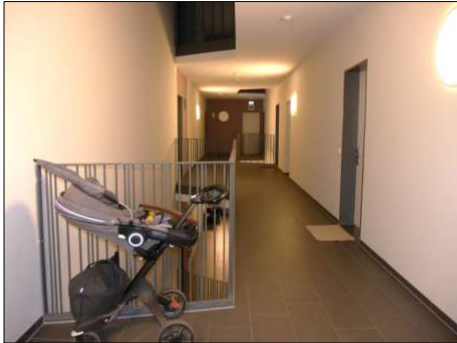
Zentralflur im 2. Obergeschoss mit Blick aus dem Bereich der Eingangstür des Wohnungseigentums Nr. 10.S.2.5 auf die gegenüberliegende Stirnseite des Zentralflurs mit dort anbindendem innenliegendem Treppenhaus