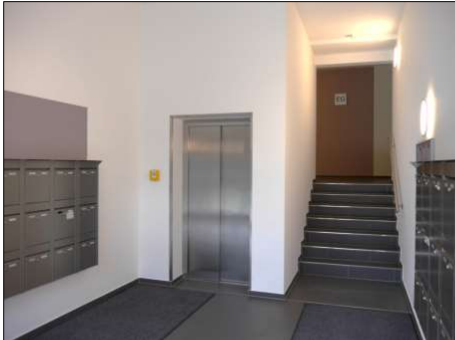
Hauseingang im Bereich des Aufzugsfoyers mit anbindender Differenzterasse zum Hochparterre-Zentralflur als Atrium-Erschließung