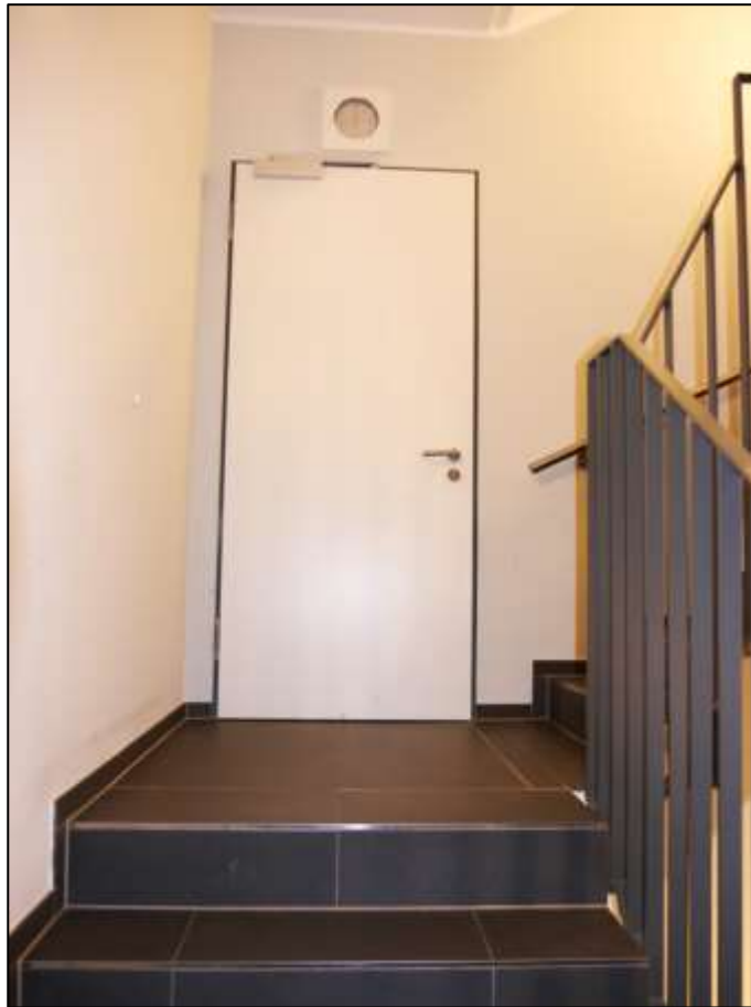
innenliegendes Treppenhaus mit Zugang zum Zentralflur im Hochparter- re