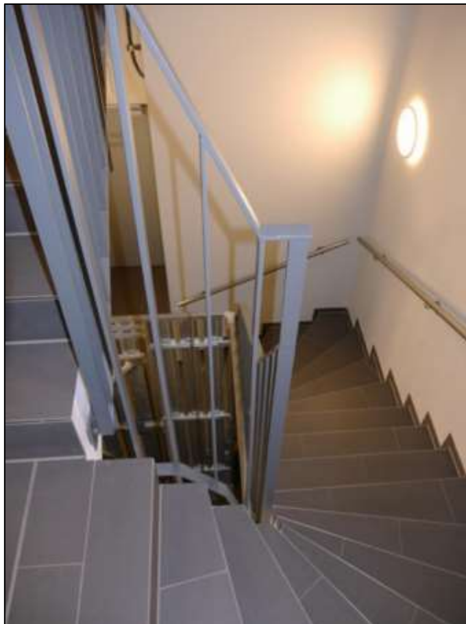
innenliegendes Treppenhaus mit Treppenabgang in das Kellergeschoss