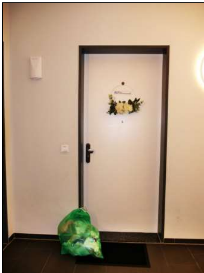
Eingangstür des Wohnungseigentums Nr. 10.S.2.5 im 2.OG des Gebäudes Heubnerweg 9 (Haus 10) an der rückwärtigen Stirnseite des Zentralflurs