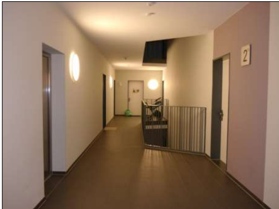
Zentralflur im 2. Obergeschoss und Lage des Wohnungseigentums Nr. 10.S.2.5 im Hintergrund an der rückwärtigen Stirnseite des Zentralflurs