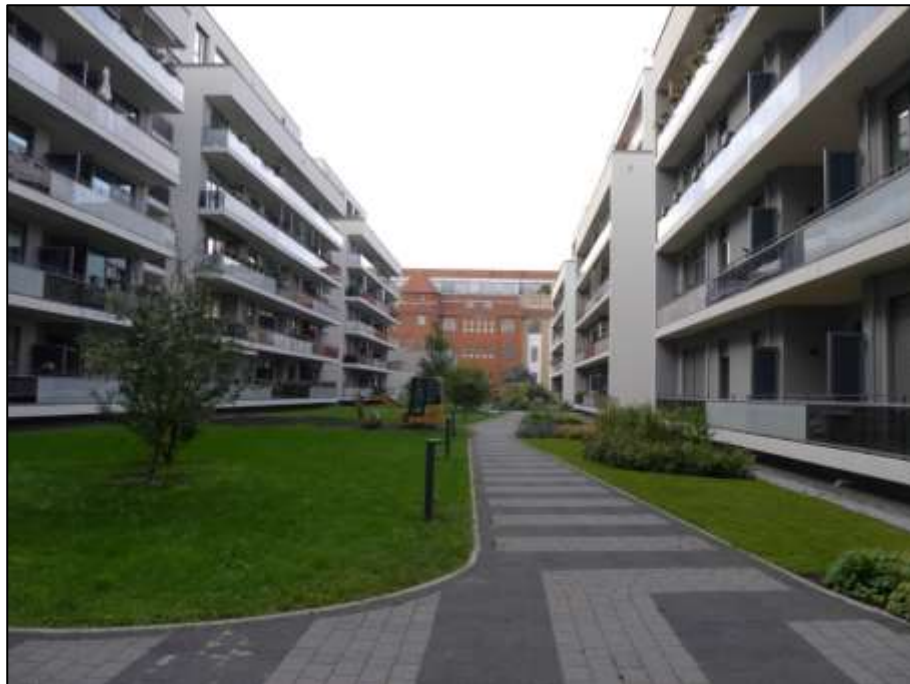
Blick in den Blockinnenbereich nach Süden mit Lage des straßenseitigen Gebäudes Heubnerweg 9 (Haus 10) links und rückwärtigem Gebäude Heubnerweg 9A (Haus 15) rechts im Bild