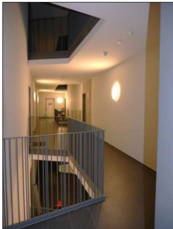
Zentralflur im 2. Obergeschoss mit Blick durch die Zugangstür aus dem innen- liegenden Trep- penhaus und Lage des Woh- nungseigen- tums Nr. 10.S.2.5 im Hin- tergrund an der rückwärtigen Stirnseite des Zentralflurs