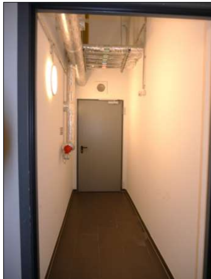
Kellerflur zum Aufzugsfoyer vor der Tiefga- rage