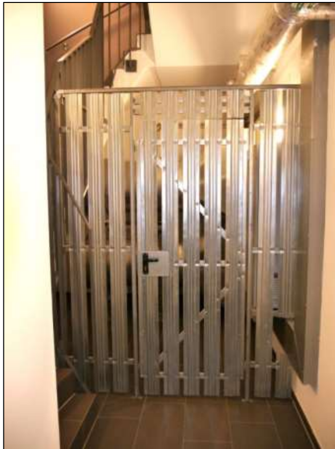
innenliegendes Treppenhaus mit Leichtmetall-Lamellen- verschlag als Abspannung einer technischen Gebäu- deausrüstung