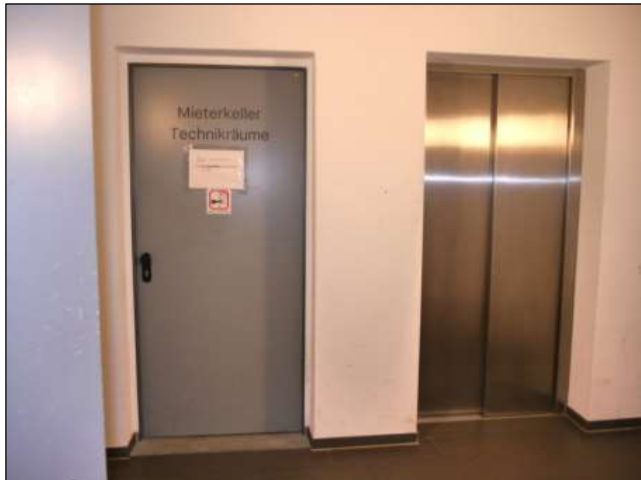
Aufzugsfoyer vor der Tiefgarage u.a. mit Zugang zu den Kellerabstellräumen vermtl. als Leichtmetall-Lamellenverschläge