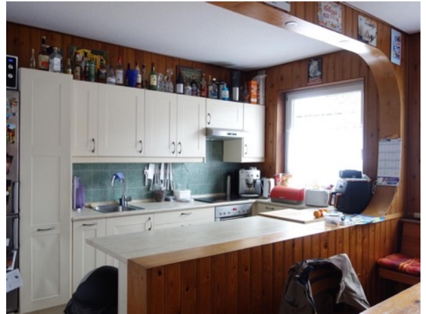
Abb. 33 EG EFH - Küche