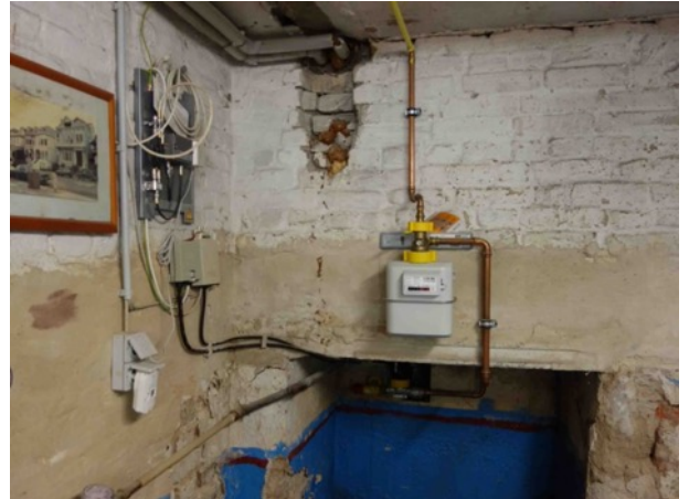
Abb. 21 KG EFH - Gasanschluss