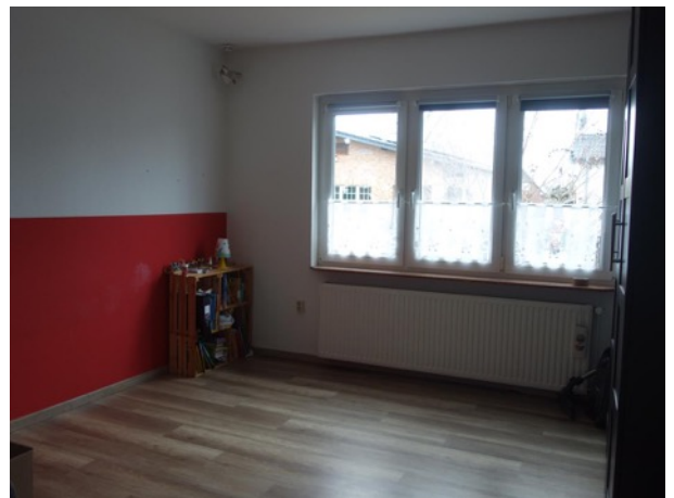
Abb. 35 EG EFH - Zimmer