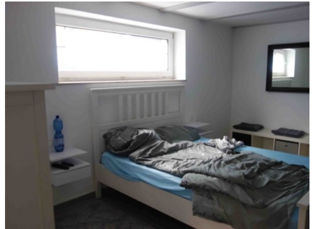
Abb. 27 KG EFH - ausgebauter Kellerraum