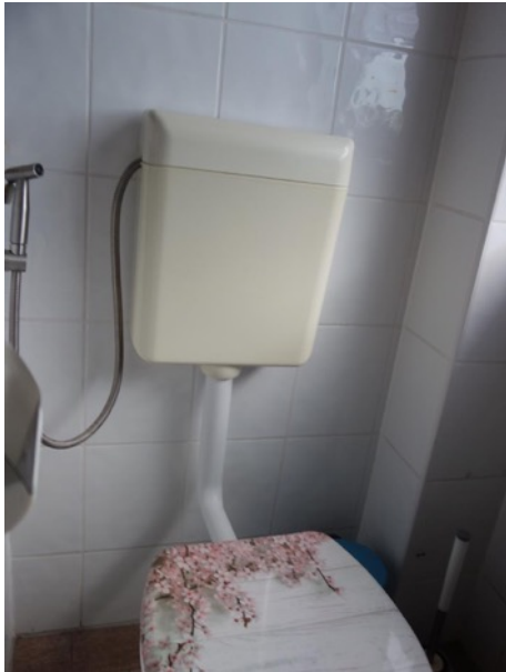
Abb. 32 EG EFH - Bad, Stand-WC