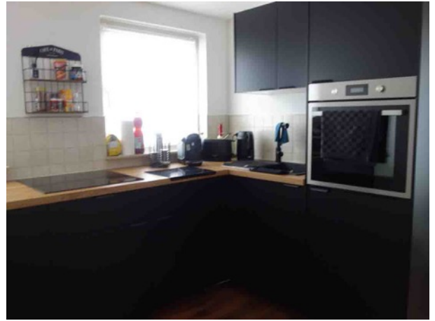
Abb. 45 DG EFH - Küche