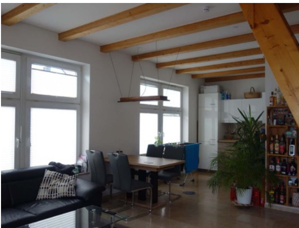
Abb. 46 Nebengebäude - Raum im EG