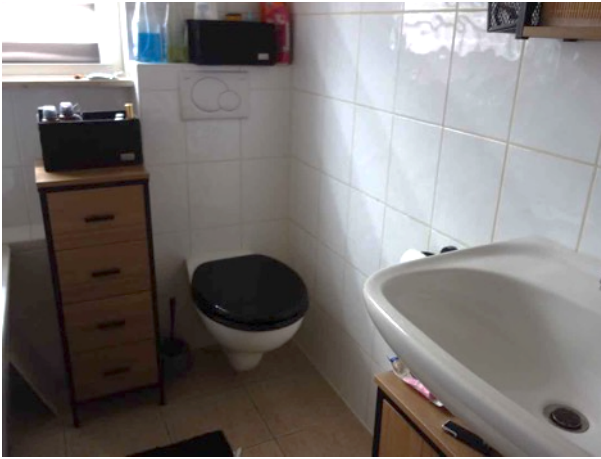
Abb. 44 DG EFH - Bad