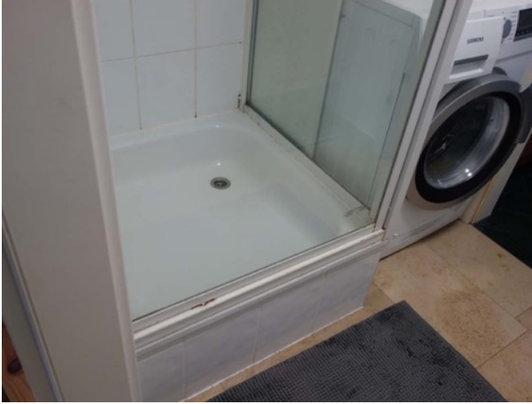
Abb. 50 Nebengebäude - Dusche