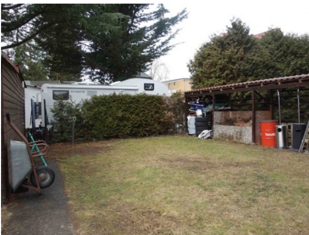
Abb. 54 Garten, rechts im Bild Unterstand