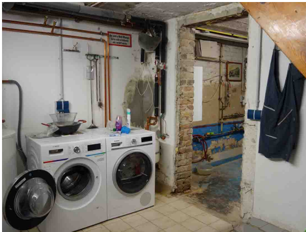
Abb. 28 KG EFH - Waschmaschinenstellplatz