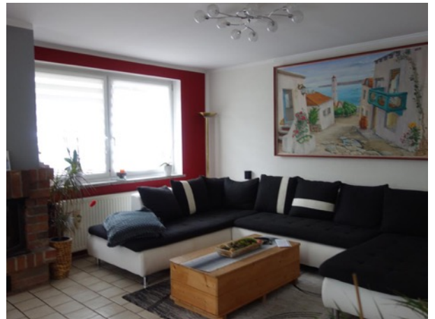
Abb. 29 EG EFH - Wohnraum (im Anbau)