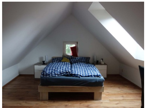
Abb. 49 Nebengebäude - ausgebauter Dachboden