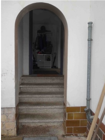
Abb. 20 Hauseingang Einfamilienhaus (EFH)