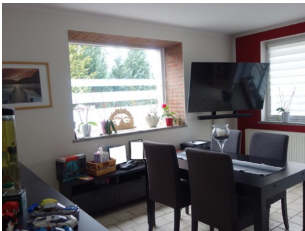
Abb. 30 EG EFH - Wohnraum (im Anbau)