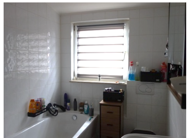
Abb. 43 DG EFH - Bad