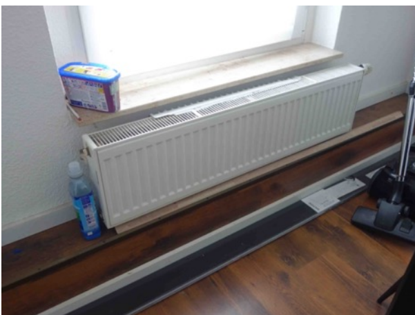
Abb. 42 DG EFH - Heizkörper