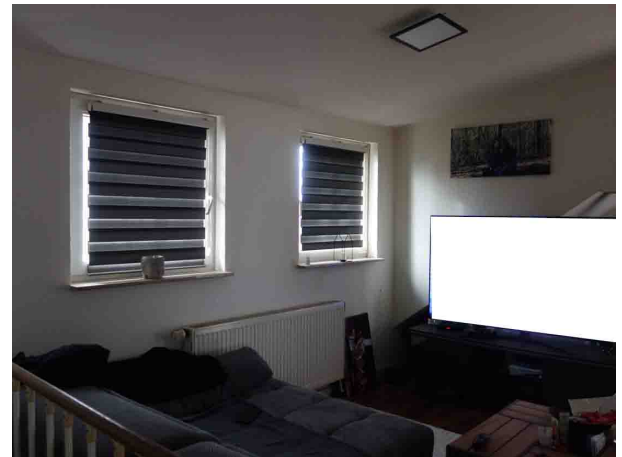
Abb. 41 DG EFH – Wohnraum