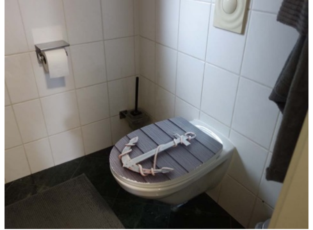
Abb. 51 Nebengebäude - WC