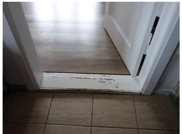
Abb. 37 EG EFH - exemplarische Schwelle