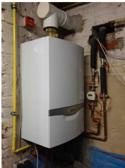
Abb. 24 KG EFH - Gastherme