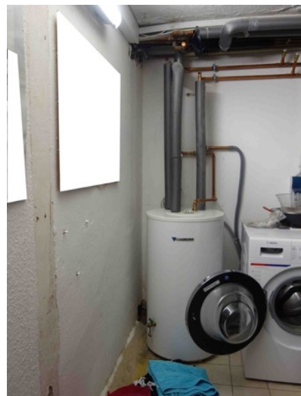
Abb. 25 KG EFH - WW-Speicher