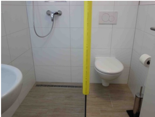
Abb. 26 KG EFH - Duschbad