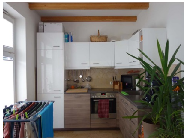
Abb. 47 Nebengebäude - Küche im EG