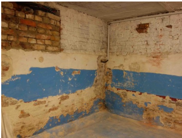
Abb. 22 KG EFH - Kellerraum