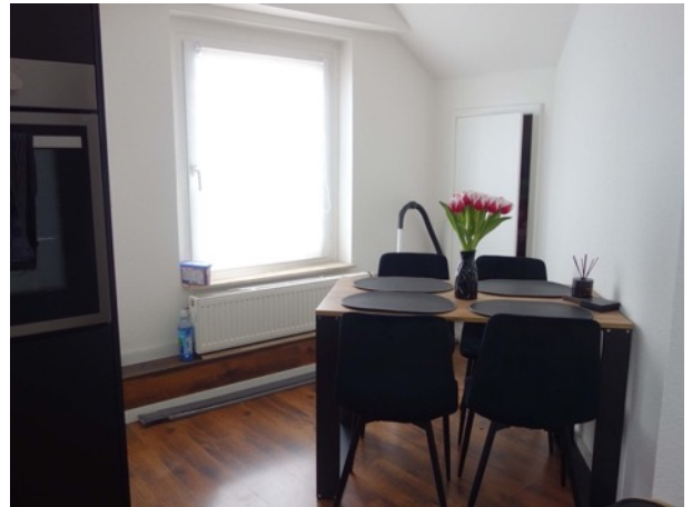
Abb. 39 DG EFH – Küche