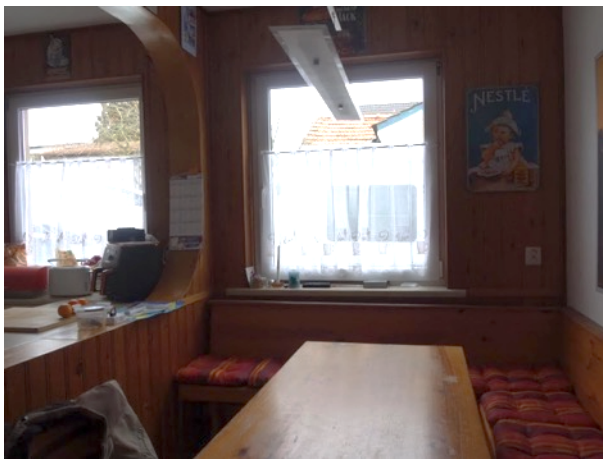
Abb. 34 EG EFH - Essplatz