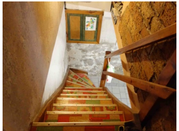
Abb. 23 Kellertreppe