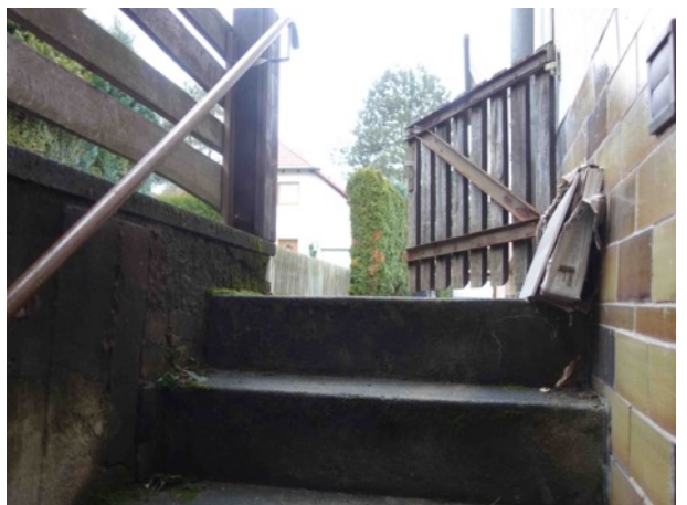
Abb. 55 Kelleraußentreppe