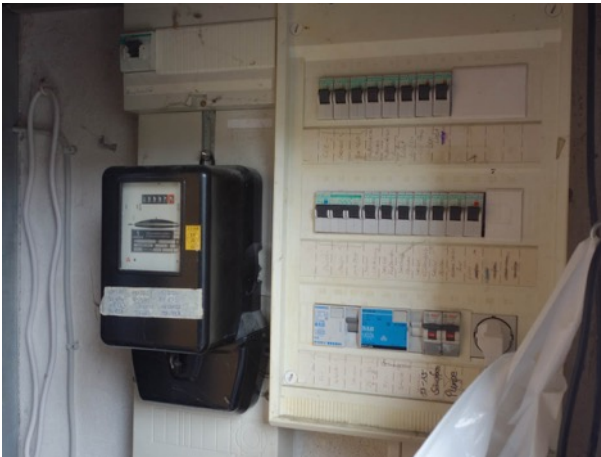
Abb. 52 veraltete Sicherungstechnik