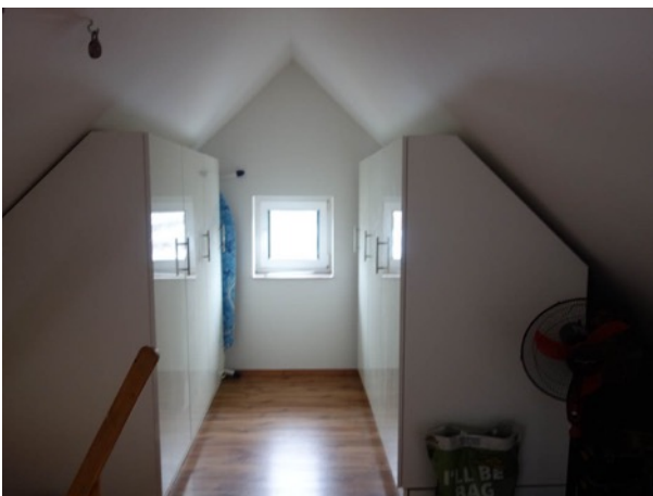
Abb. 48 Nebengebäude - ausgebauter Dachboden