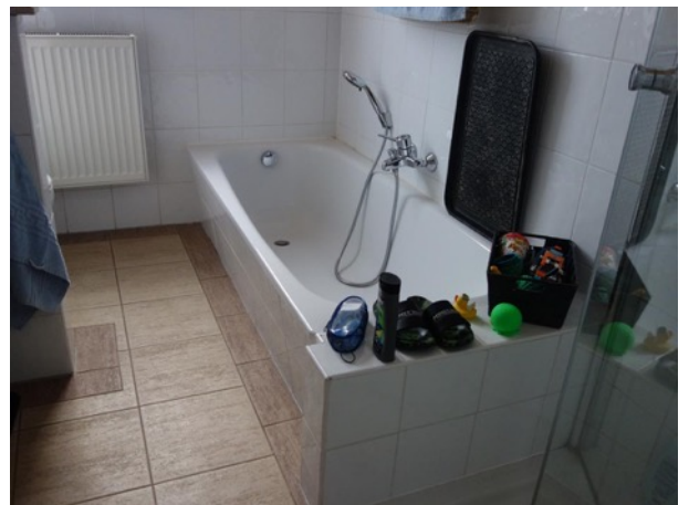
Abb. 31 EG EFH - Bad