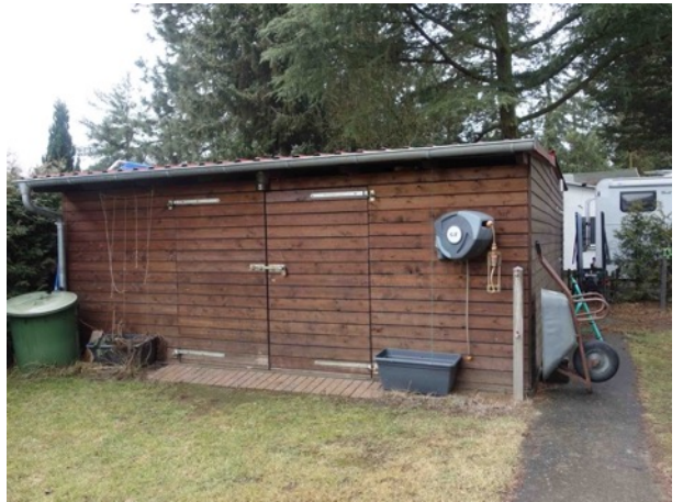
Abb. 53 Schuppen