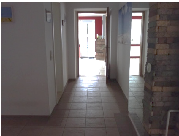
Abb. 36 EG EFH - Flur