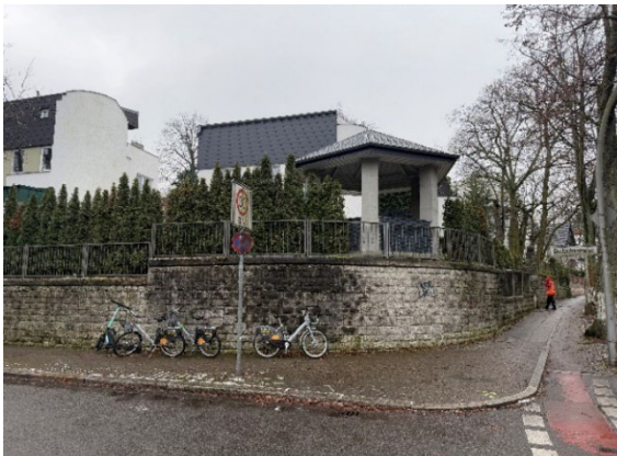
straßenseitige Grundstücksansicht Delbrückstr./Koenigsallee