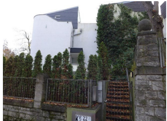
Koenigsallee 22 (Haus C)