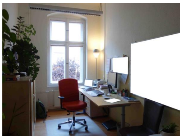
Abb. 25 Zimmer (straßenseitig)