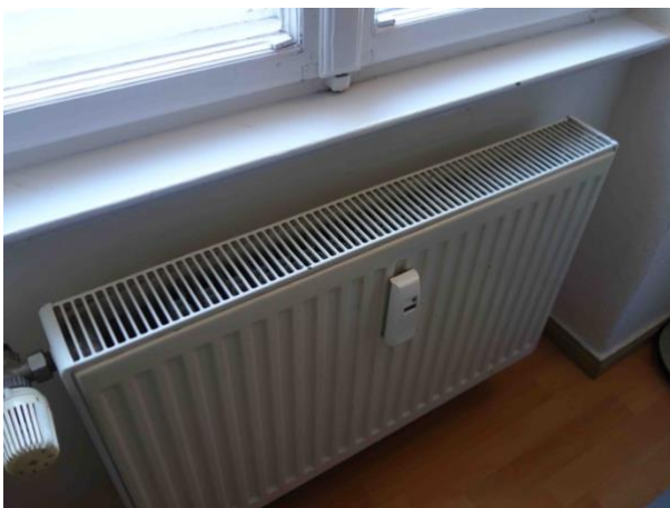
Abb. 32 exemplarischer Heizkörper