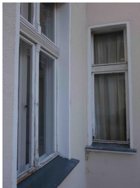
Abb. 19 Fassade und Fenster am Balkon zu WE 3