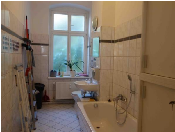
Abb. 28 Badezimmer