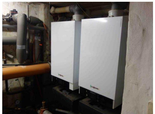
Abb. 33 Kessel Heizung im KG (2 Stk.)