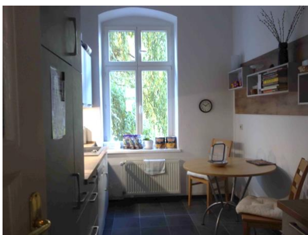
Abb. 26 Küche (hofseitig)