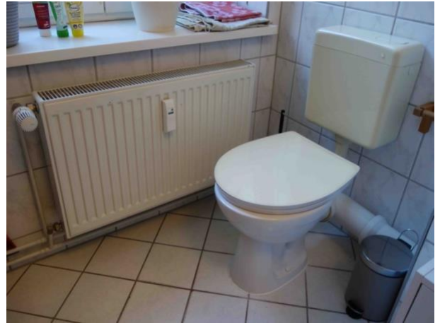
Abb. 29 Stand-WC im Badezimmer