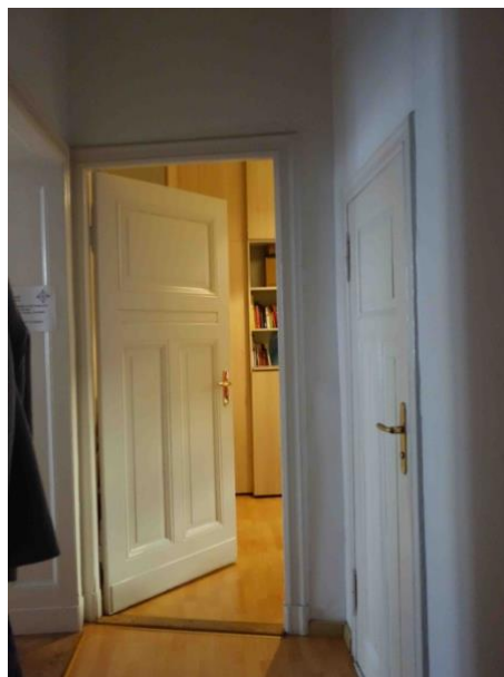
Abb. 23 Wohnungsflur WE 3 mit alten Türen