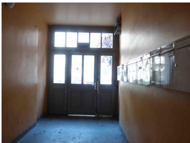
Abb. 16 Durchgang Vorderhaus