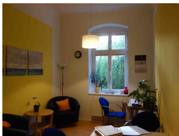
Abb. 27 Zimmer (hofseitig)