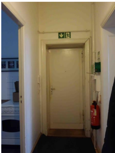
Abb. 22 Wohnungsflur WE 3