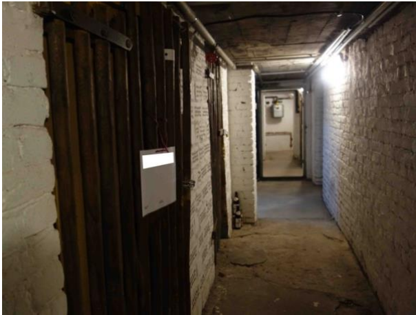
Abb. 34 Keller Vorderhaus