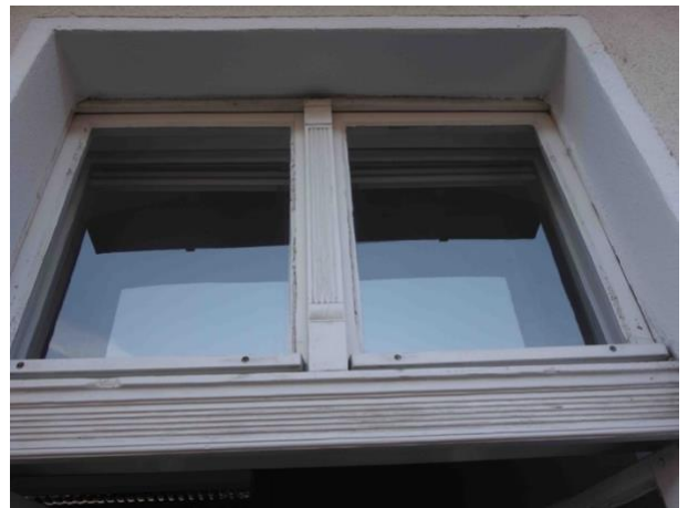
Abb. 31 Oberlicht Balkontür