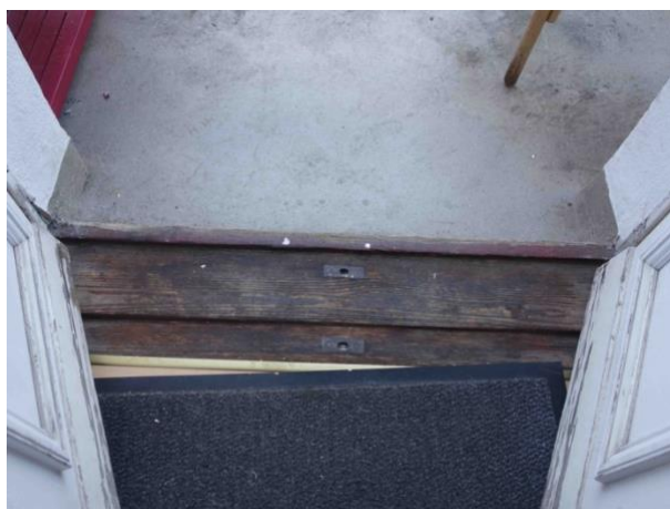
Abb. 21 Schwelle Wohnraum - Balkon