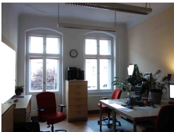
Abb. 24 Zimmer mit Balkon (straßenseitig)