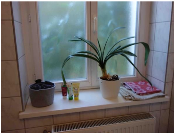
Abb. 30 Fenster hofseitig