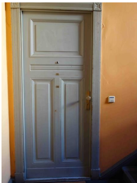
Abb. 18 Wohnungseingangstür WE 3