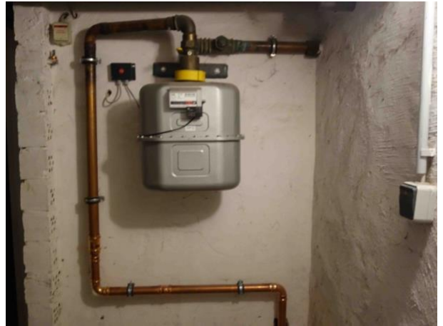
Abb. 35 Gasanschluss