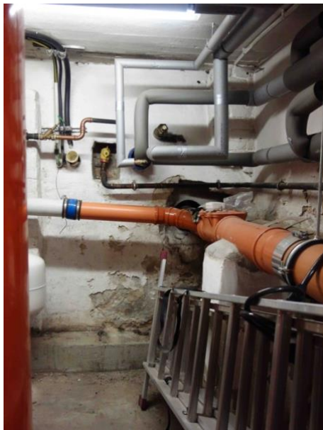
Abb. 36 Hausanschlüsse