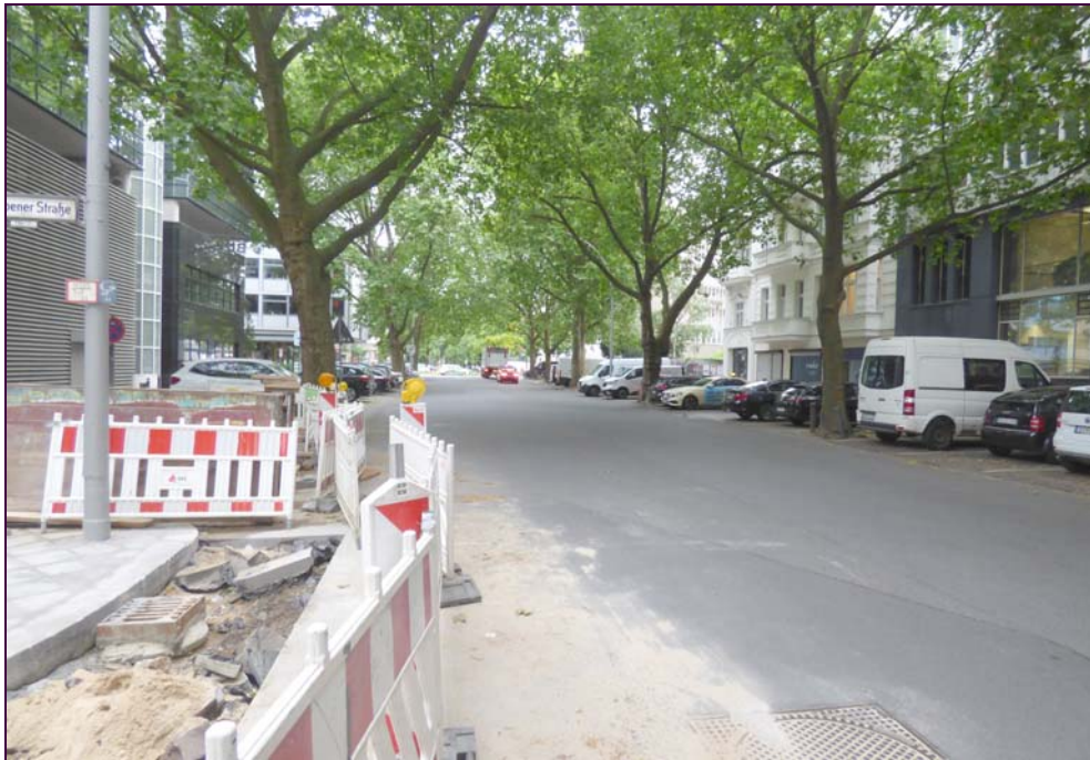
Rankestraße im Objektbereich