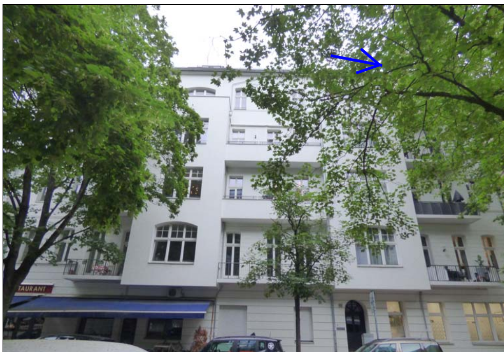
Gebäudeteil Eislebener Straße 10 mit der betreffenden Wohnung Nr. 26