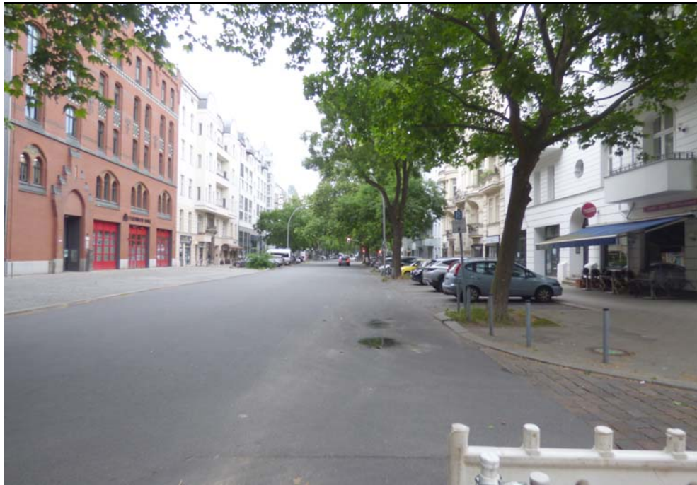
Rankestraße im Objektbereich