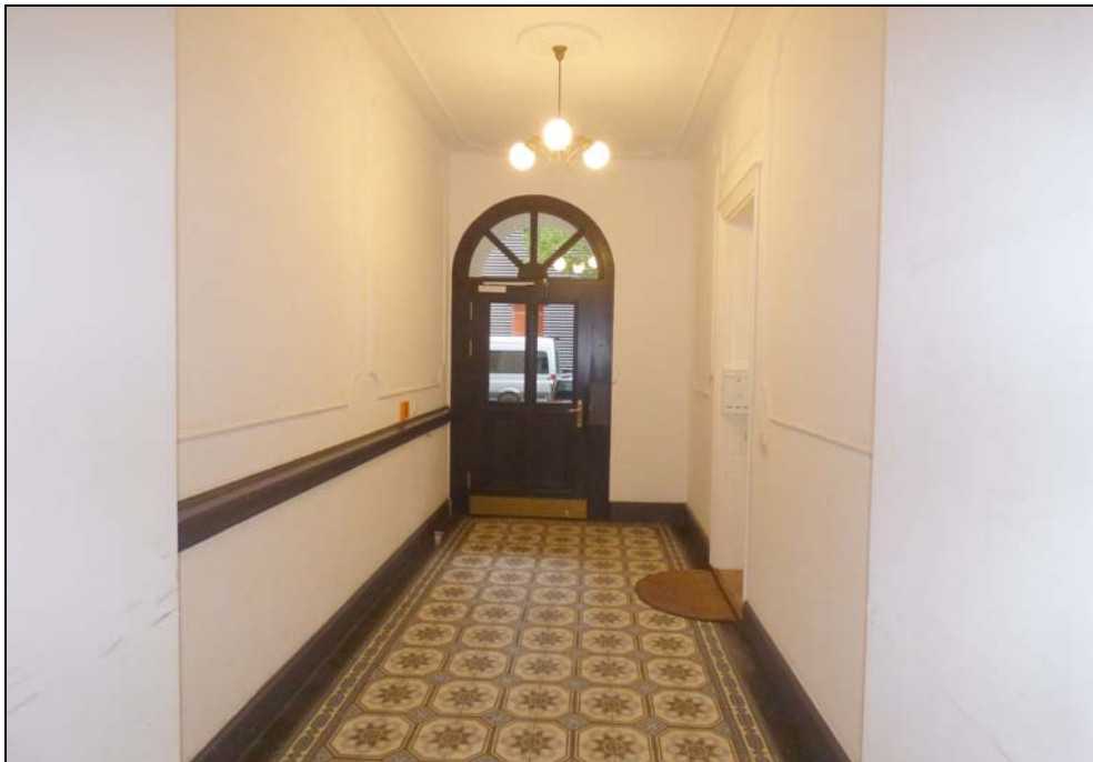
Hauseingang Eislebener Straße 10