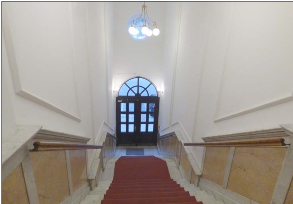
Hauseingang Rankestraße 23