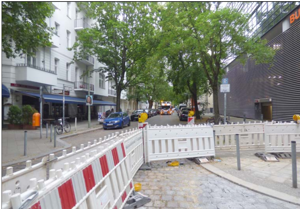
Blick in die Eislebener Straße