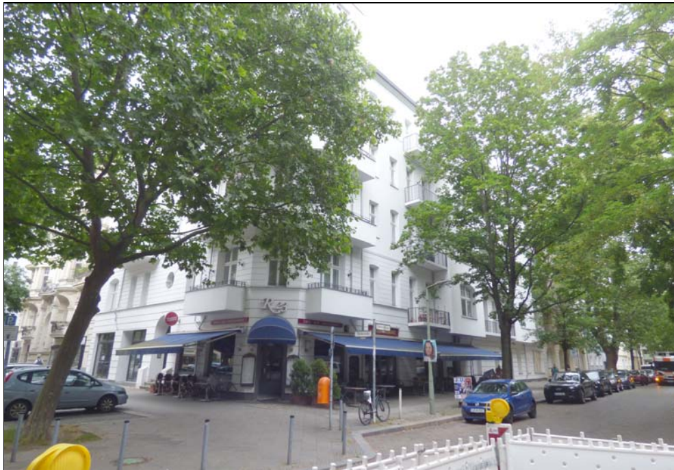
Straßenseitige Gebäudeansicht Ecksituation