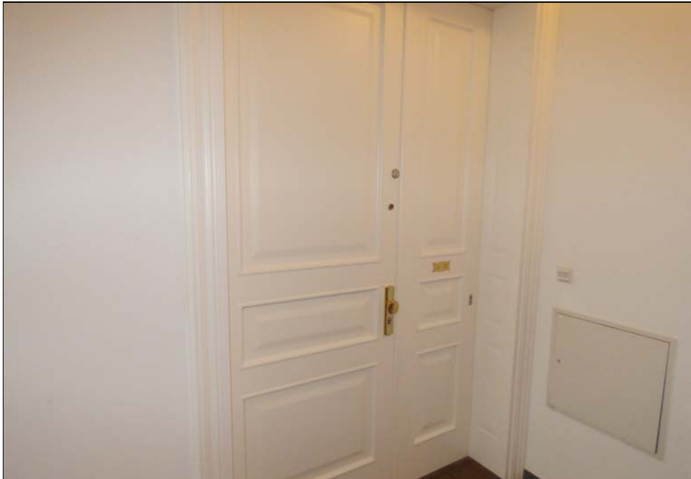
Wohnungszugang von der Rankestraße 23