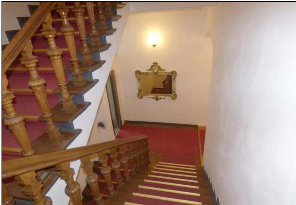
Treppenhaus Rankestraße 23