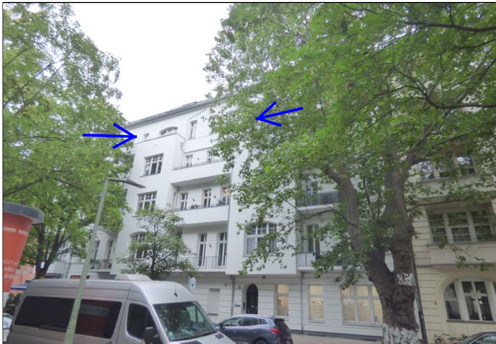
Gebäudeteil Eislebener Straße 10 mit der betreffenden Wohnung Nr. 23