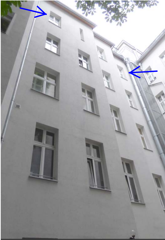
rückwärtige Gebäudeansicht mit der betreffenden Wohnung Nr. 23