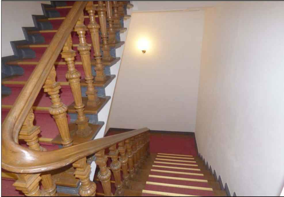
Treppenhaus Rankestraße 23