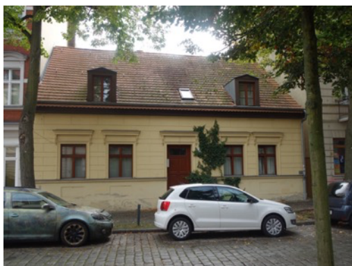
Ansicht von der Straße Kietz