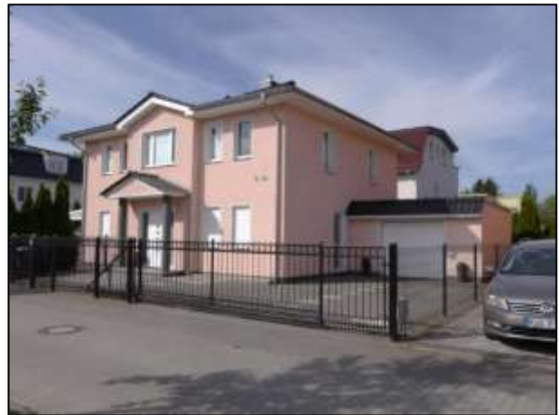
Einfamilienhaus a.d. Grdst. Seeadlerweg 68