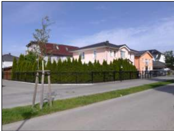
Eckgrundstück Seeadlerweg 68