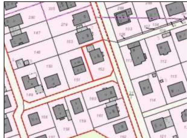
Flurkarte (Grundstück Seeadlerweg 68)