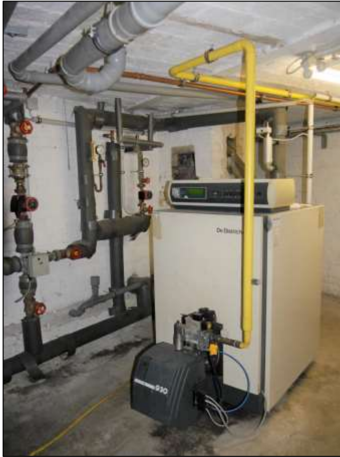
Heizzentrale im Kellergeschoss des Seitenflü- gels