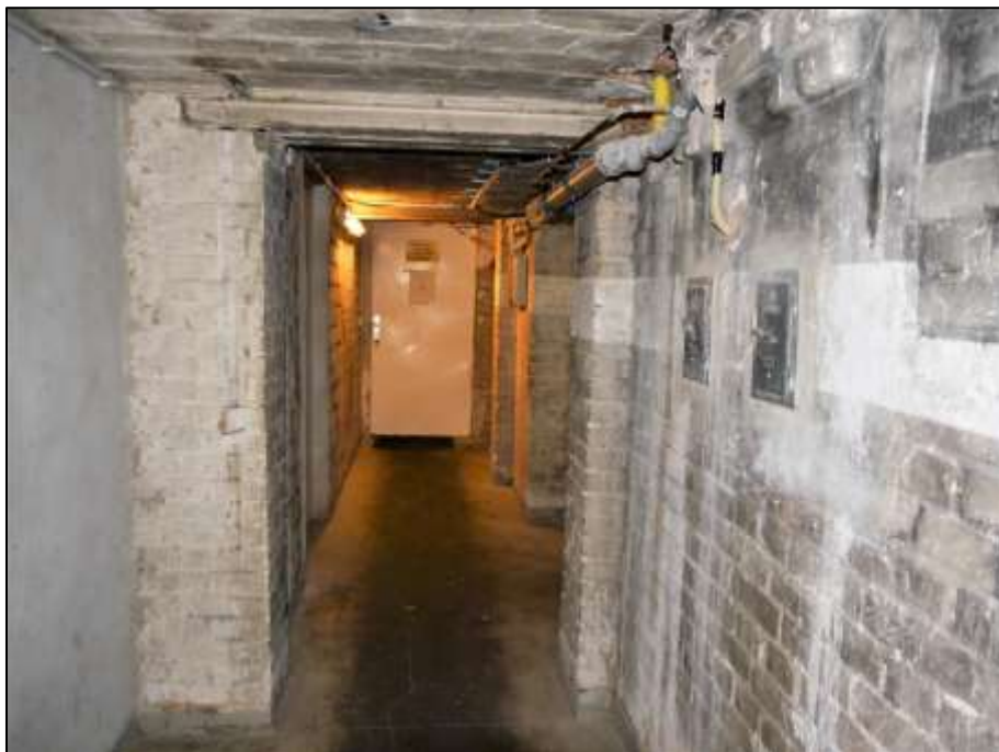
Kellerflur im Vorderhaus