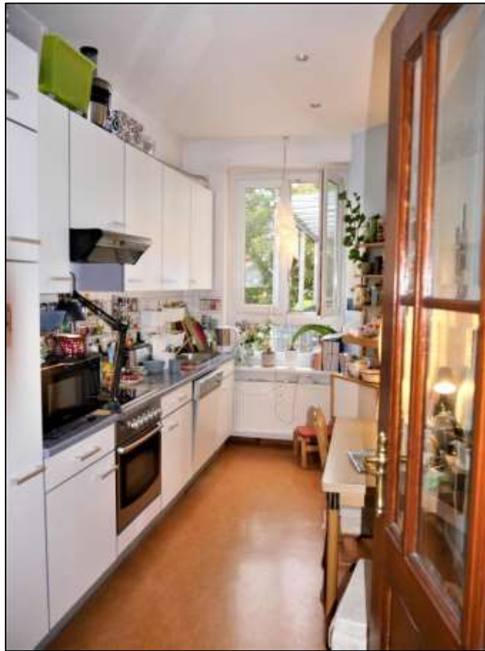
typische Küche im Vorderhaus