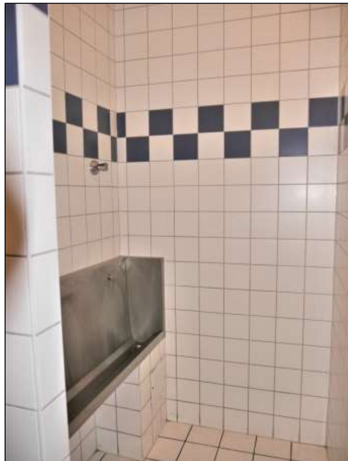
Sanitärbereich der im Erdge- schoss des Vorderhauses rechts belege- nen Gewerbe- einheit