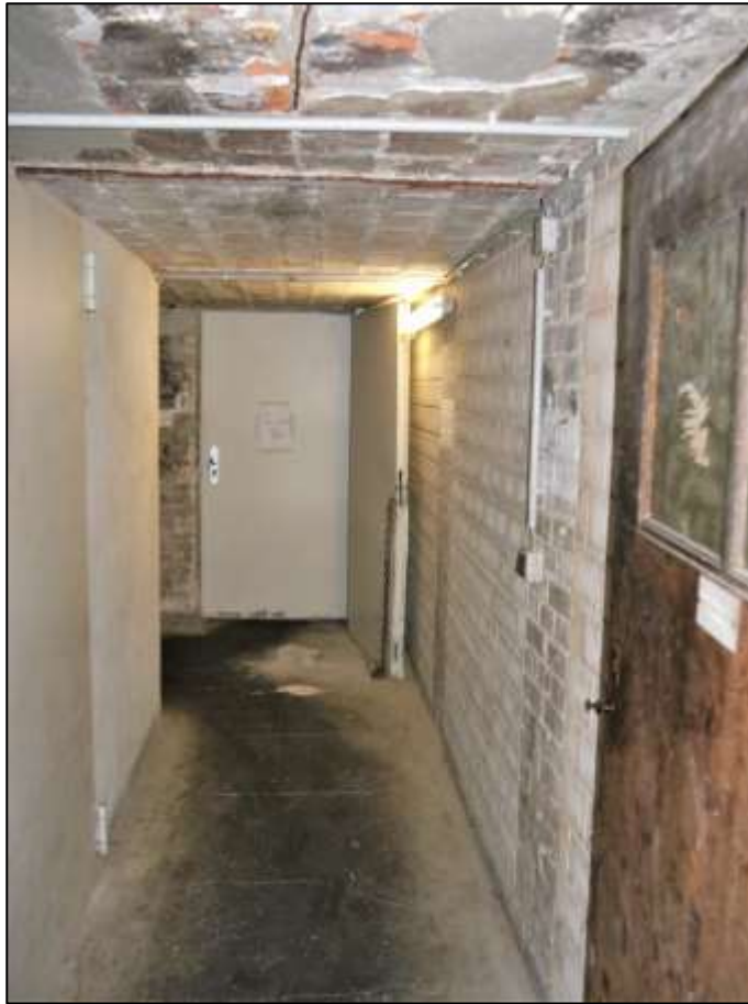
Blick durch die Eingangstür am Austritt der Kelleraußentreppe in den Kellerflur mit anbindendem Lagerraum der im Erdgeschoss im Vorderhaus links belegene Gewerbeeinheit