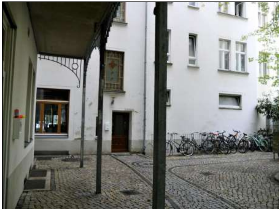
Blick über den Hof des Anwesens auf die hofseitige Front des Vorderhauses