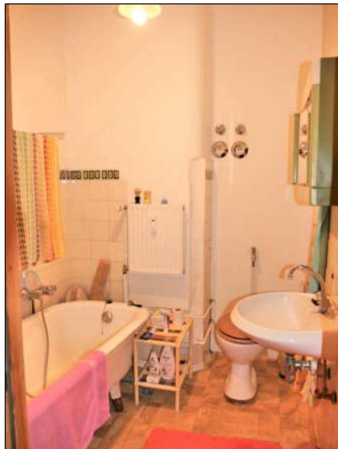
Badezimmer einer nur teil- modernisierten Wohnung im Vorderhaus