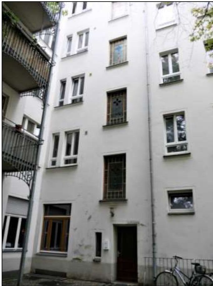
hofseitige Front des Vorderhau- ses

separater Fotosatz - Grundstück Plesser Straße 6 in 12435 Berlin-Alt Treptow (Bezirk Treptow-Köpenick)