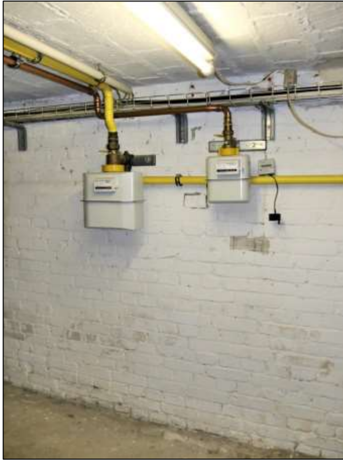
Gaszähler mit separatem Un- terzähler im Kellergeschoss für die im EG des Vorderhau- ses rechts be- legene Gewer- beeinheit