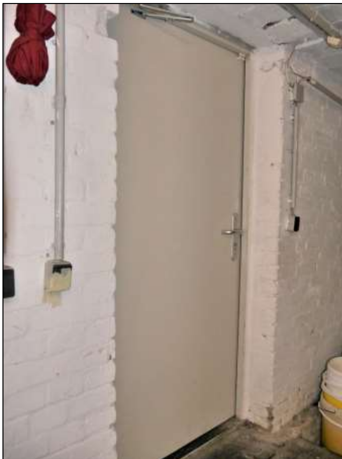
Zugang aus dem neutralen Kellerbereich in den Lagerraumbereich der im Erdgeschoss des Vorderhauses links belegenen Gewerbeeinheit