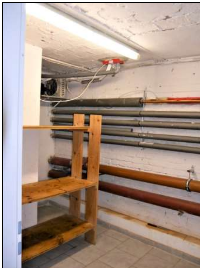
Lagerraumbereich mit Zugang aus der Kellerdiele der im Erdgeschoss des Vorderhauses links belegenen Gewerbeeinheit mit bauseitigem Klimagerät