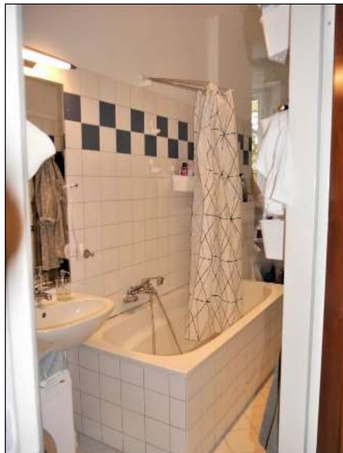
typisches Ba- dezimmer im Vorderhaus