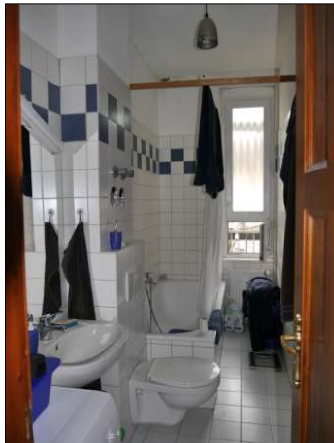
Badezimmer einer vollmodernisierten Wohnung im Seitenflügel