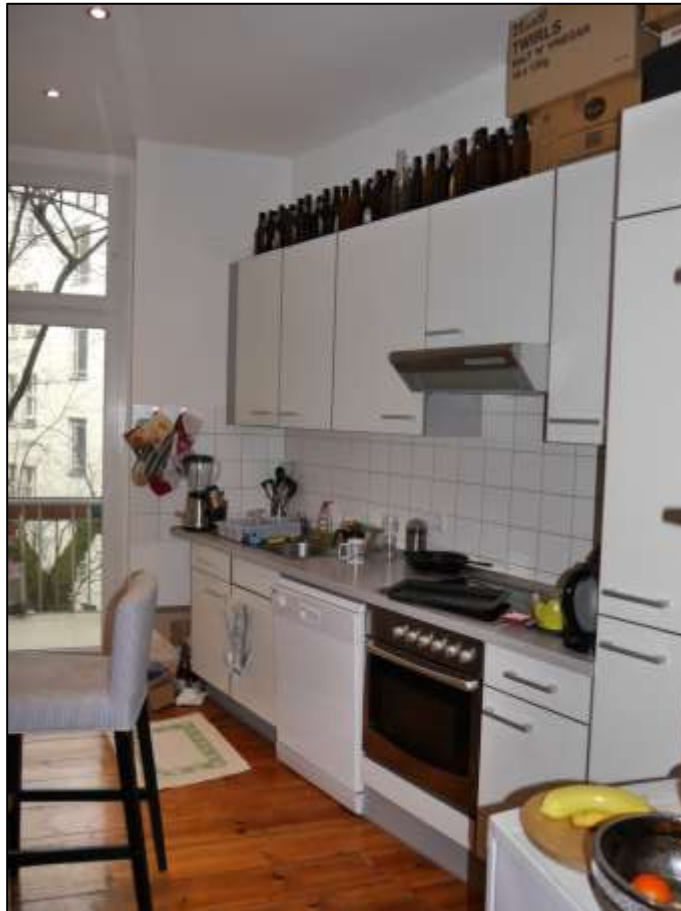
Küche einer vollmodernisier-ten Wohnung im Seitenflügel