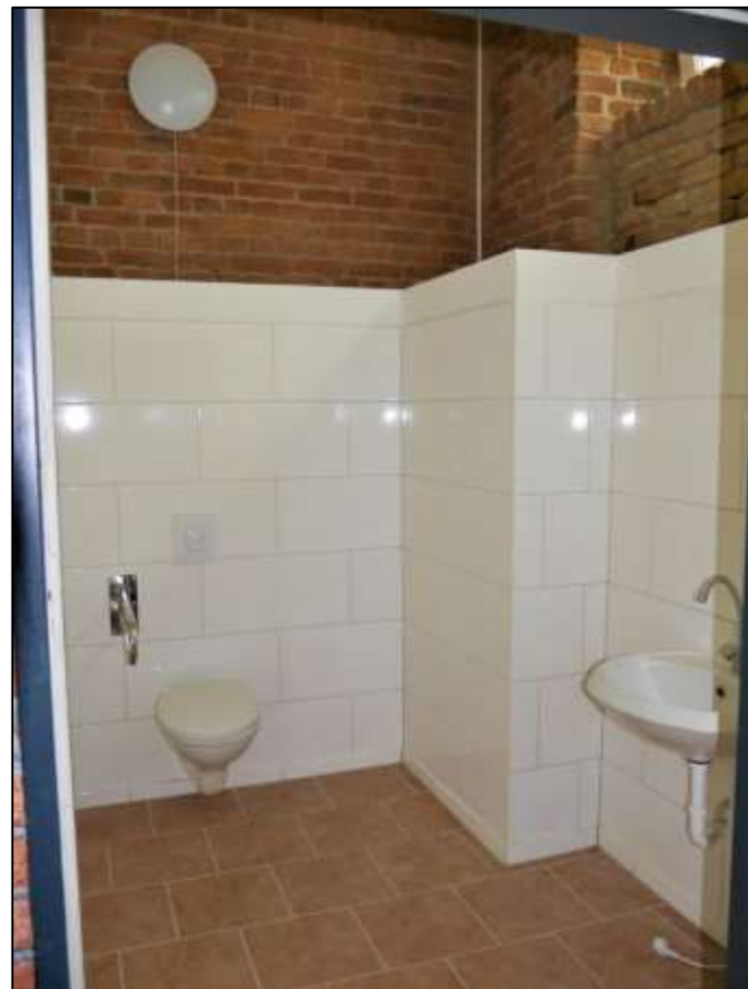
Schankraum der im Erdges- schoss des Vorderhauses links belegen Gewerbeeinheit mit projektierte Nutzung als Cocktail-Bar und hier barrie- refrei zugängli- cher und behin- dertengerecht ausgeführter Toilette