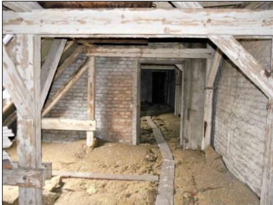
Rohdachboden im Vorderhaus