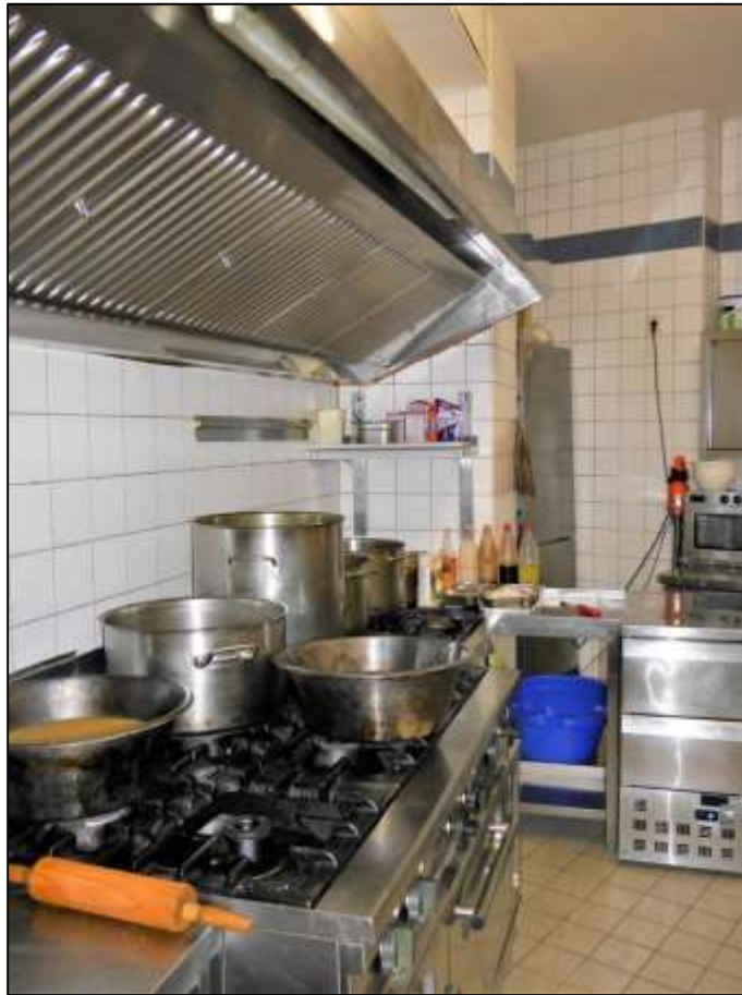
Küchenbereich der im Erdge- schoss des Vorderhauses rechts belege- nen Gewerbe- einheit