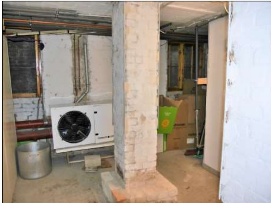
Lagerraumbereich mit Zugang aus der Kellerdiele der im Erdgeschoss des Vorderhauses links belegenen Gewerbeeinheit mit bauseitigem Klimagerät