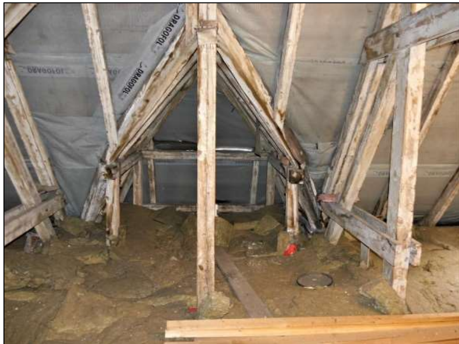
Rohdachboden im Vorderhaus im Bereich der straßenseitigen Gäube