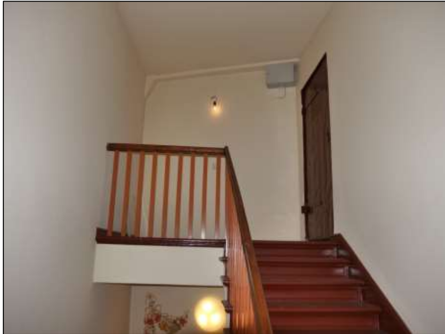
Treppenhauskopf im Seitenflügel