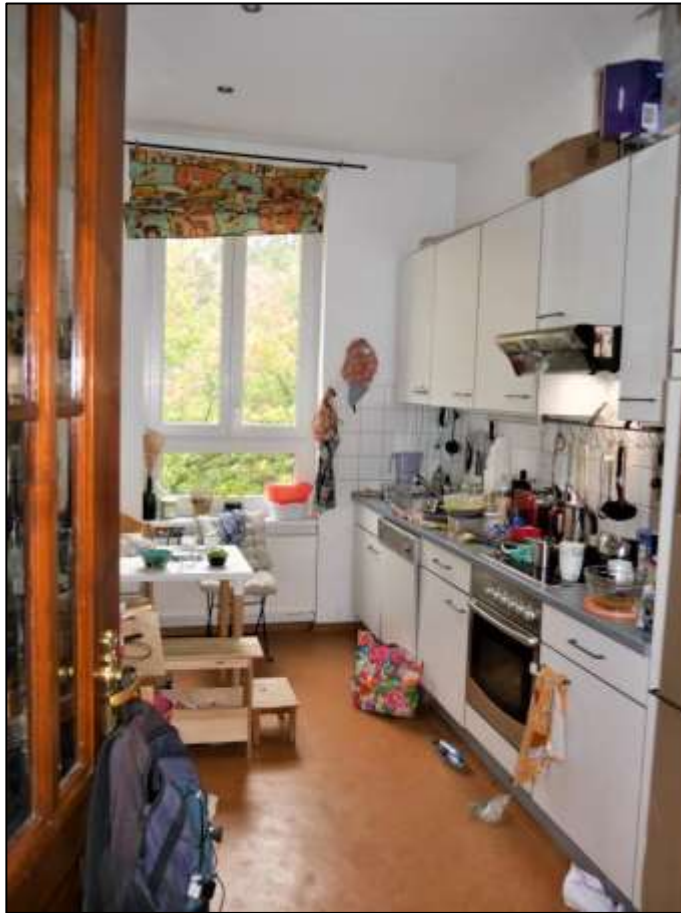
typische Küche im Vorderhaus