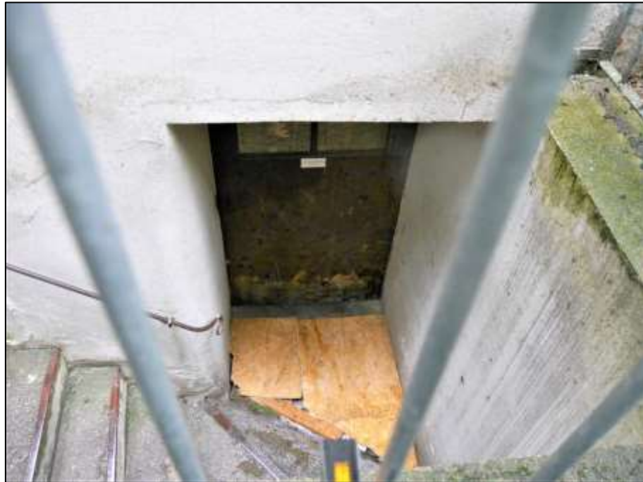
Austritt der Kelleraußentreppe vor der Zugangstür im Kellergeschoss des Vorderhauses