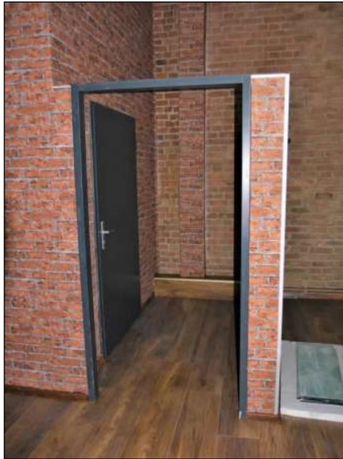
Schankraum der im Erdges- schoss des Vorderhauses links belegen Gewerbeeinheit mit projektierte Nutzung als Cocktail-Bar und abgespanntem Zugangs- bereich der bar- rierefrei zu- gänglichen und behindertenge- recht ausge- führten Toilette