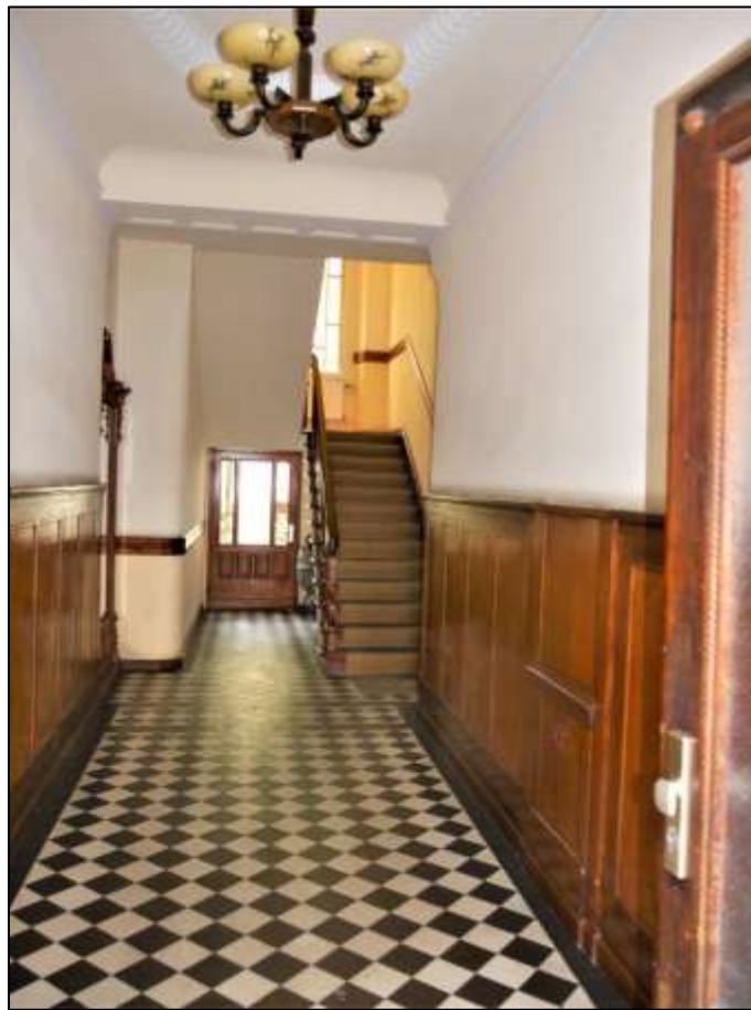
Hauseingangs- bereich des Vorderhauses