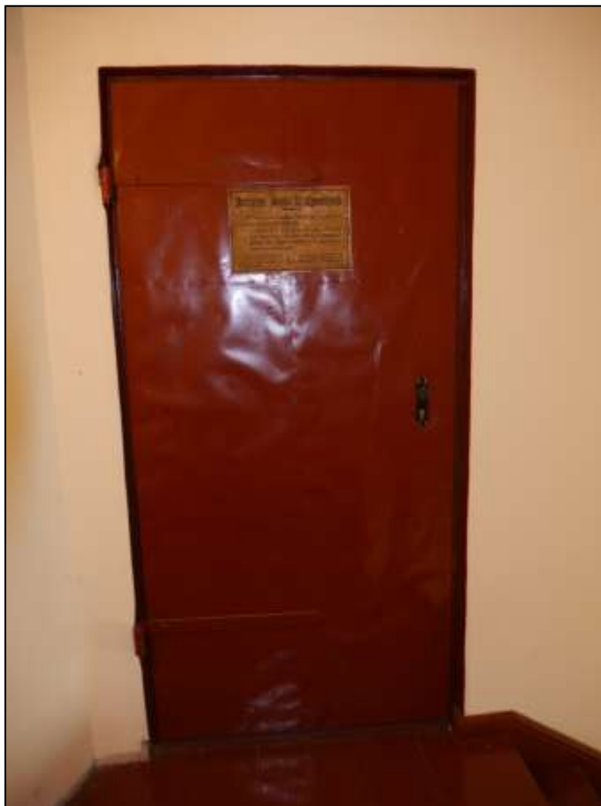
Türzugang zum Rohdachboden im Seitenflügel