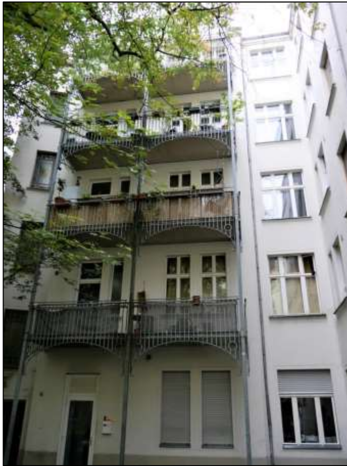
rechter Seitenflügel hinter dem Vorderhaus