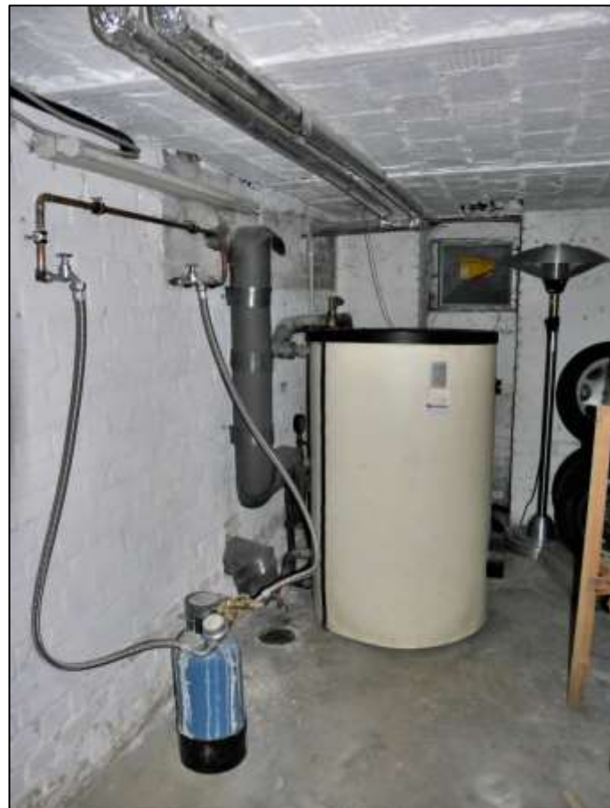
Heizzentrale im Kellergeschoss des Seitenflü- gels mit Warm- wasserspeicher