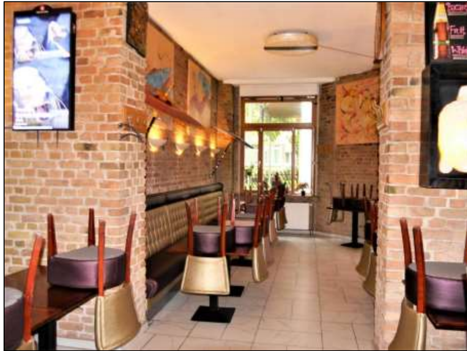
im Vorderhaus im EG belegene rechte Gewerbeeinheit