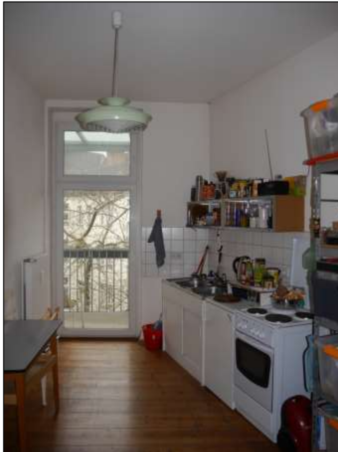
Küche einer vollmodernisierten Wohnung im Seitenflügel mit hier abweichend einfacher Küchenausstattung