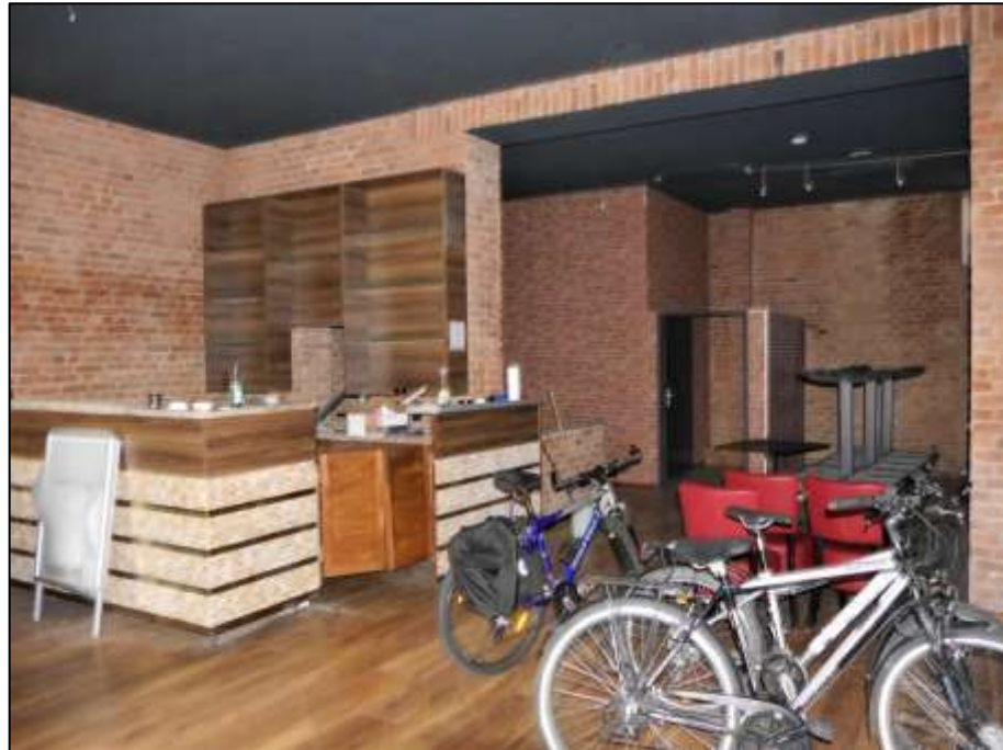
Schankraum mit Tresen der im Erdgeschoss des Vorderhauses links belegenen Gewerbeeinheit mit projektierte Nutzung als Cocktail-Bar