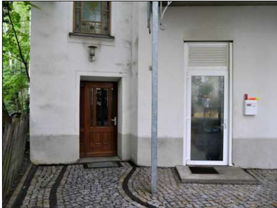
Treppenhauszugang des Seitenflügels aus dem Hof des Anwesens und daneben belegener separater Zugang der im Erdgeschoss postalisch rechts im Vorderhaus belegenen Gewerbeeinheit