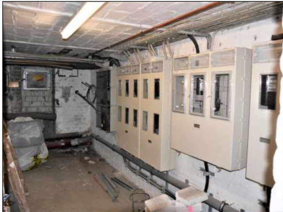
Hausanschlussraum im Kellergeschoss des Vorderhauses