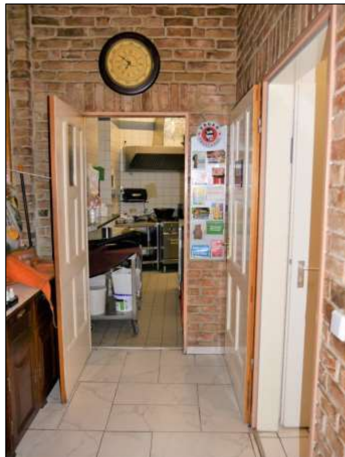
im Vorderhaus im EG belegene rechte Gewer- beeinheit mit Durchgang u.a. zu den Toiletten und der Küche