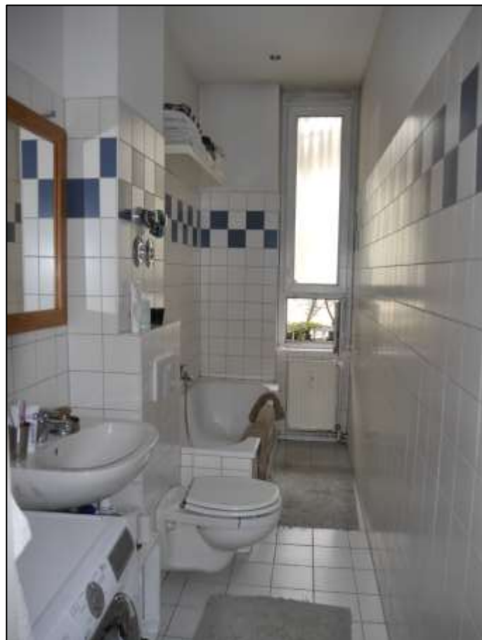
Badezimmer einer vollmo- dernisierten Wohnung im Seitenflügel