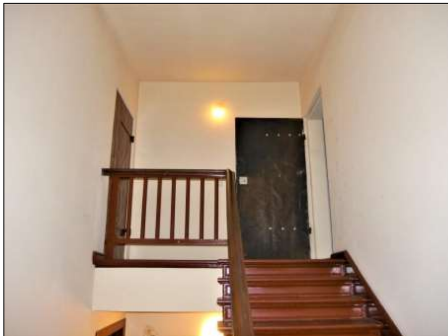
Treppenhauskopf im Vorderhaus