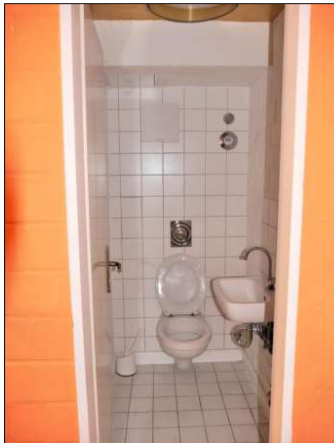
Blick aus der Kellerdiele der im Erdgeschoss des Vorderhauses links belegenen Gewerbeeinheit in einen anbindenden Toiletten-raum