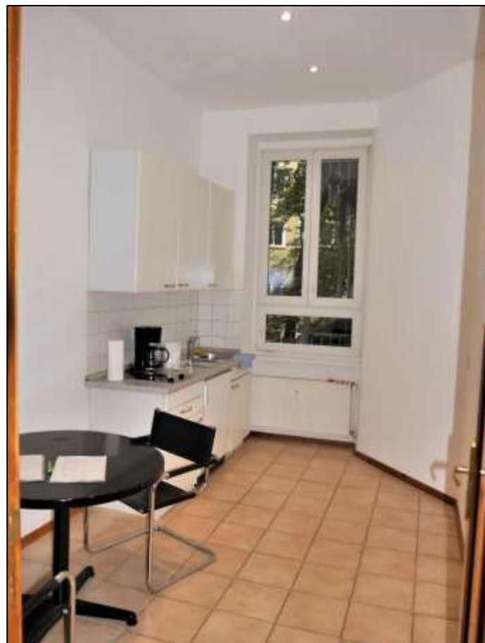
typische Küche im Vorderhaus