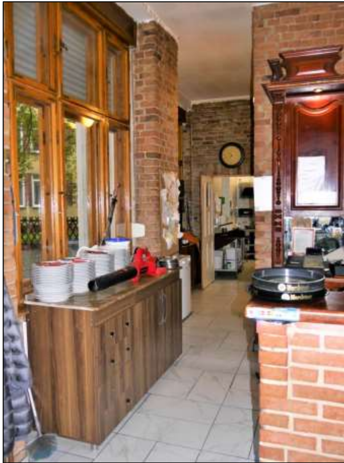
im Vorderhaus im EG belegene rechte Gewer- beeinheit mit Schanktresen rechts im Bild und Durchgang u.a. zu den Toi- letten und der Küche