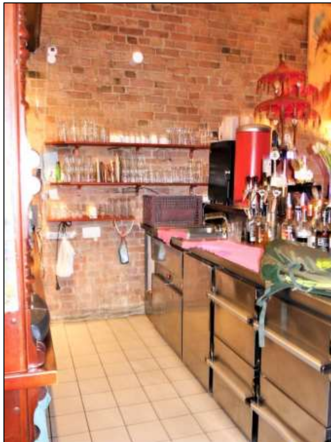
im Vorderhaus im EG belegene rechte Gewerbe- einheit mit Schanktresen