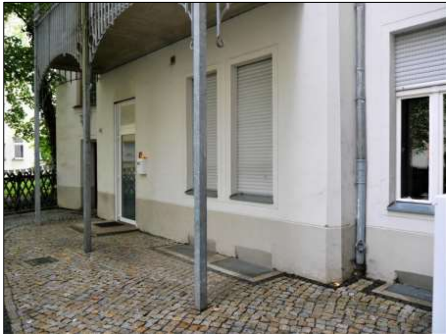
Erdgeschosszone des rechten Seitenflügels