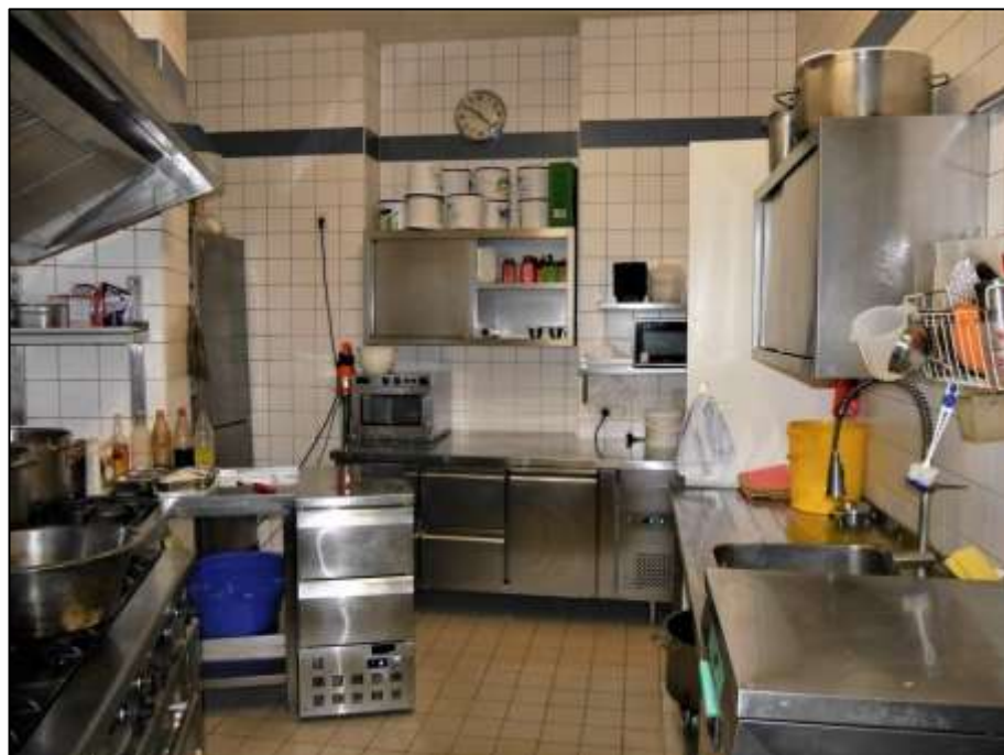
Küchenbereich der im Erdgeschoss des Vorderhauses rechts belege- nen Gewerbeeinheit