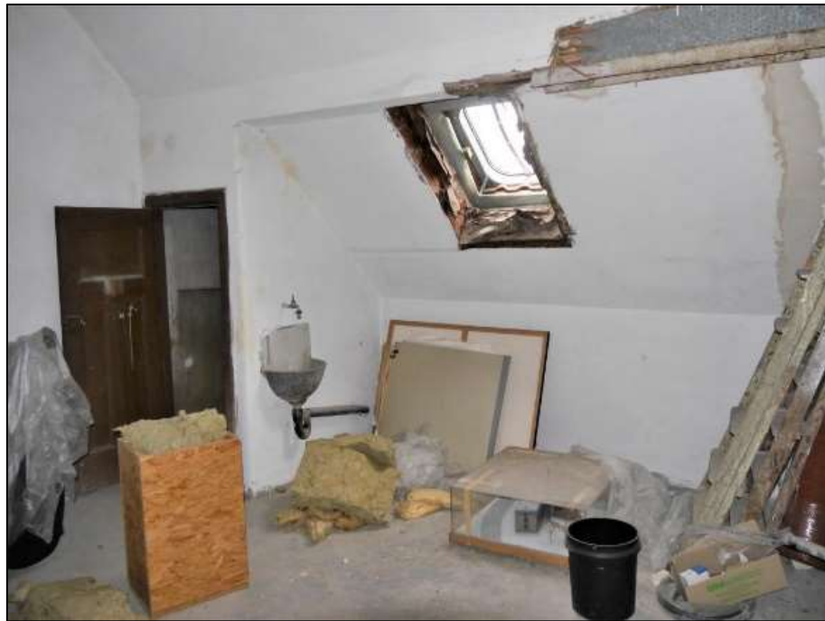
ehemalige Waschküche im Dachgeschoss des Vorderhauses