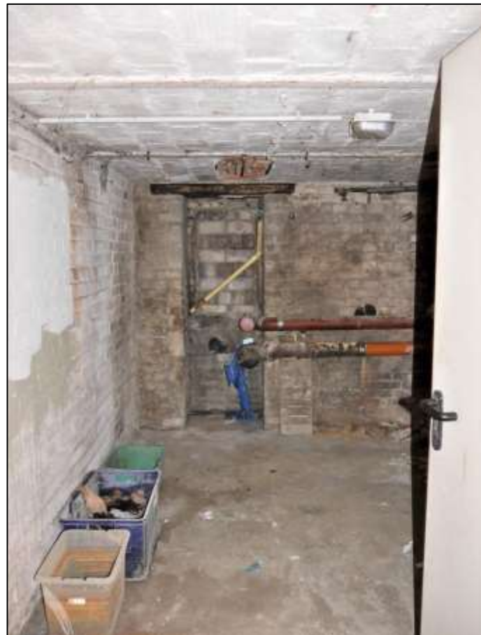
Abwasseran- schluss der Grundleitung im Keller des Vor- derhauses