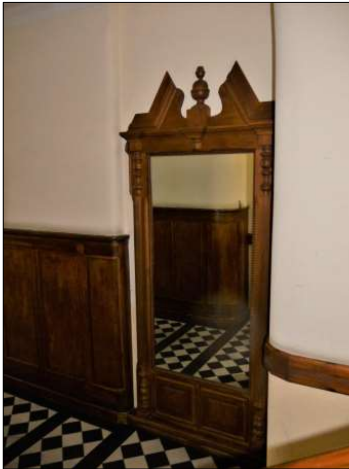
Spiegelpaneel im Bereich des ehemals links im Hauseingangsreich belegenen Eingangs zur linken Gewerbeeinheit