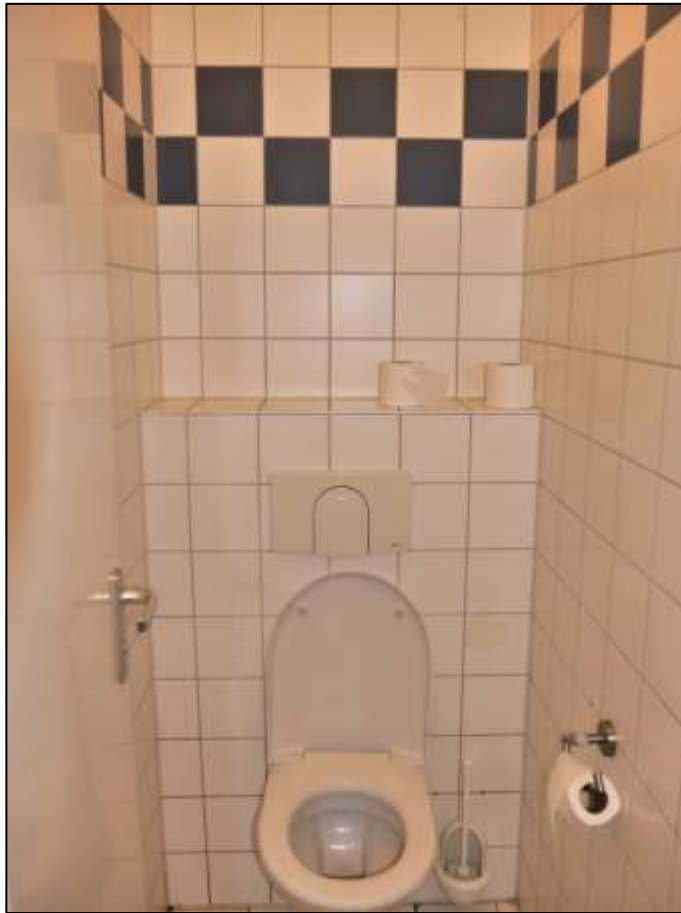
Sanitärbereich der im Erdge- schoss des Vorderhauses rechts belege- nen Gewerbe- einheit