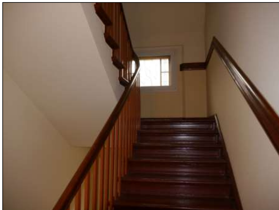
Treppenaufgang im Seitenflügel