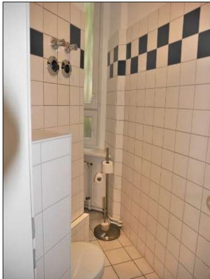
Toilettenraum der im 1.OG be- legenen zweck- entfremdet ge- nutzten Woh- nung