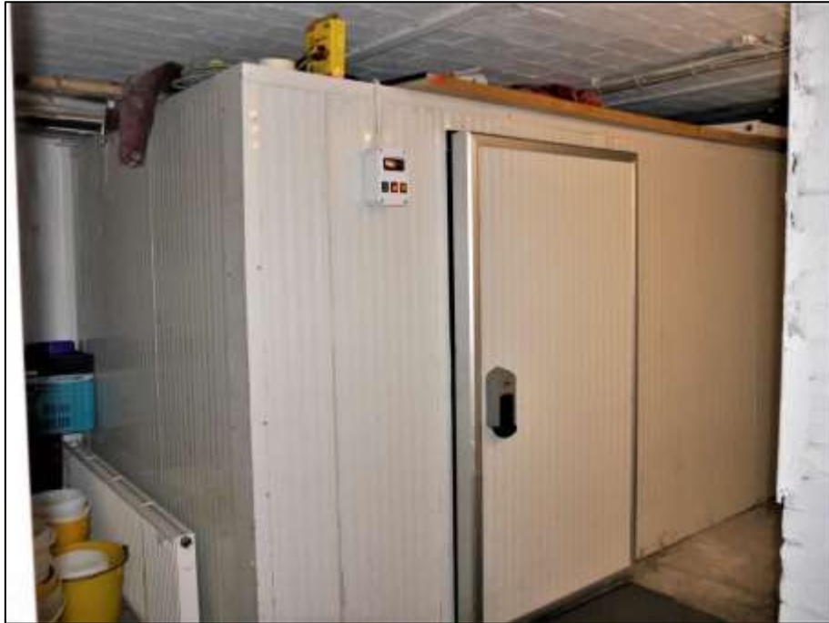
Lagerraumbereich mit Zugang aus der Kellertiefe der im Erdgeschoss des Vorderhauses links belegenen Gewerbeeinheit mit bauseitiger Kühlzelle