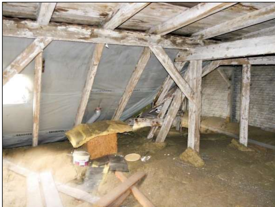
Rohdachboden im Vorderhaus