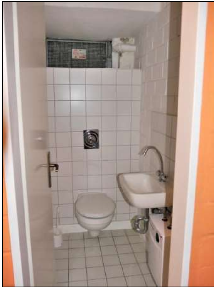
Blick aus der Kellerdiele der im Erdgeschoss des Vorderhauses links belegenen Gewerbeeinheit in einen anbindenden Toilettenraum