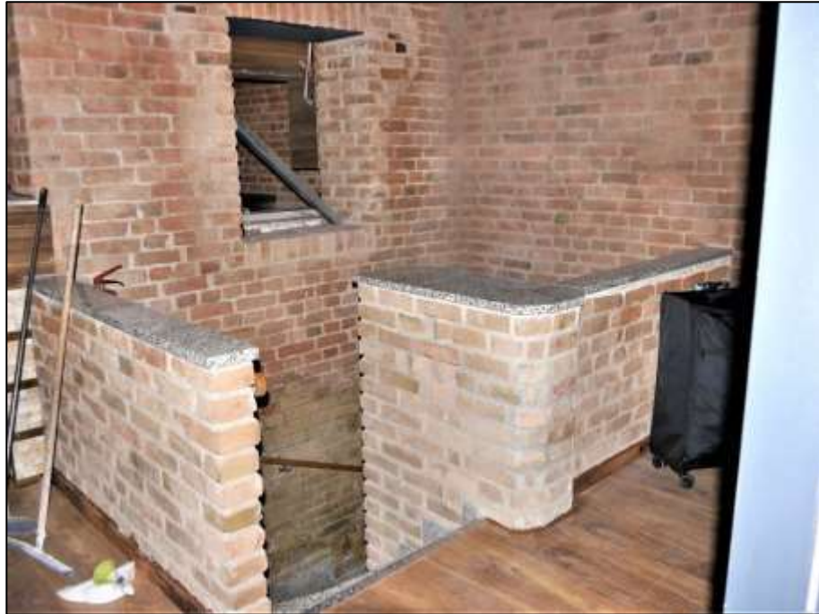
Kellertreppenabgang der im Erdgeschoss des Vorderhauses links belegenen Gewerbeeinheit zu den im Kellergeschoss belegenen geschlechtsspezifisch getrennten Toilettenräumen und dem Lagerbereich der Gewerbeeinheit