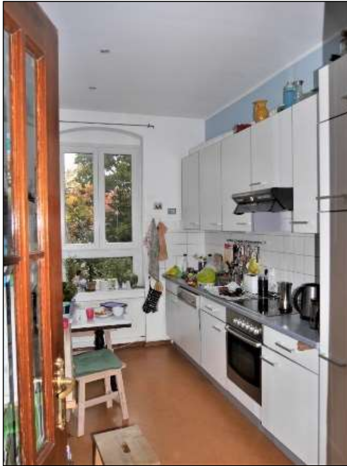
typische Küche im Vorderhaus