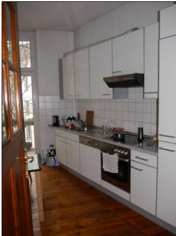
Küche einer vollmodernisier- ten Wohnung im Seitenflügel