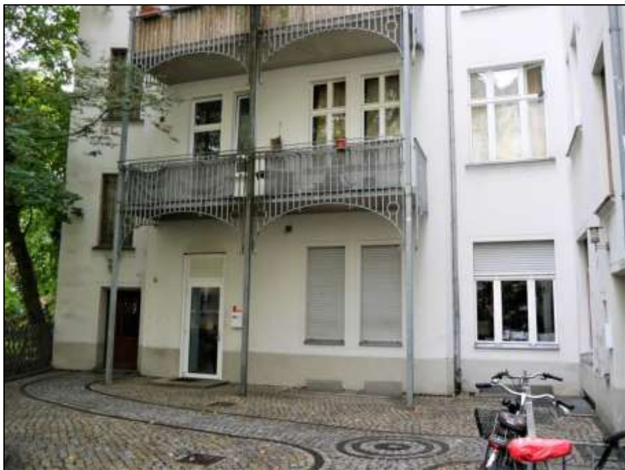
Erdgeschosszone des rechten Seitenflügels mit ab dem 1. Obergeschoss aufgehendem Balkon-Vorbau