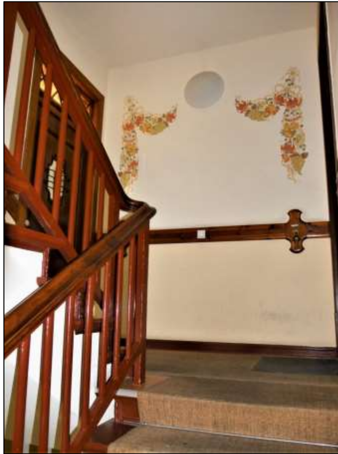
Treppenhaus- aufgang im Vorderhaus