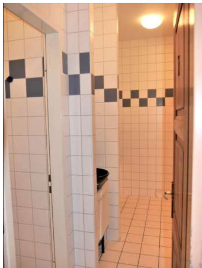
Sanitärbereich der im Erdge- schoss des Vorderhauses rechts belege- nen Gewerbe- einheit