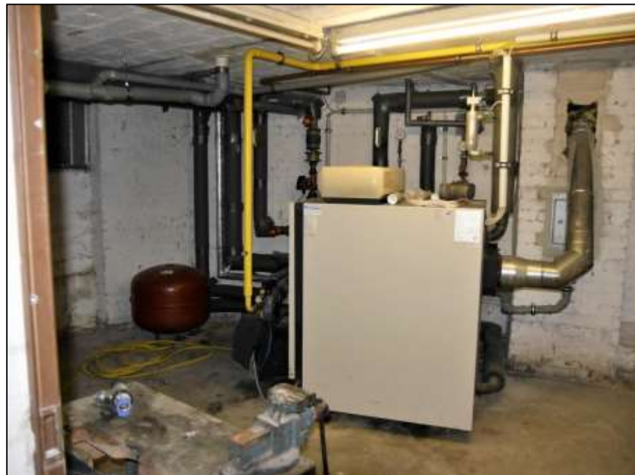
Heizzentrale im Kellergeschoss des Seitenflügels