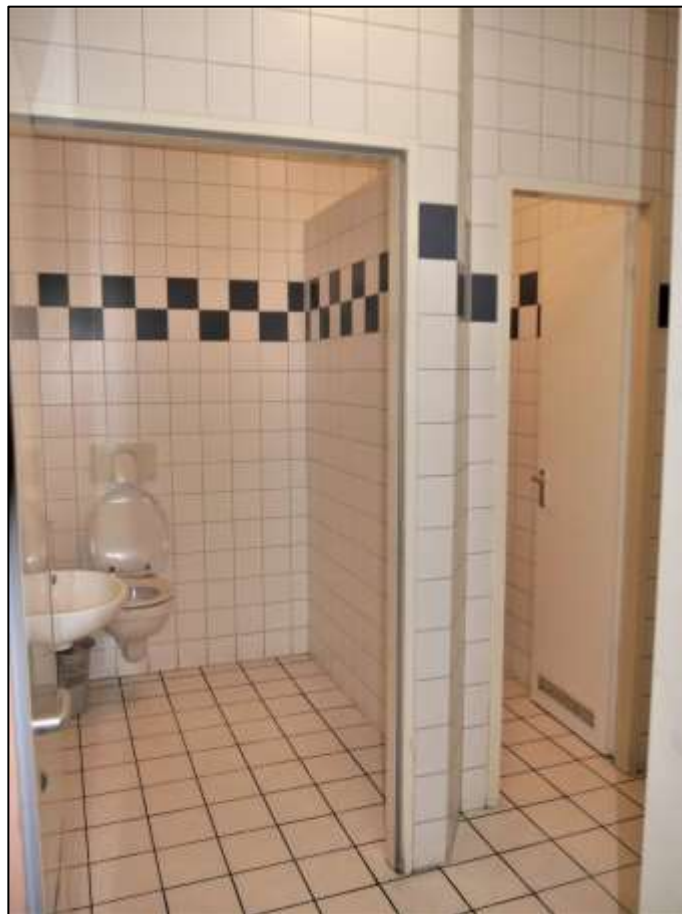
Sanitärbereich der im Erdge- schoss des Vorderhauses rechts belege- nen Gewerbe- einheit