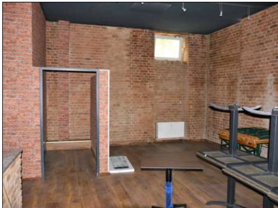
Schankraum der im Erdgeschoss des Vorderhauses links belegenen Gewerbeeinheit mit projektierte Nutzung als Cocktail-Bar