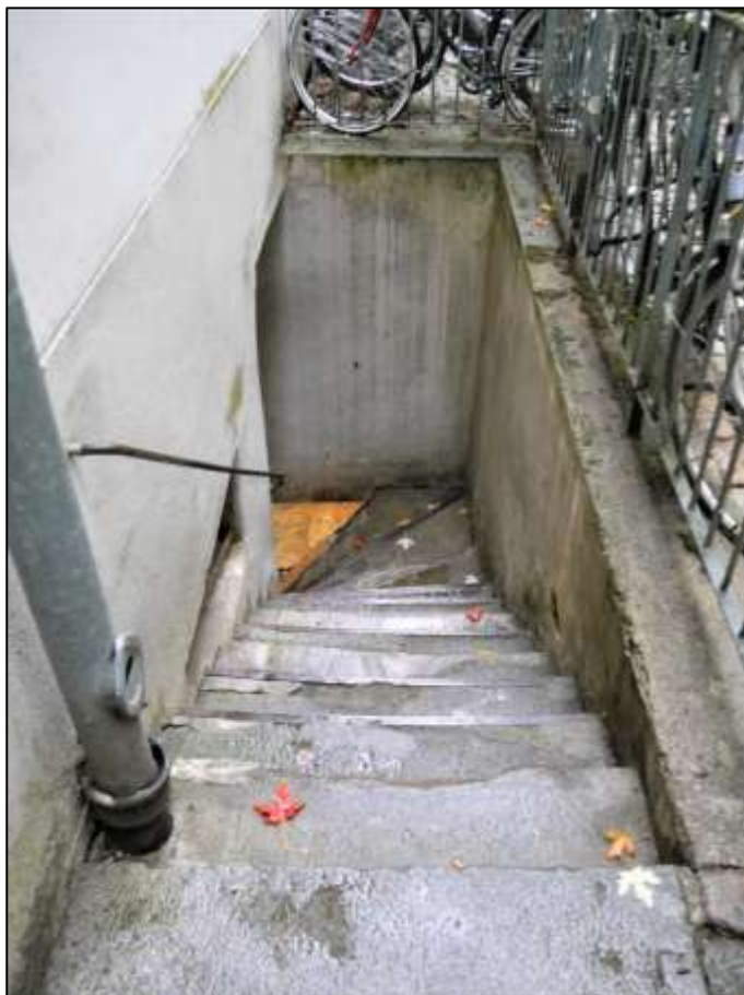
hinter dem Vorderhaus belegene Kelleraußentreppe