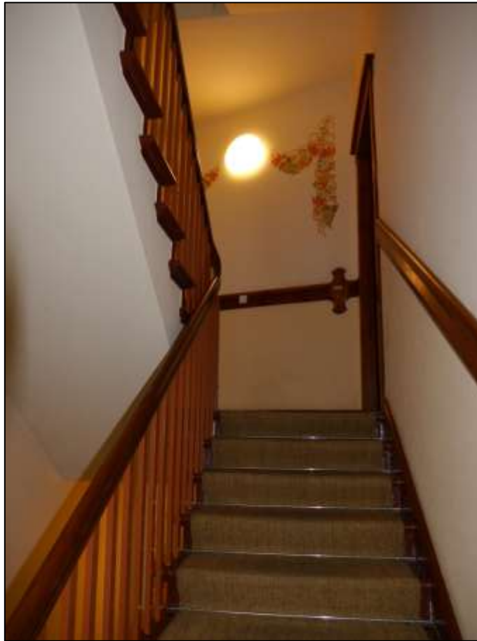
Treppenaufgang im Seitenflügel