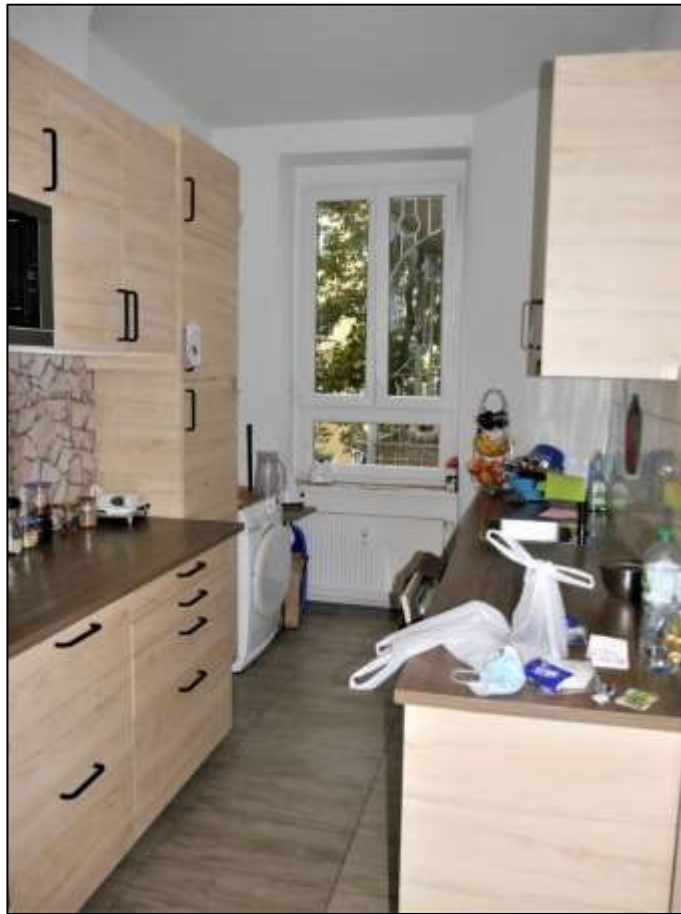
typische Küche im Vorderhaus