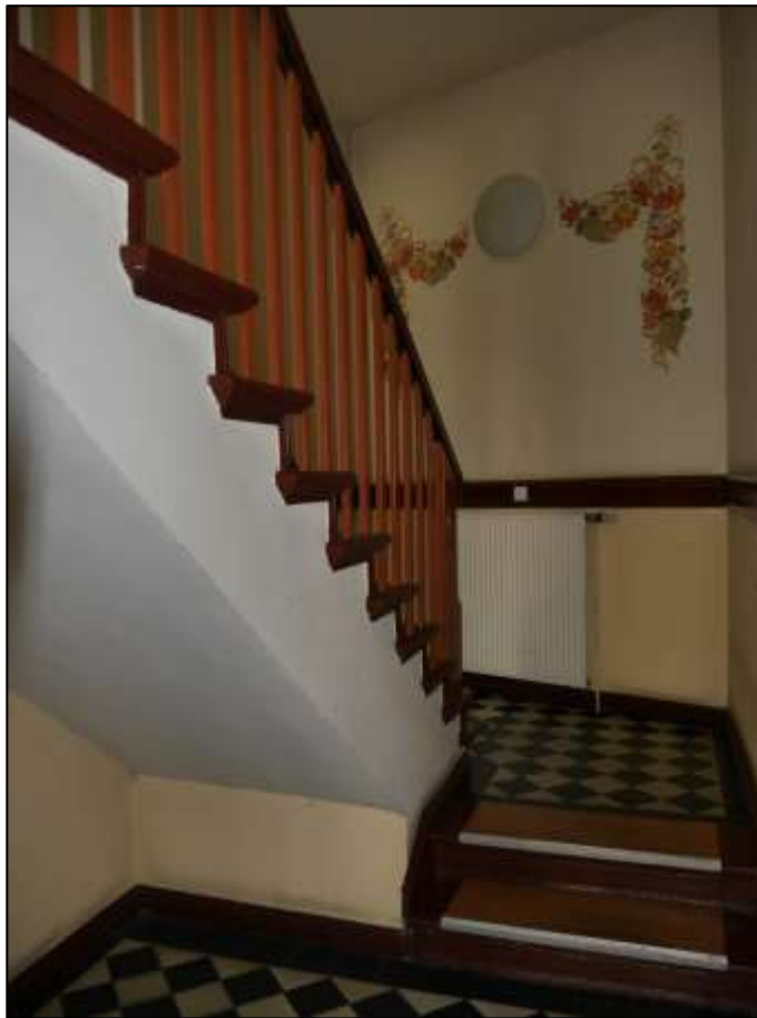
Hauseingangsbereich des Seitenflügels