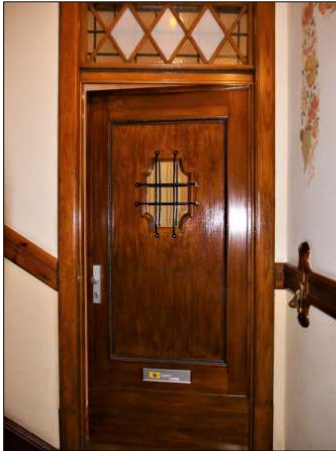
typische Wohnungseingangstür im Vorderhaus