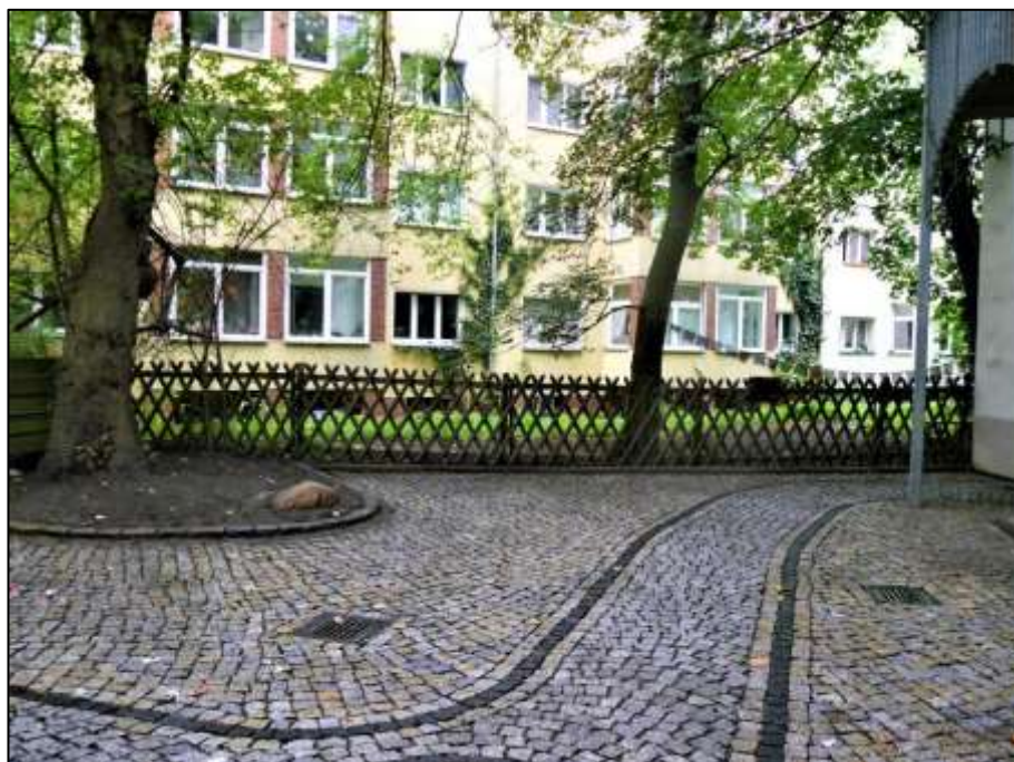
Hof des Anwesens mit Blick auf die rückwärtige Grundstücksgrenze