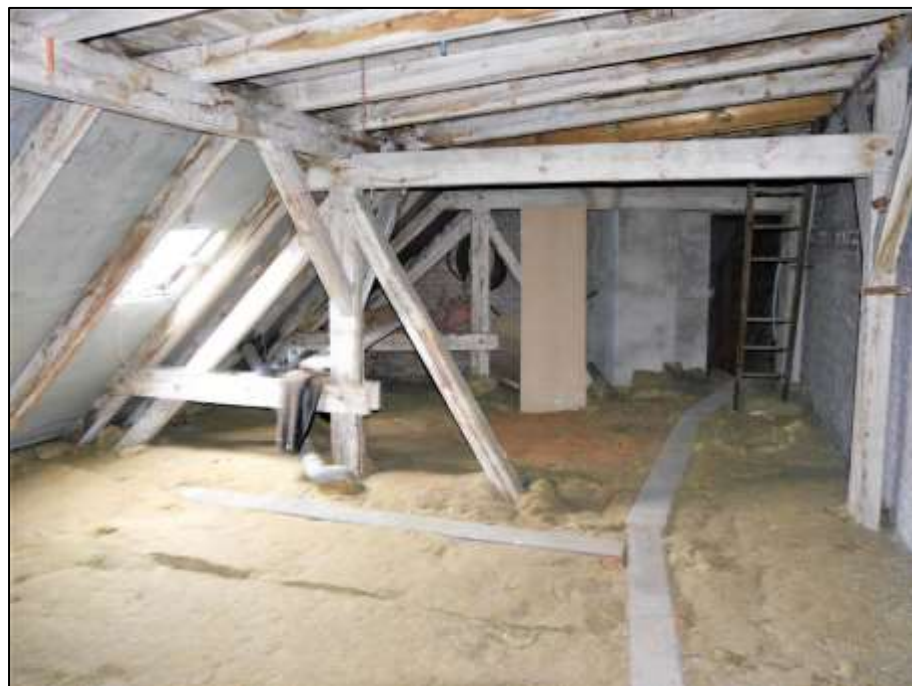
Rohdachboden im Vorderhaus