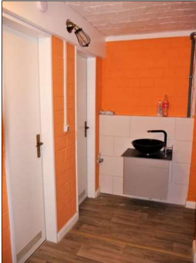
Kellerdiele der im Erdgeschoss des Vorderhauses links belegenen Gewerbeeinheit mit anbindenden geschlechts-spezifisch getrennten Toilettenräumen und dem Lager-raumbereich der Gewerbe-einheit