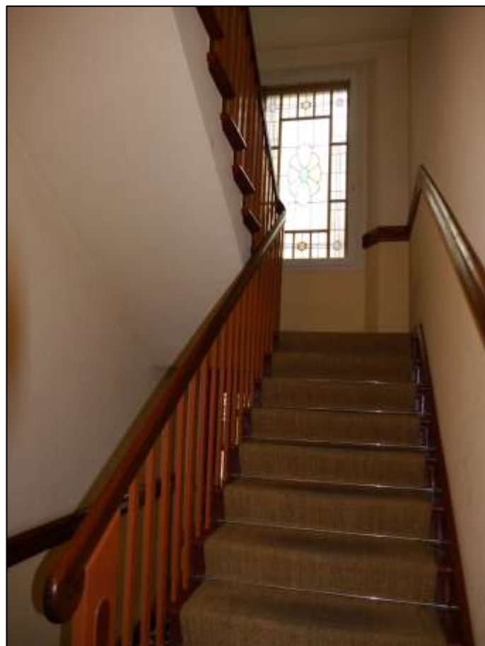
Treppenaufgang im Seitenflügel