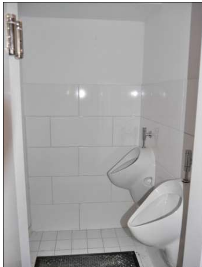
Blick aus der Kellerdiele der im Erdgeschoss des Vorderhauses links belegenen Gewerbeeinheit in einen anbindenden Toilettenraum