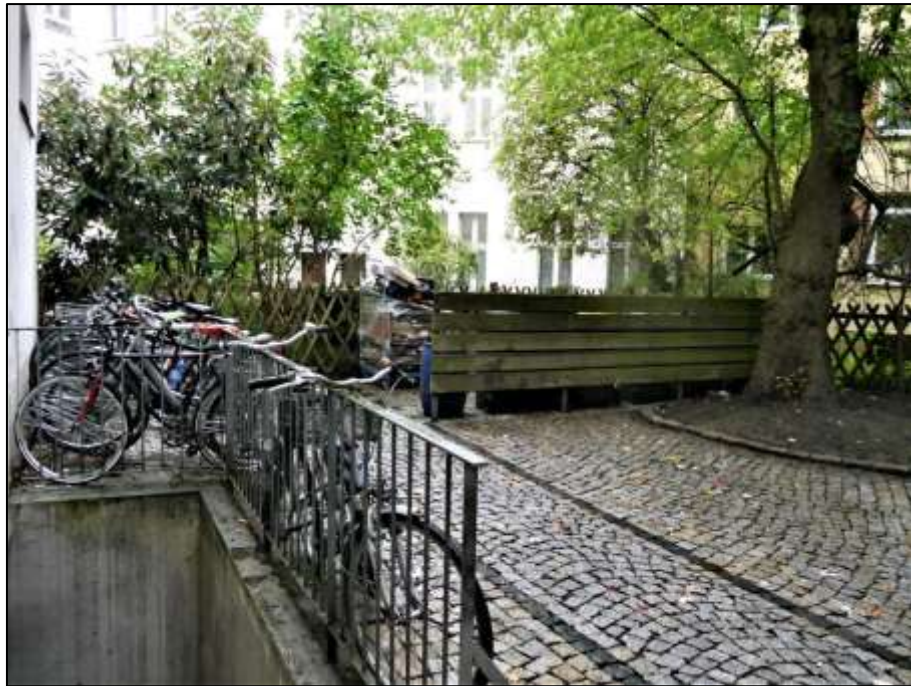
Blick über den Hof des Anwesens auf die linke Grundstücksgrenze