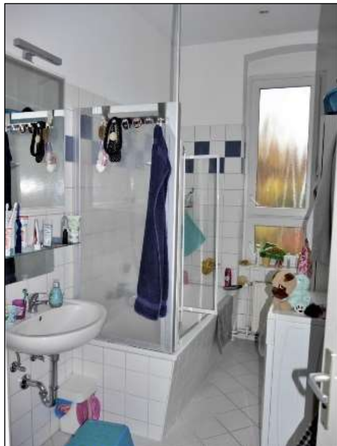
typisches Ba- dezimmer im Vorderhaus