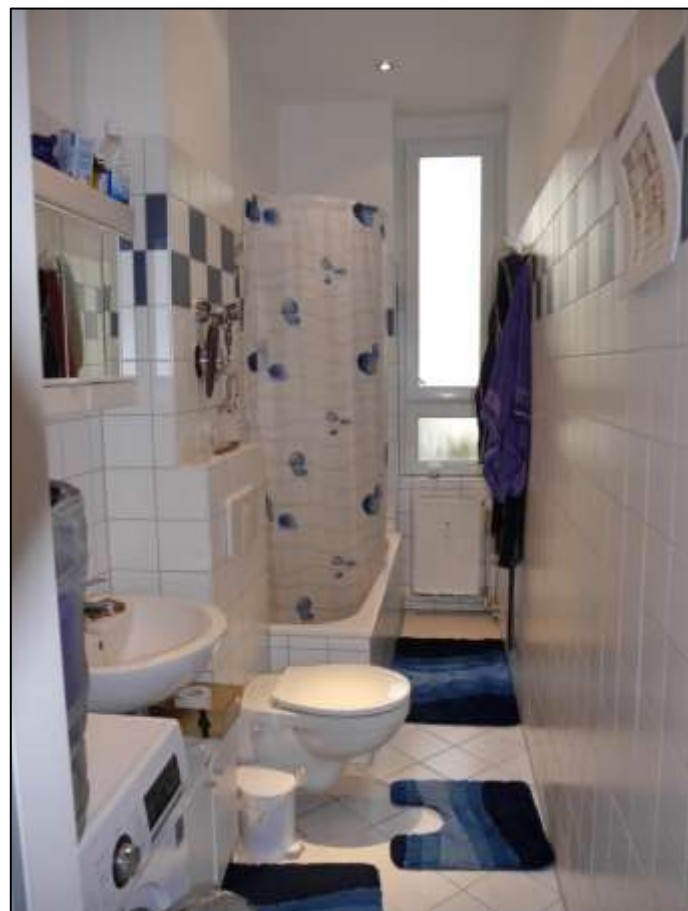
Badezimmer einer vollmodernisier-ten Wohnung im Seitenflügel