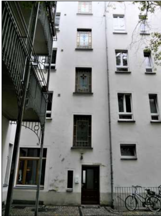
hofseitige Front des Vorderhau- ses