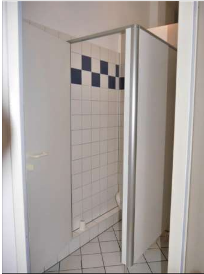
Toilettenraum der im 1.OG be- legenen zweck- entfremdet ge- nutzten Woh- nung