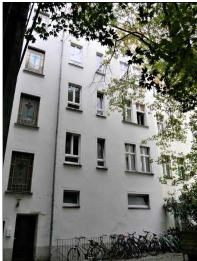
hofseitige Front des Vorderhau- ses