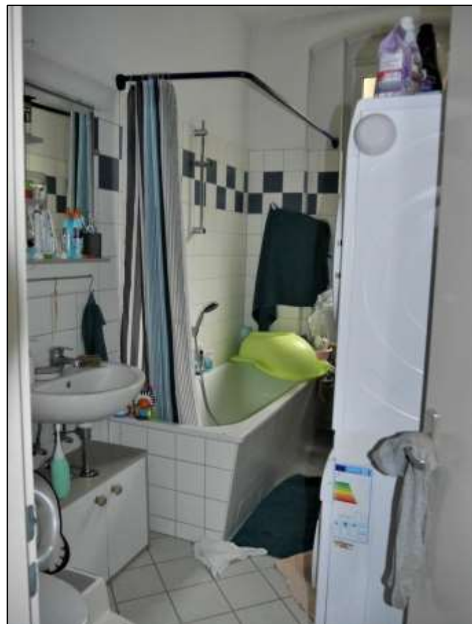
typisches Ba- dezimmer im Vorderhaus