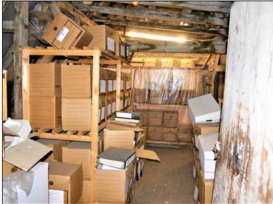
Rohdachboden im Vorderhaus mit abgespanntem Abteil zur Lagerung von Verwaltungsakten der auf dem Grundstück ansässigen Grundstücksverwaltung