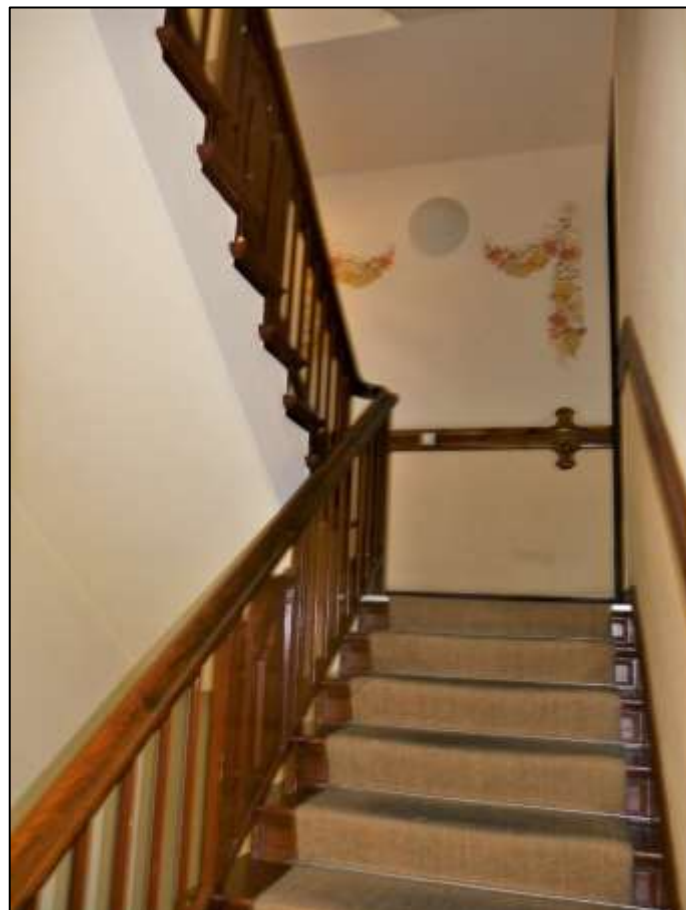
Treppenhaus- aufgang im Vorderhaus