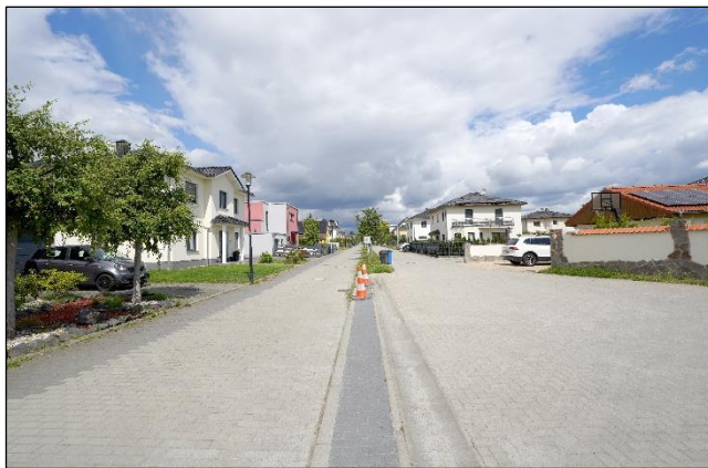
Straßenverlauf des Seeadlerweges