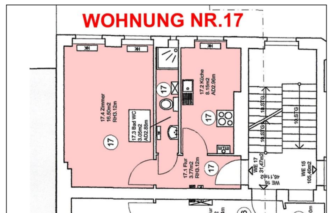
Grundriss Wohnung Nr. 17