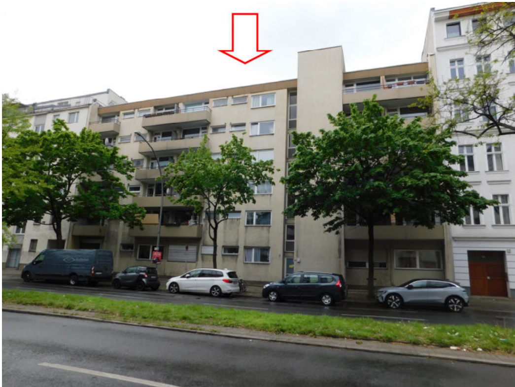
Kaiser-Friedrich-Straße 43, 44 in 10627 Berlin-Charlottenburg - straßenseitige Gebäudeansicht und Zufahrt zum Innenhof und in die Tiefgarage -