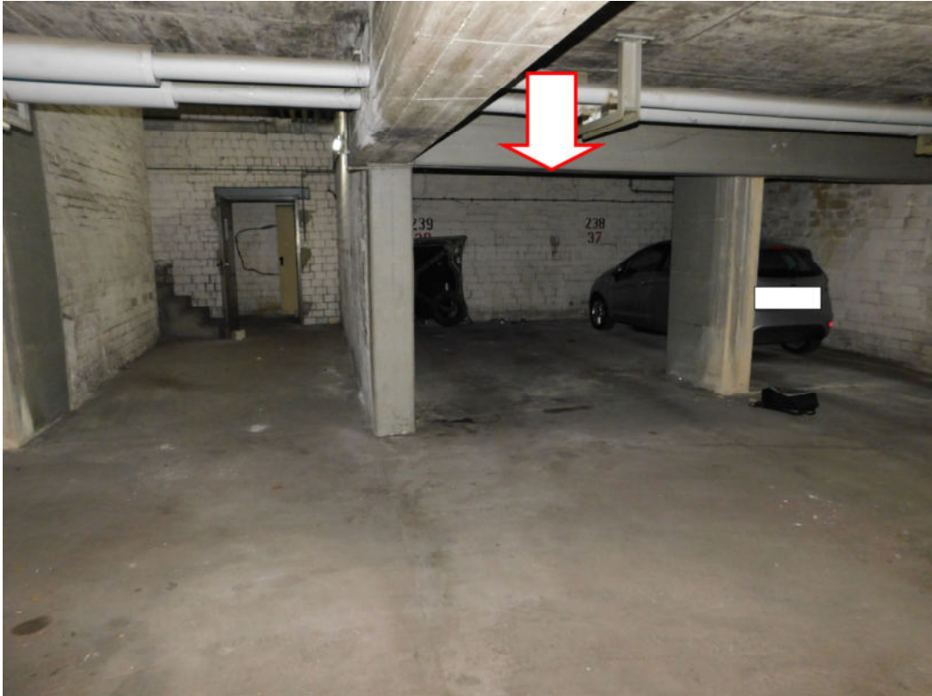
- Detail TG-Stellplatz Nr. 239 und geradlinige Zufahrt -