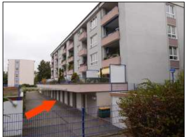
Blick in den Garagenhof mit Garage Nr. 32