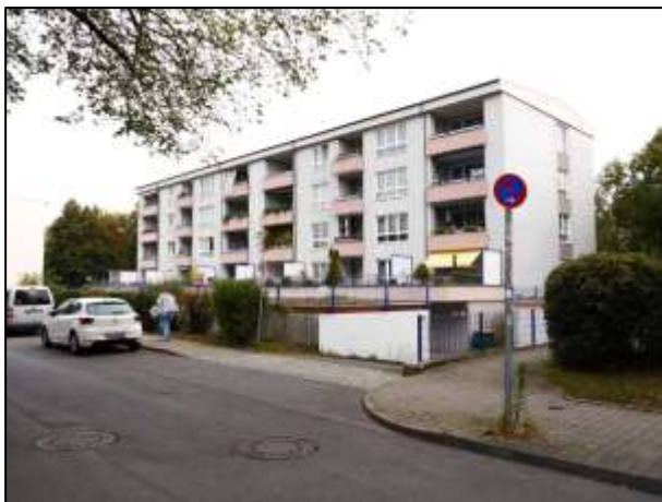
straßenseitige Grundstücksfront mit Rampe