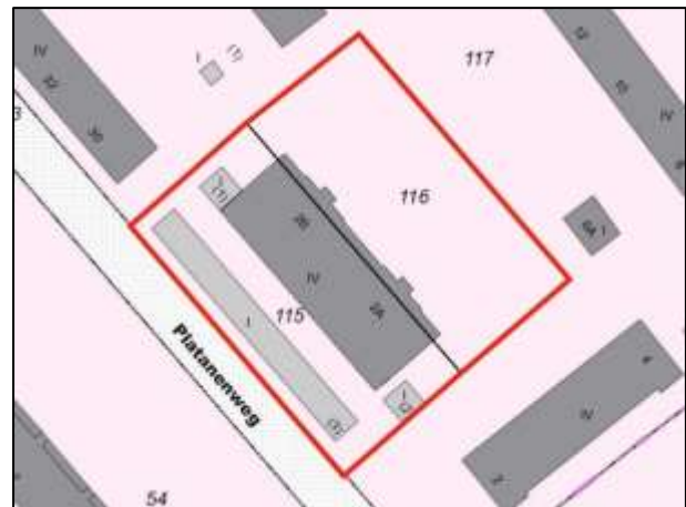
Flurkarte (Platanenweg 2A, 2B)