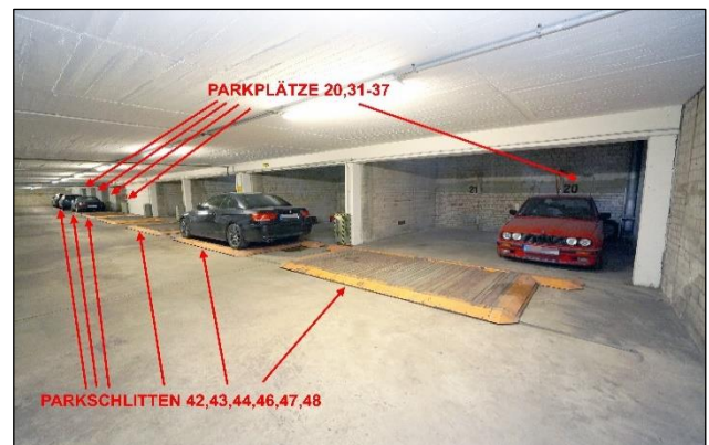
Pkw-Stellplätze in Tiefgarage